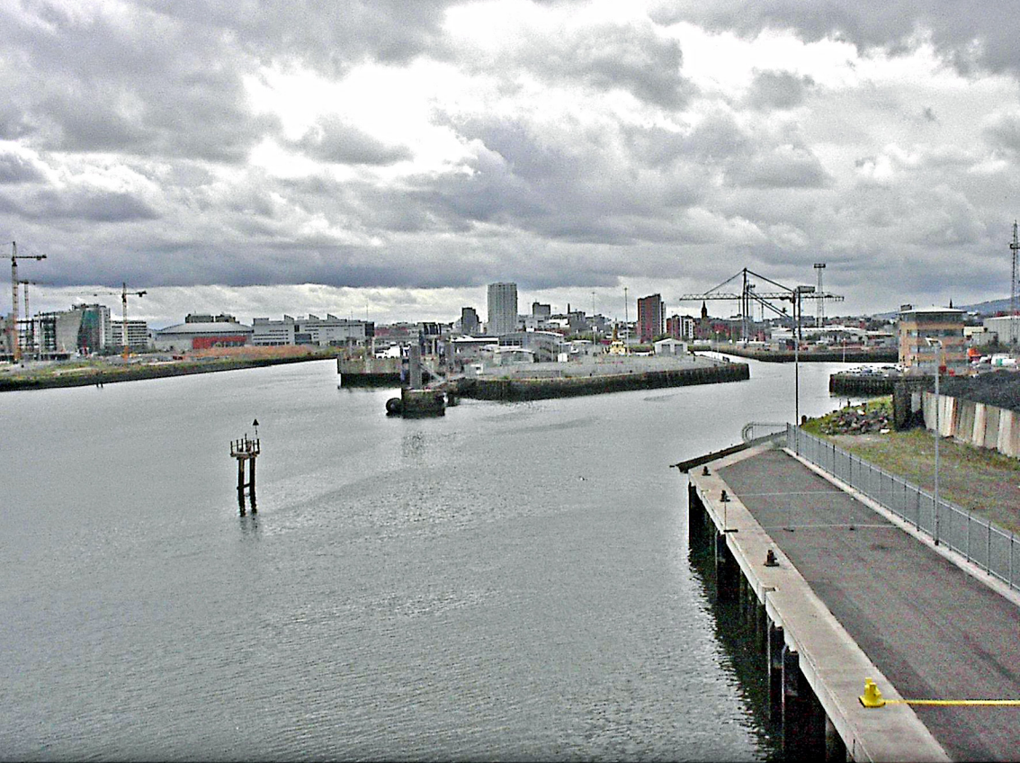
Belfast - Hafen