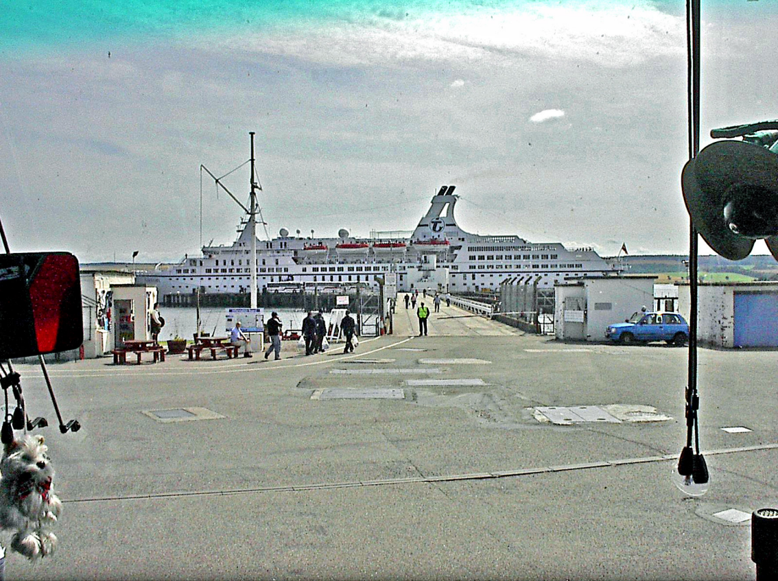
Invergordon - Blick auf die Astor