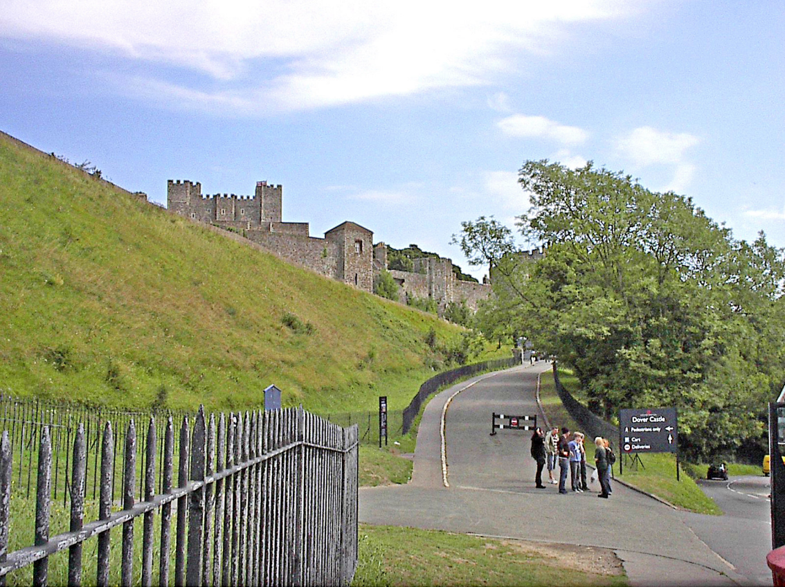
Dover - Auffahrt zur Burg