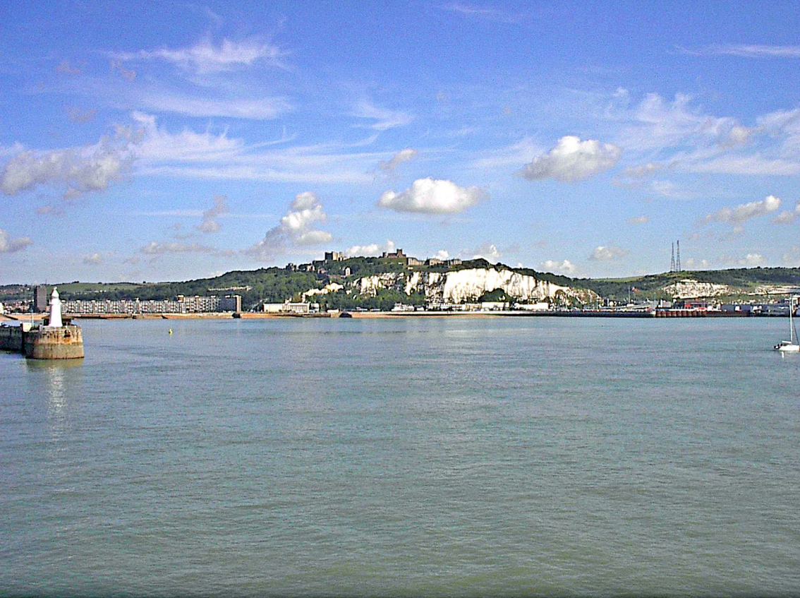
Kreisefelsen von Dover und die Burg