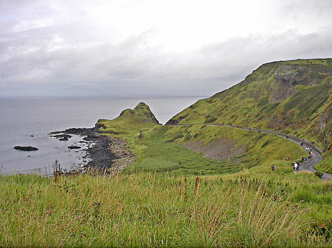
Antrimküste - der Weg zum Giants Causway