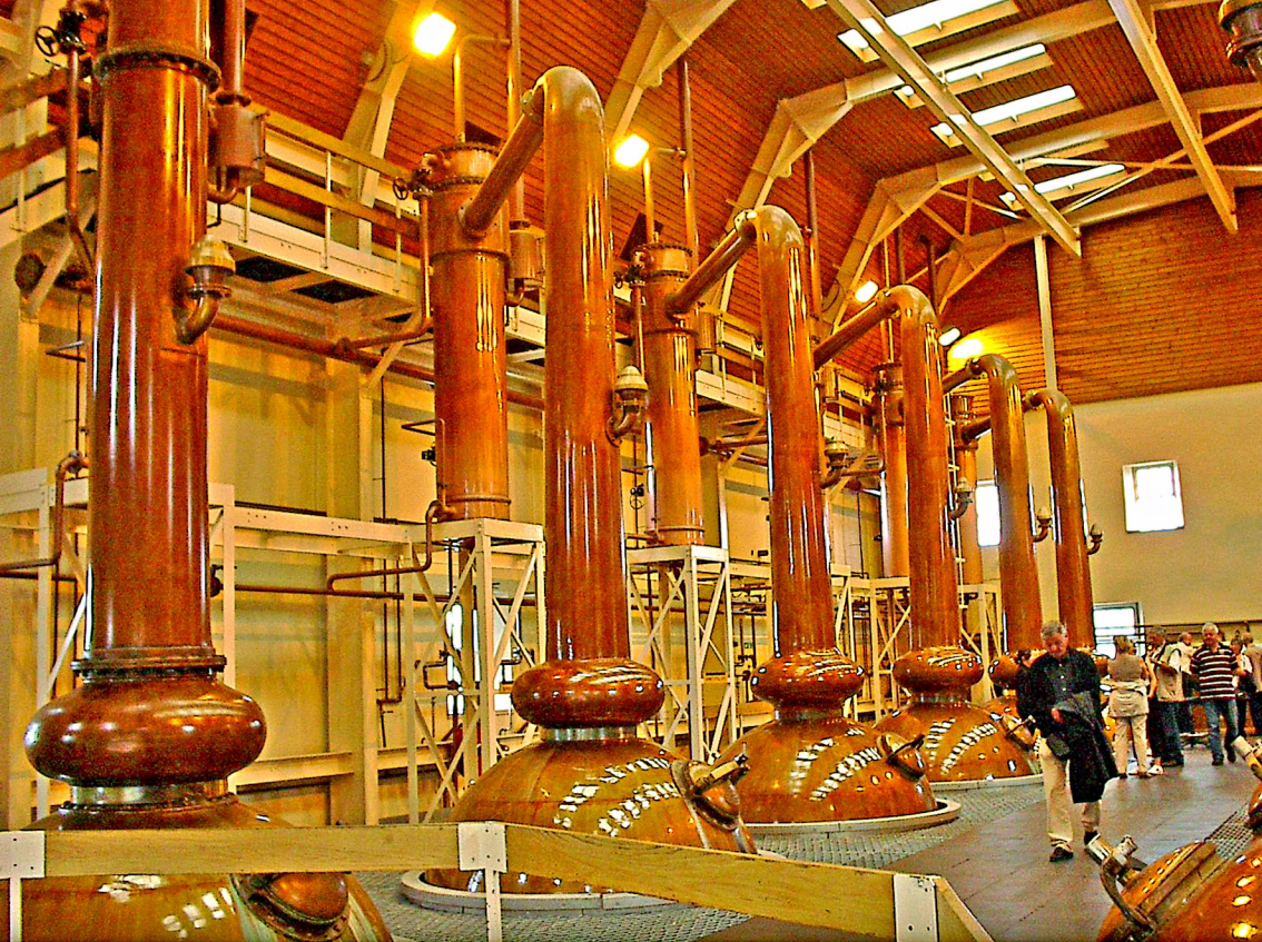
Glen Morangie Destillerie