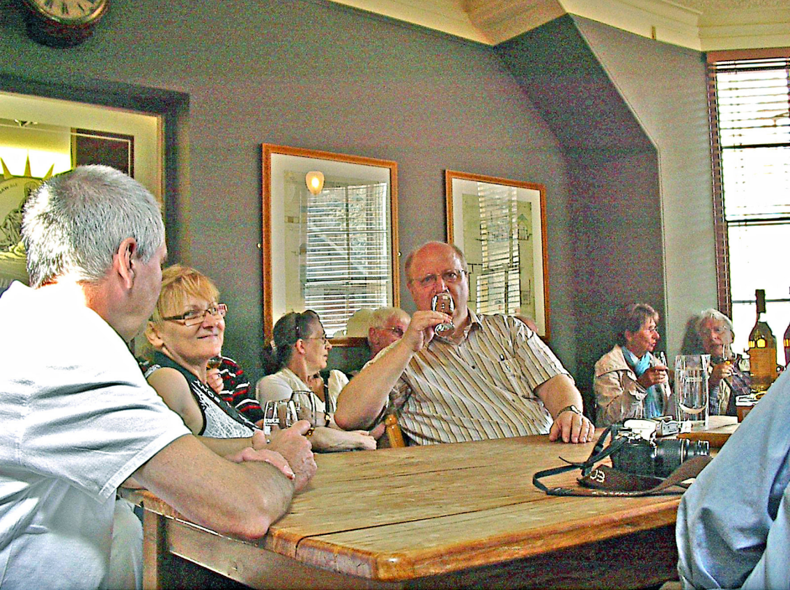
Glen Morangie Destillerie - Probiertube