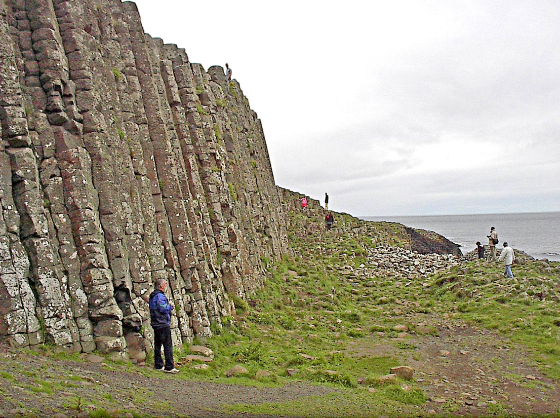
Antrimküste - Giants Causeway