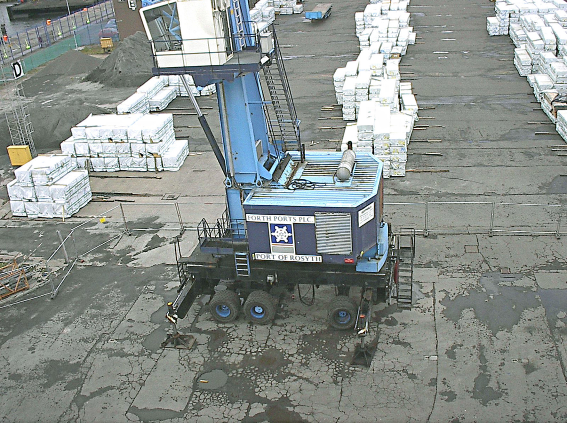
im Hafen von Rosyth