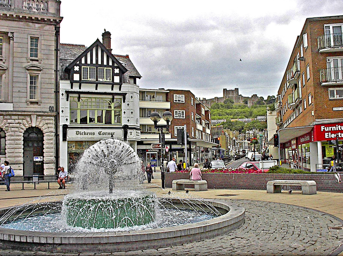
Dover - Stadt-Zentrum