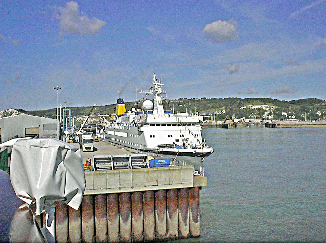
Dover - Fährhafen