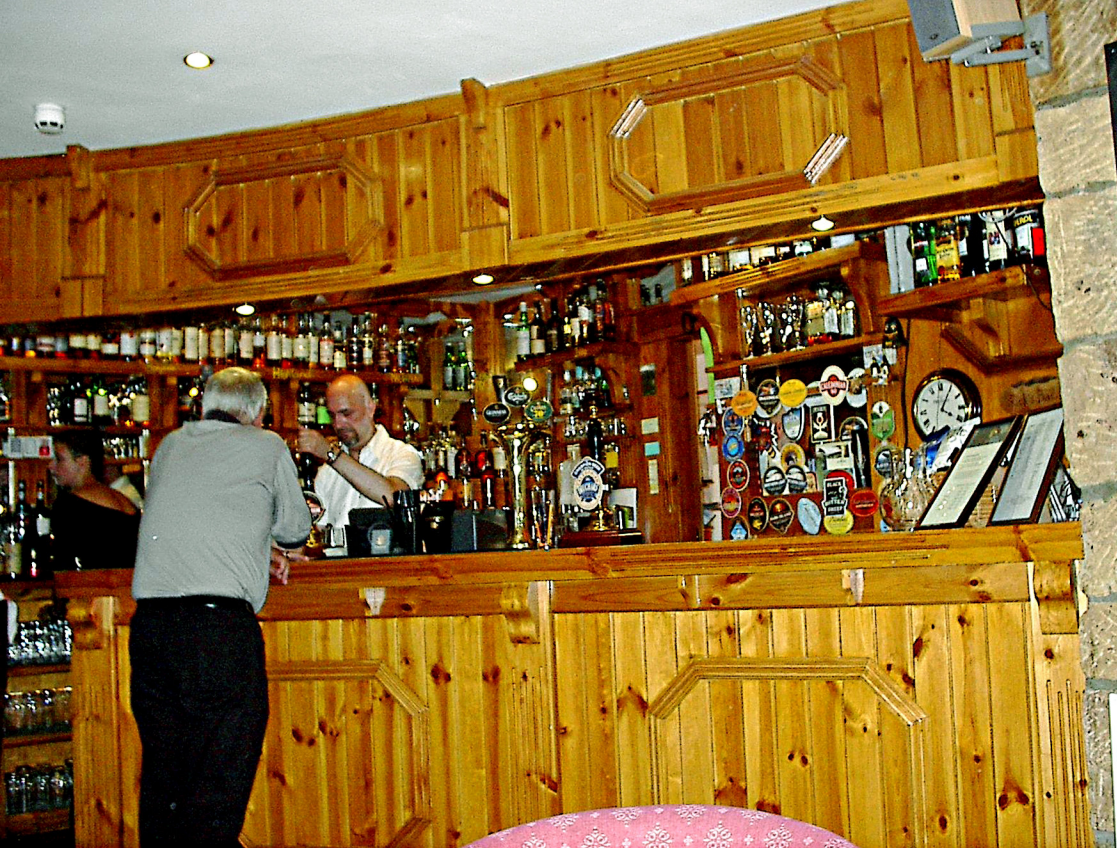
Dornoch - die Guinness-Quelle im Jail