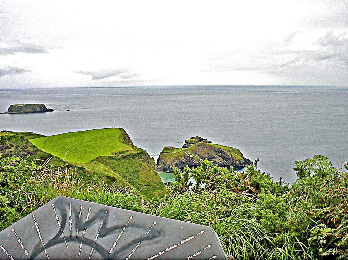
Aussichtspunkt an der Antrimküste - Carrick-a-rede Rope Hängebrücke