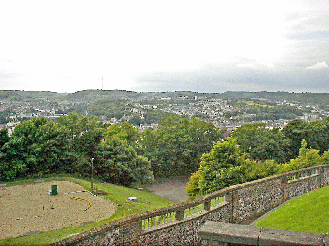
Dover - Blick von der Burg