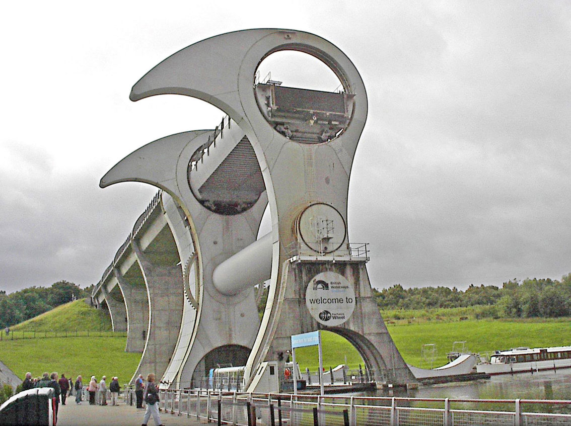
Falkirk-Wheel - und jetzt sind die Wannen wieder eingerastet