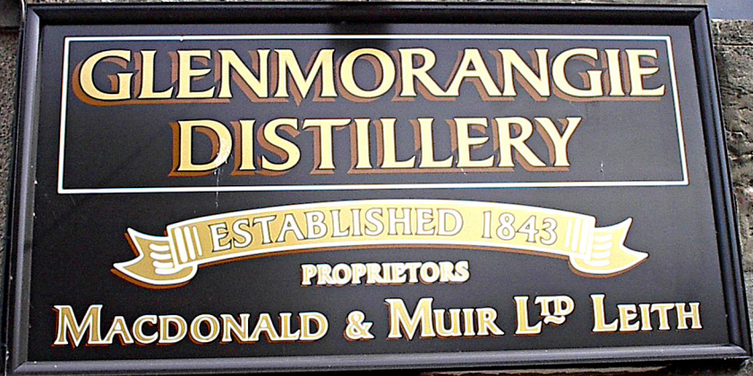
Glen Morangie Destillerie