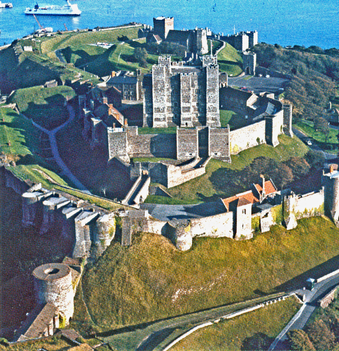
Dover - Burg