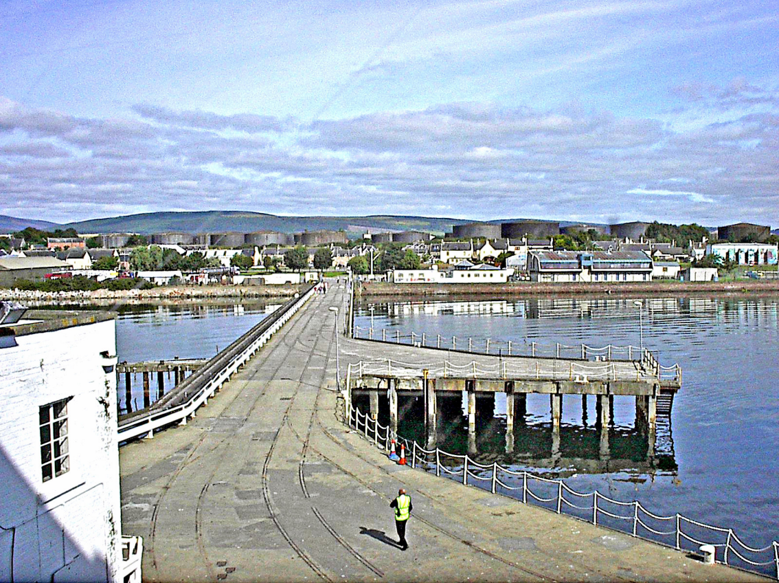
Invergordon - Hafen