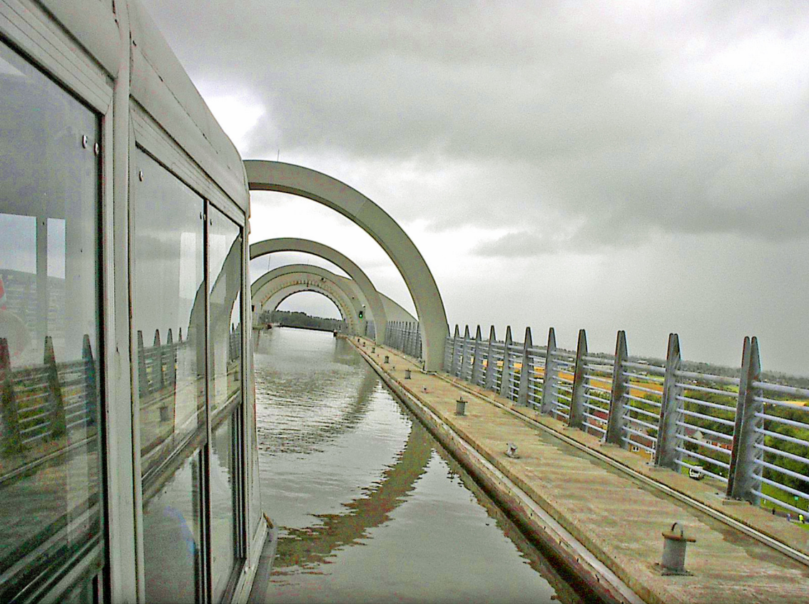
Falkirk-Wheel - das Boot schwimmt aus der oberen Wanne in den Kanal