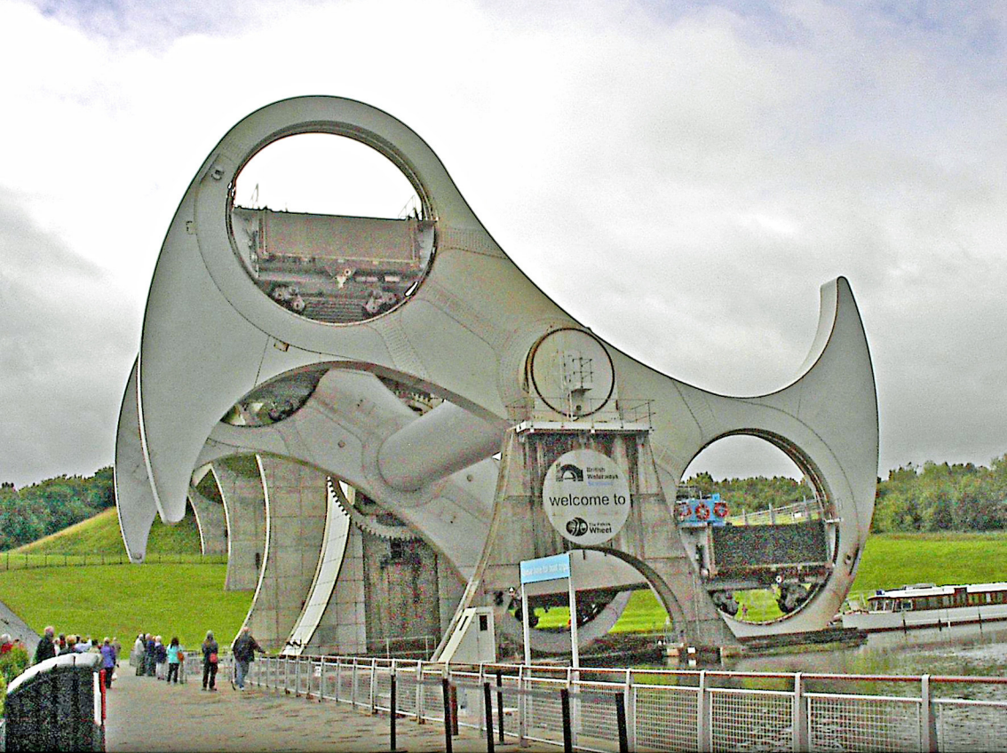
Falkirk-Wheel - die Drehung der Wannen beginnt