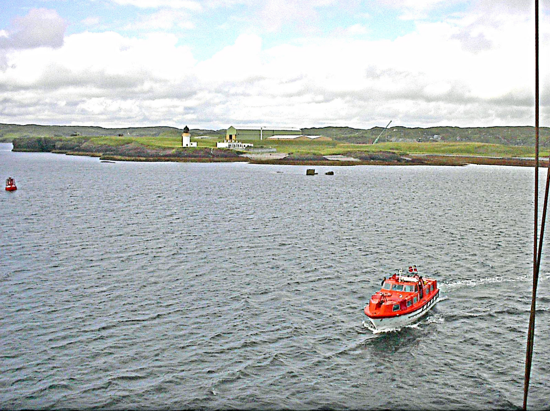
Stornoway auf Lewis