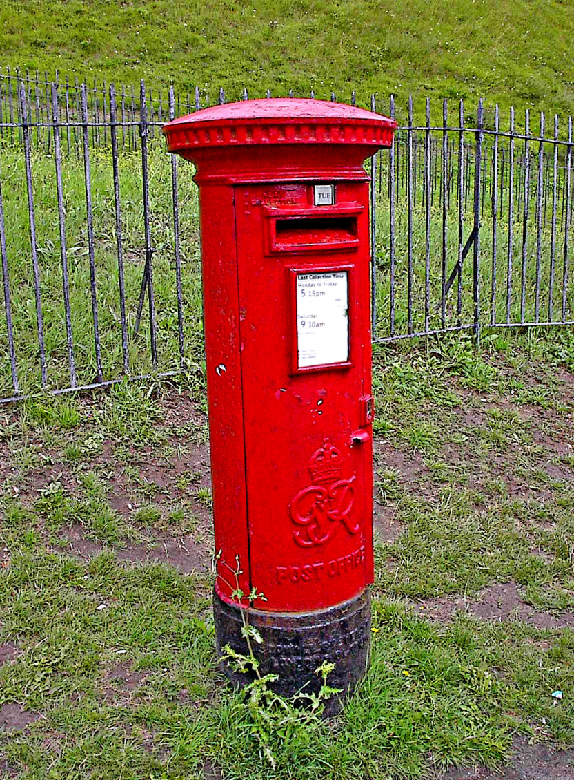
eine schöner Briefkasten bei der Burgauffahrt