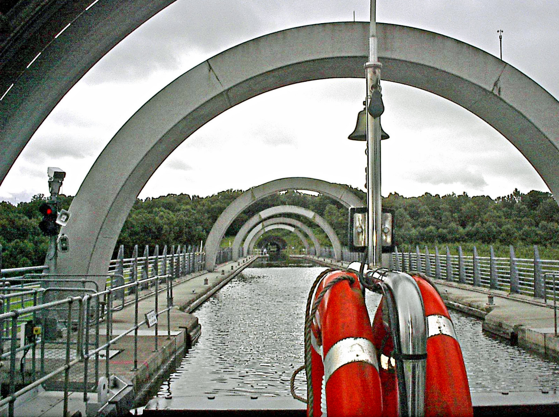
Falkirk-Wheel - Blick von der oberen Wanne in den Tunnel