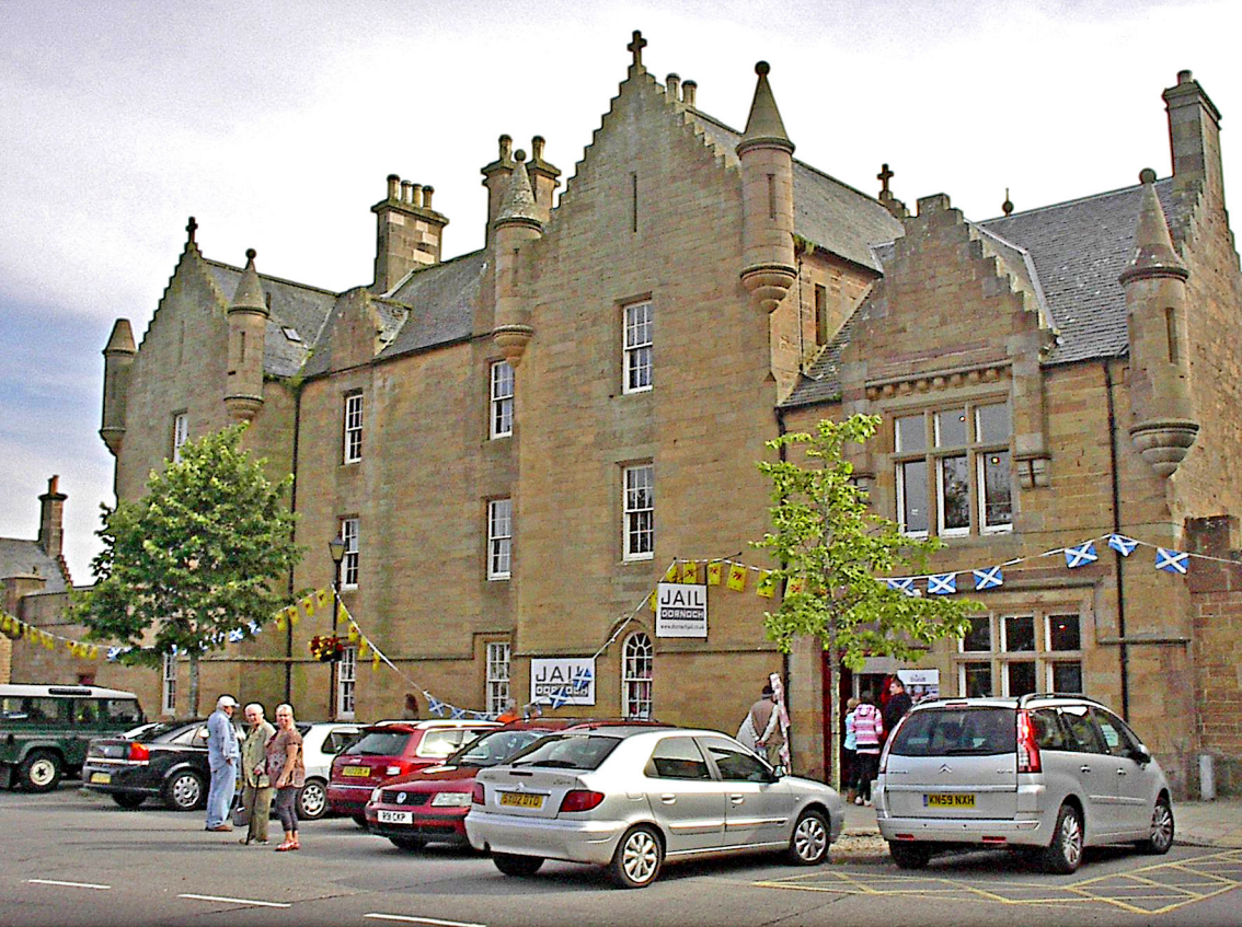
Dornoch - im Jail gab Guinness