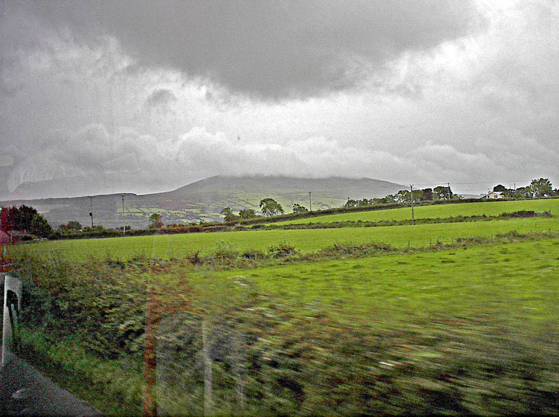
letzter Blick auf die Nordirische Landschaft - Abschiedswetter