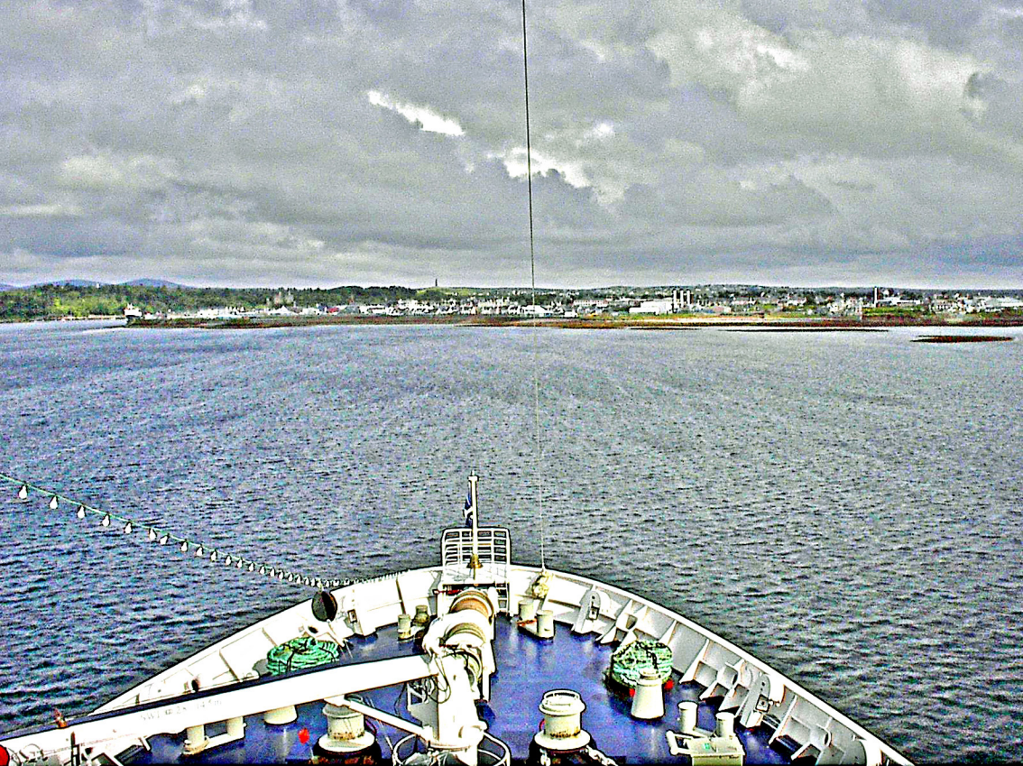
Stornoway auf Lewis