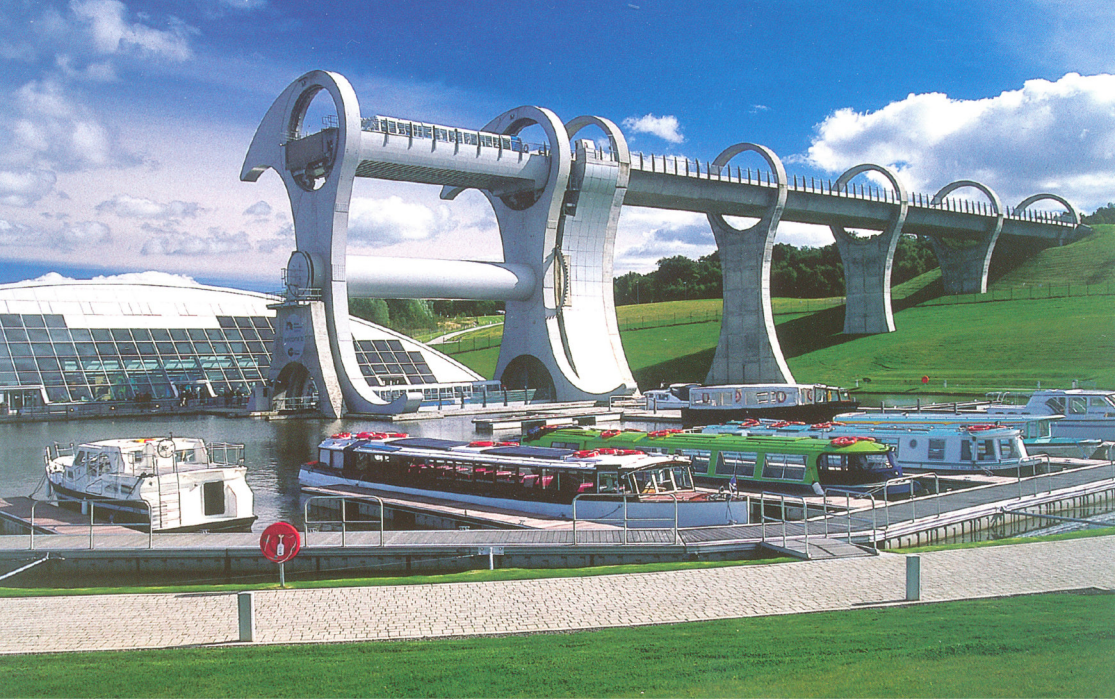
Falkirk-Wheel - Schiffshebewerk am Forth & Clyde Kanal