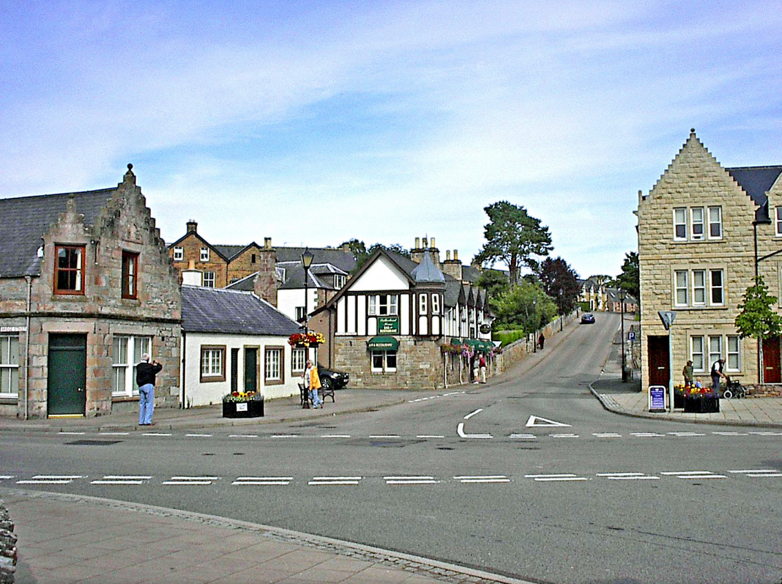
Dornoch - in dieser Straße soll die Autorin Pilcher wohnen