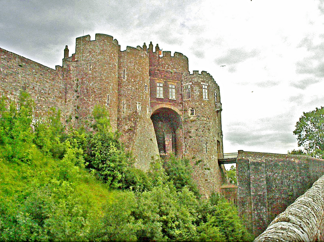
Dover - Burg