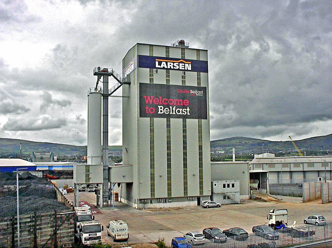
Belfast - Hafen