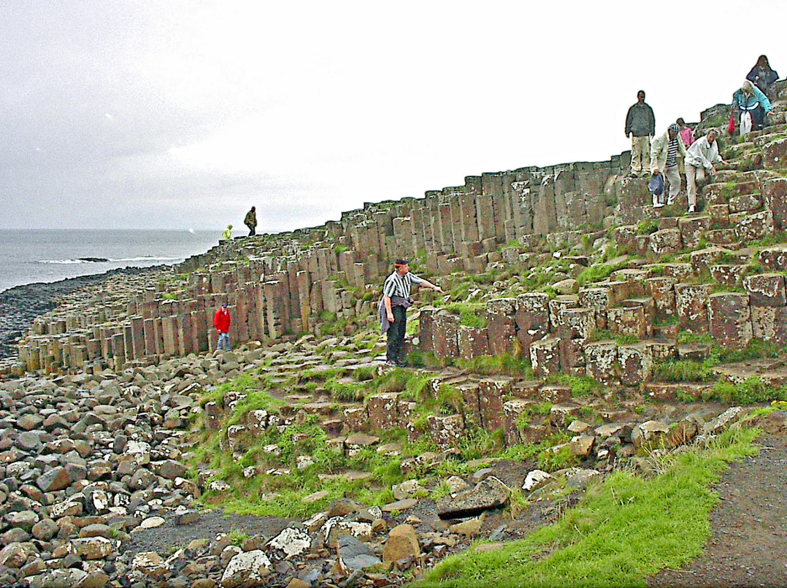
Antrimküste - Giants Causeway