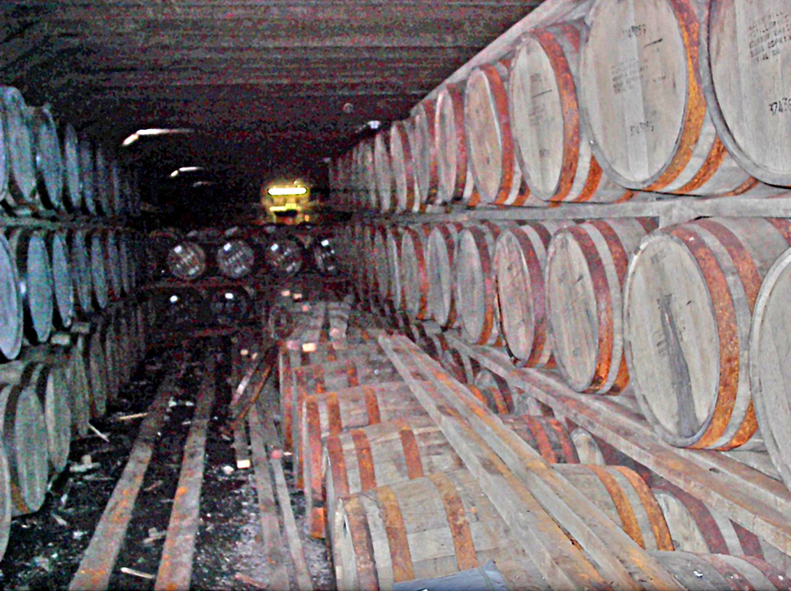
Glen Morangie Destillerie - Lager