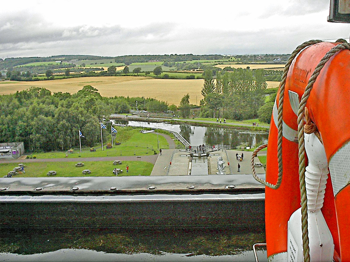
Falkirk-Wheel - Blick von der oberen Wanne auf den unteren Kanal