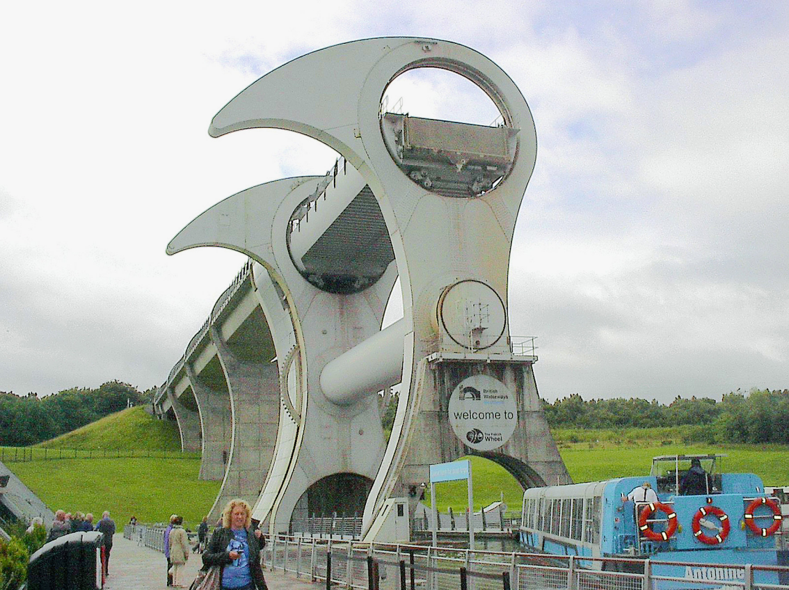
Falkirk-Wheel - die Wannen mit den Booten sind eingerastet