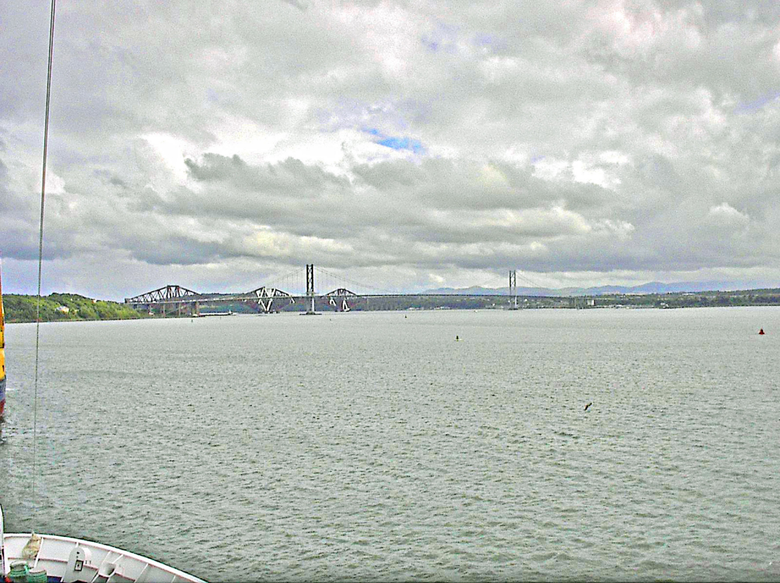
Brücke über den First of Forth