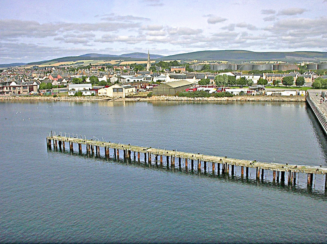
Invergordon - Blick von der Astor auf die Stadt