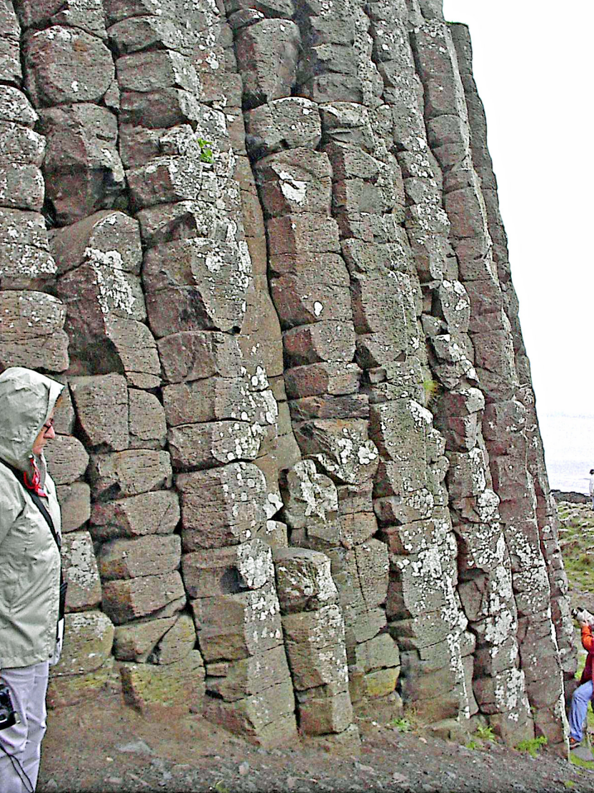
Antrimküste - Giants Causeway