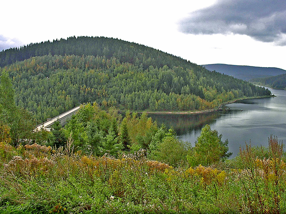
Eibenstock'er Talsperre, vom Aussichtspunkt