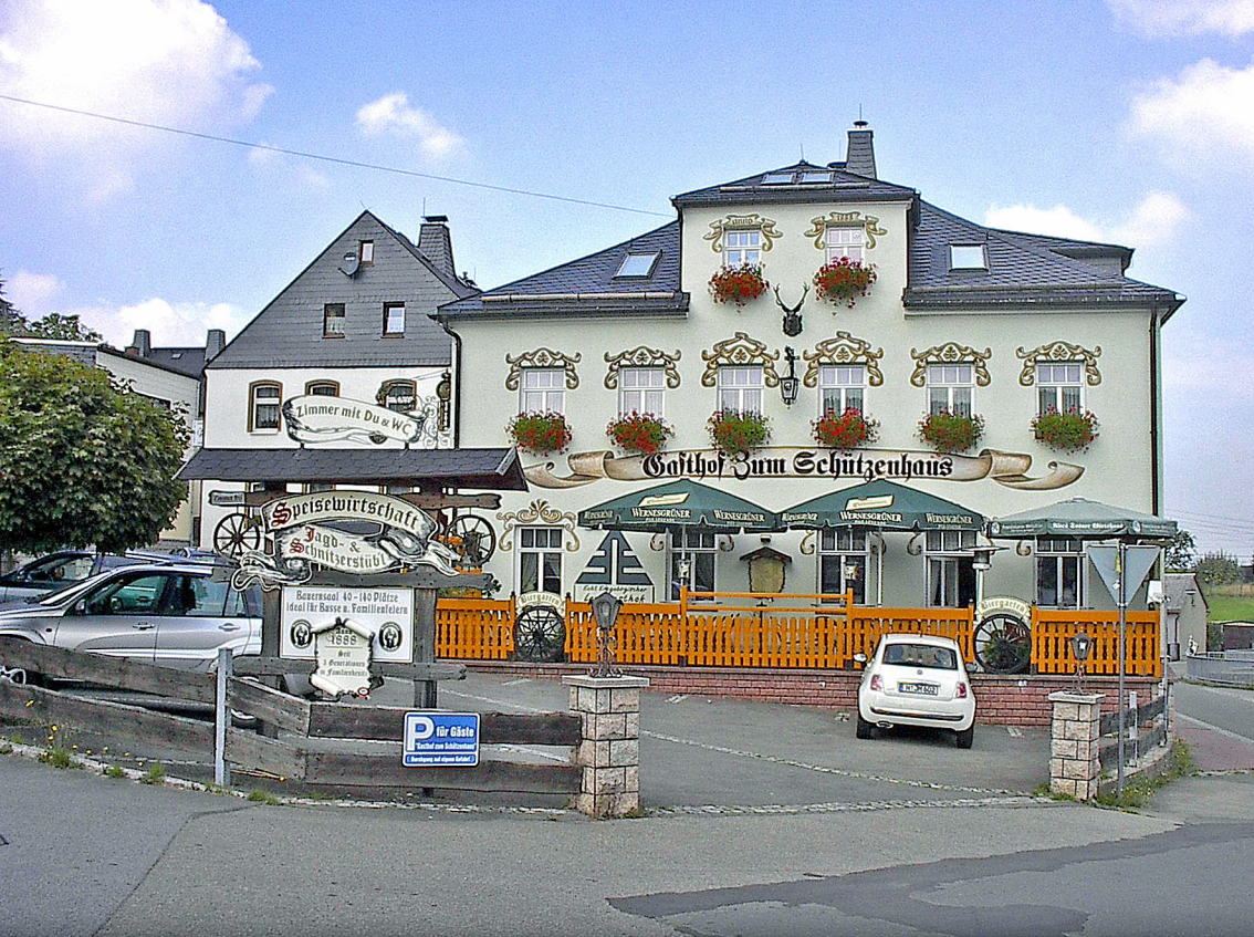
Sosa - ein schönes Hotel