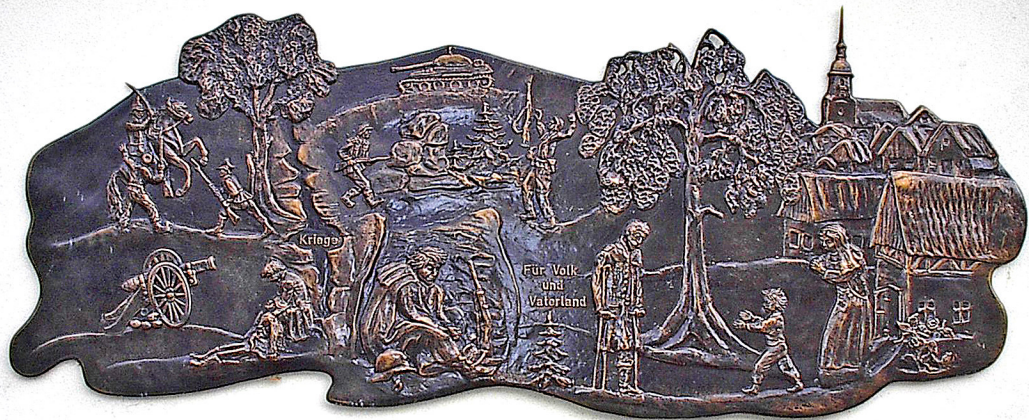
Für Volk und Vaterland Kunstschmiedearbeit an der Kirchenseite