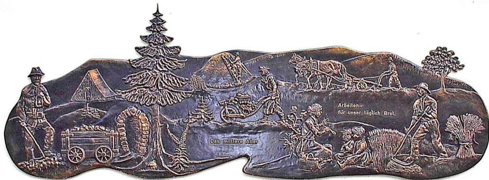
Das mittlere Alter Kunstschmiedearbeit an der Kirchenseite