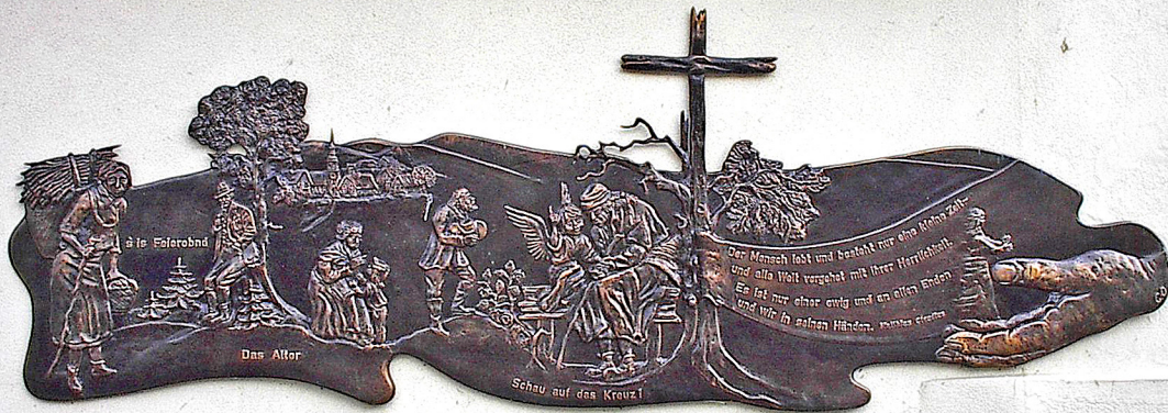
Das Alter Kunstschmiedearbeit an der Kirchenseite