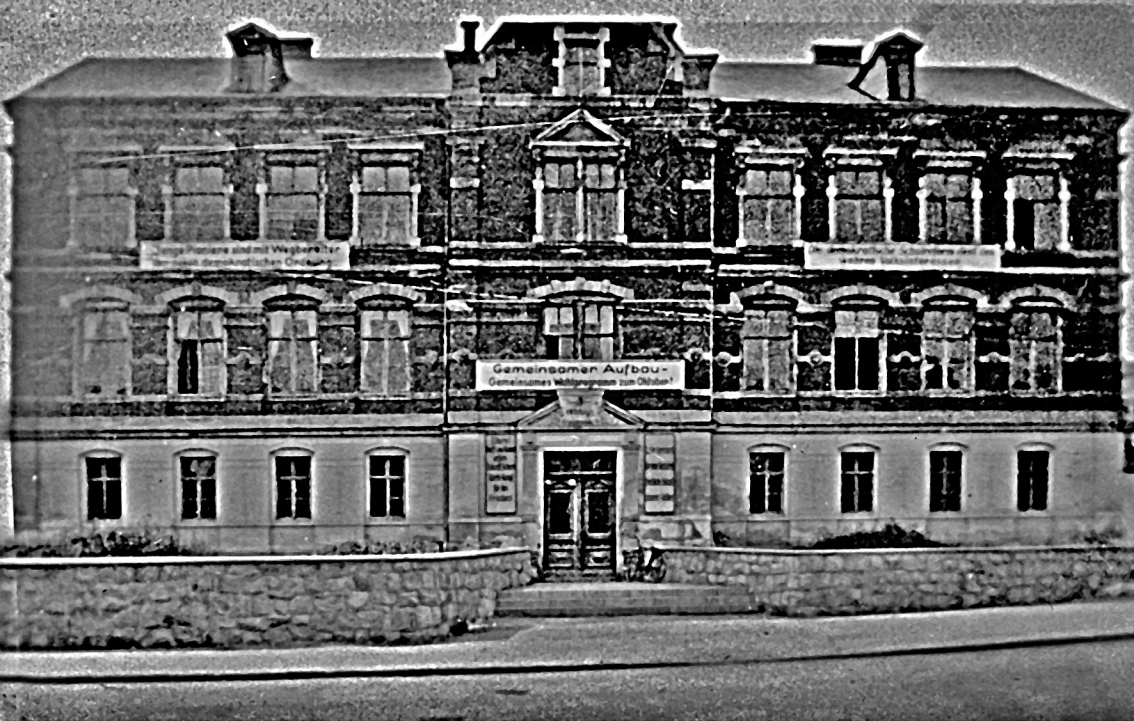
Die alte sozialistische Schule