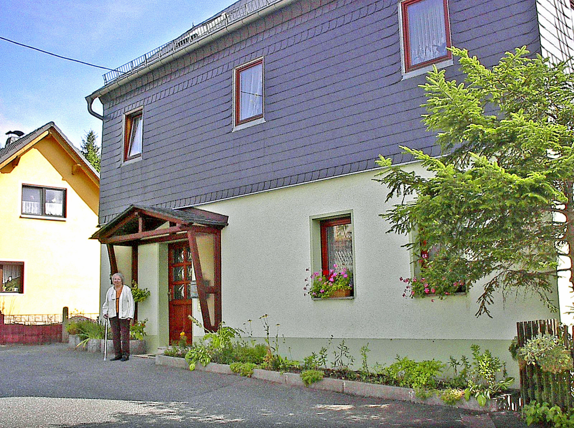
Burkhardtsgrün - die alte Schule mit der russisch Lehrerin