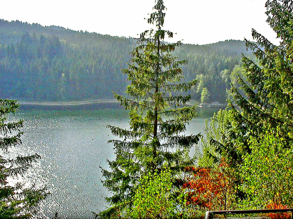
Sosa - Talsperre