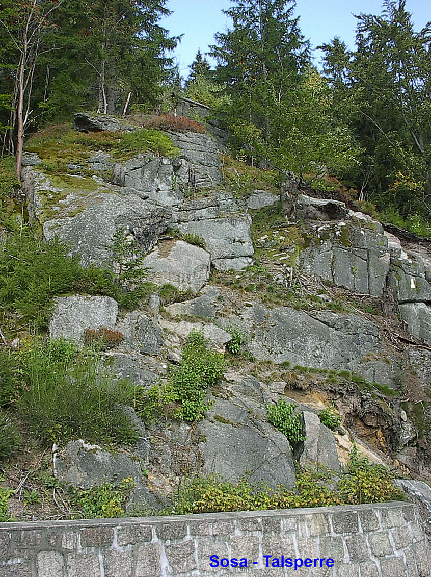
Sosa - Talsperre