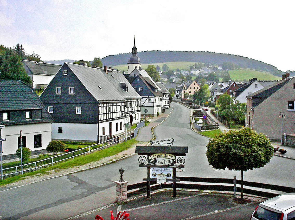
das idyllische Sosa