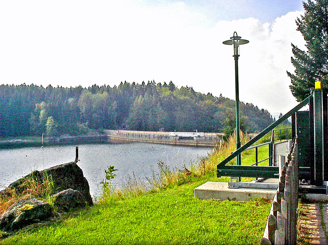
Sosa - Talsperre, Aussichtspunkt