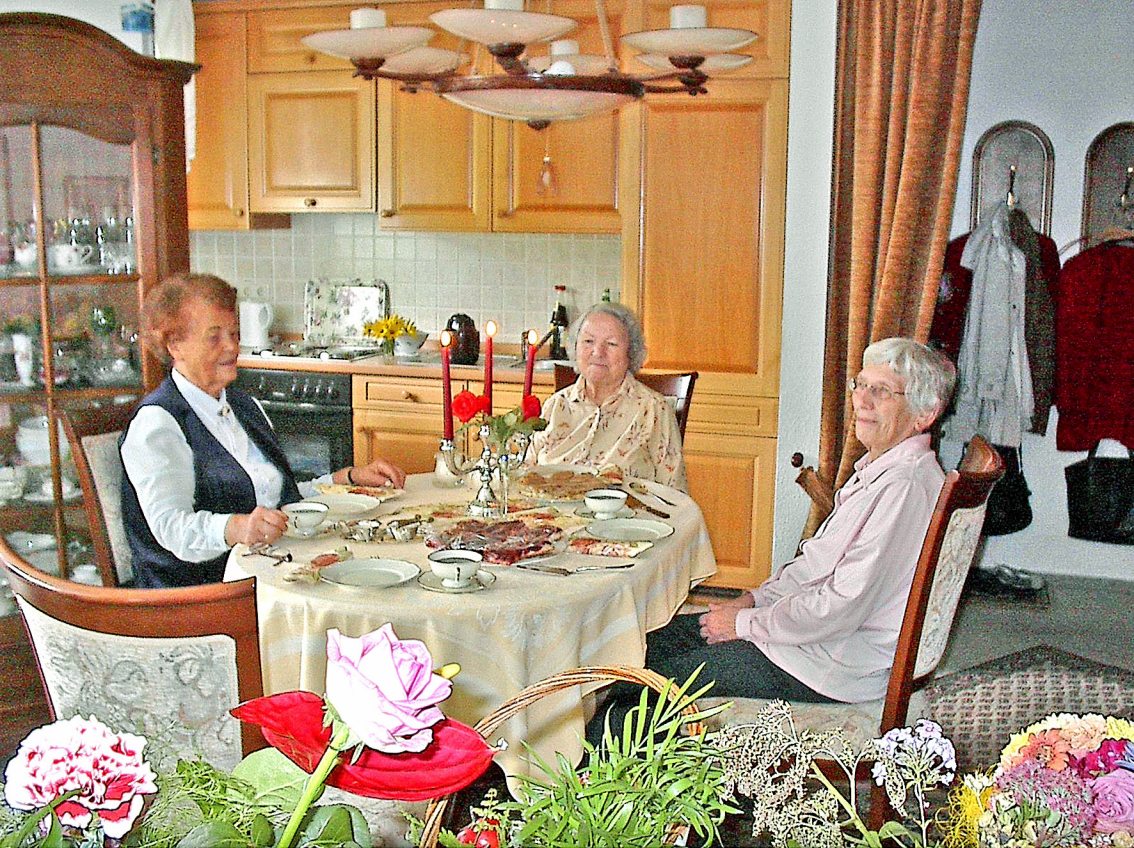
die Lehrerinnen und ihre Schulleiterin