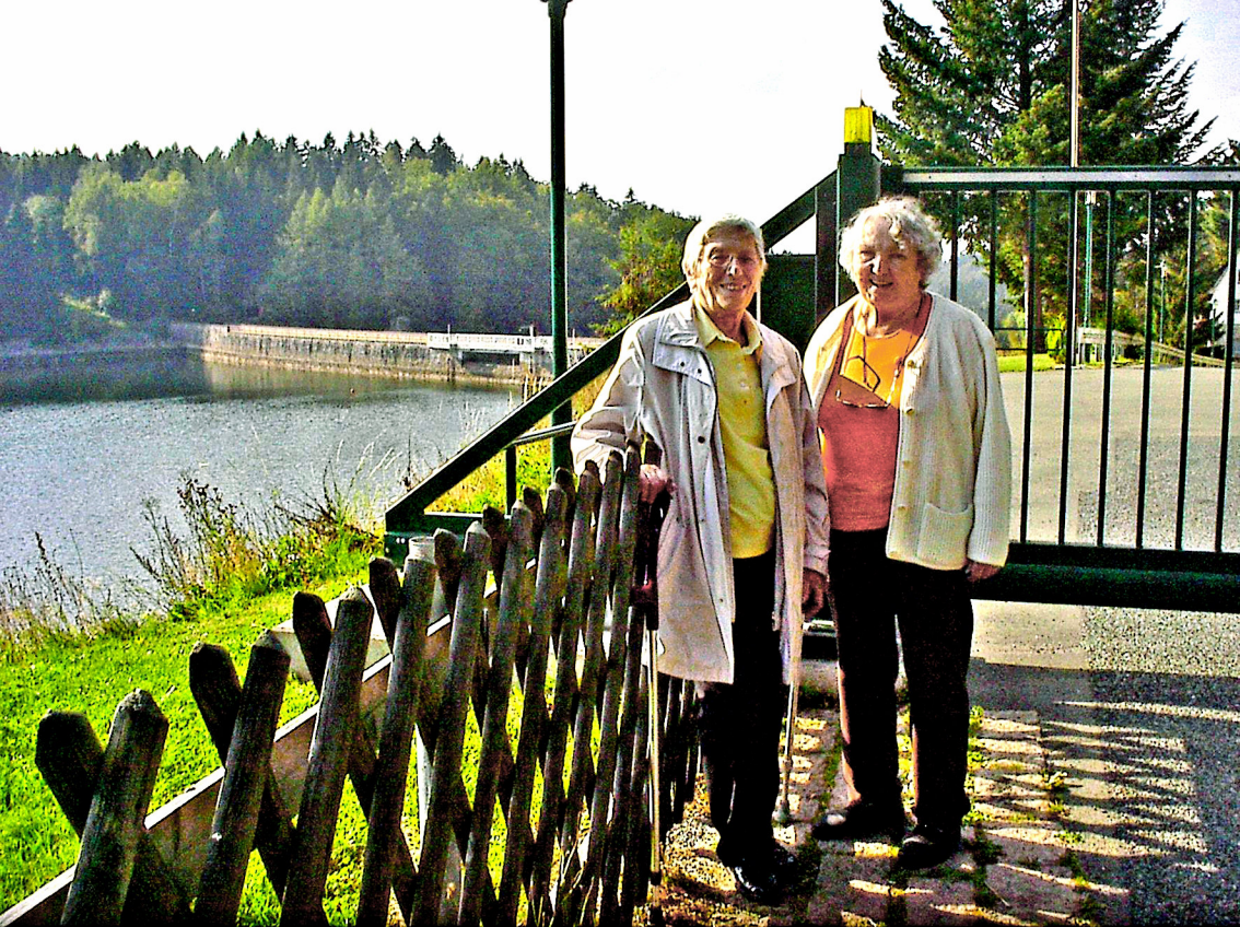
Sosa - Talsperre, Aussichtspunkt