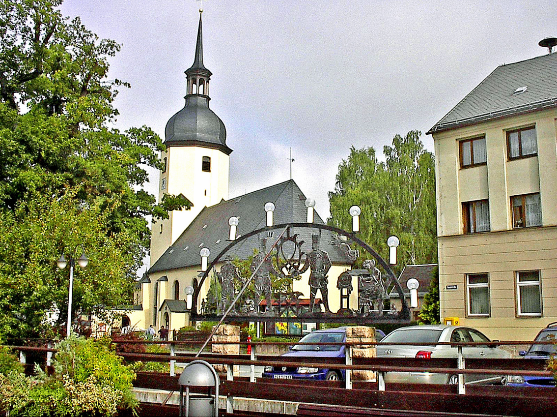
das idyllische Sosa