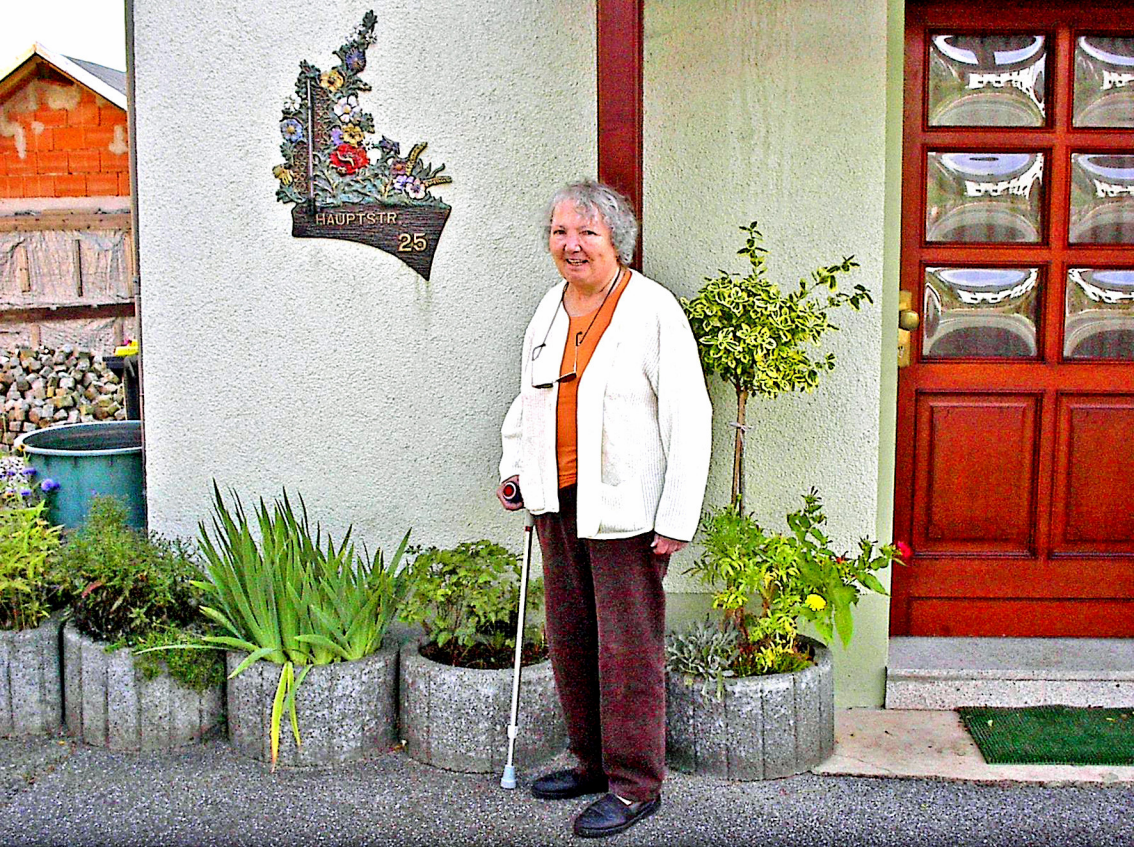
Die russisch Lehrerin vor ihrer ehemaligen Schule