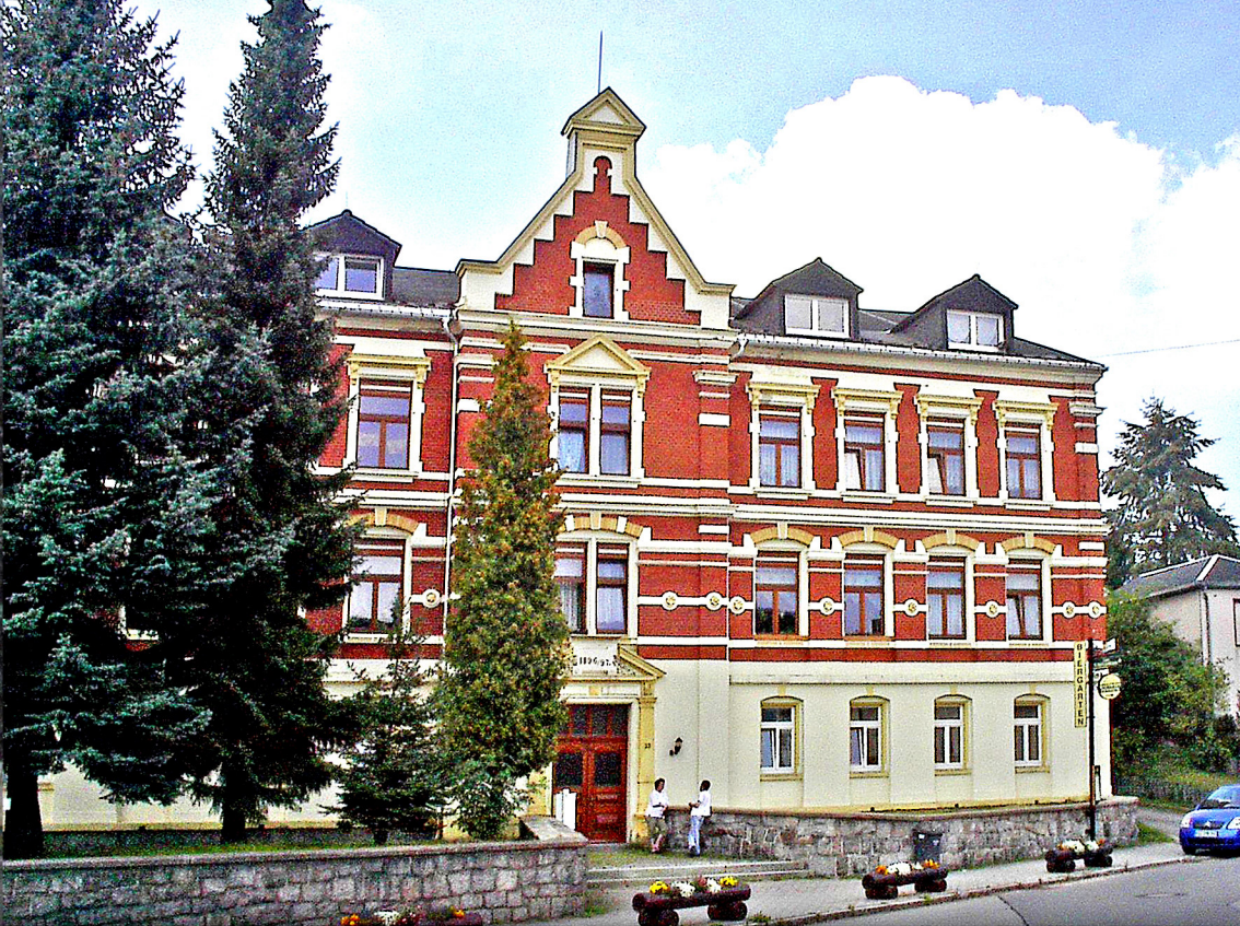
Sosa - die ehemalige Schule (jetzt Wohnhaus)