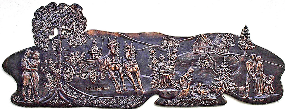
Die Jugendzeit Kunstschmiedearbeit an der Kirchenseite