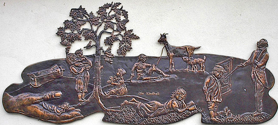
Die Kindheit Kunstschmiedearbeit an der Kirchenseite