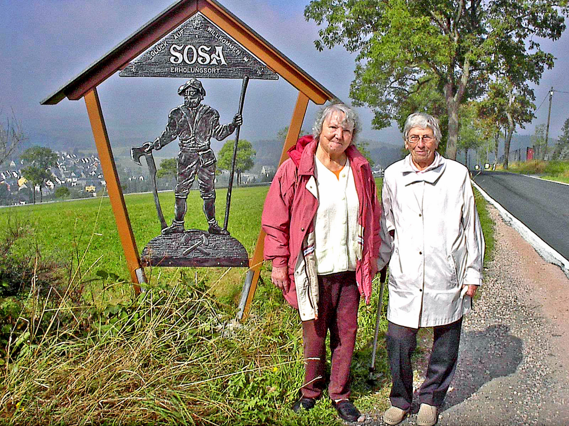
Sosa - Ortsschild