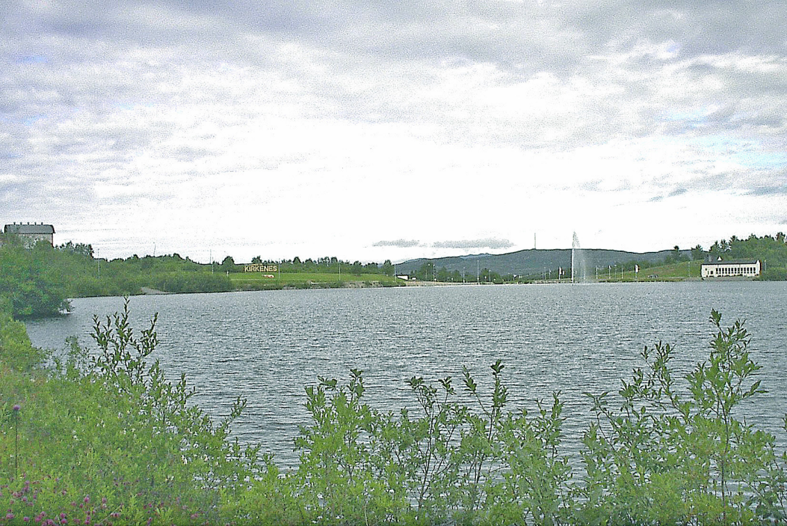
Stadtrand von Kirkenes