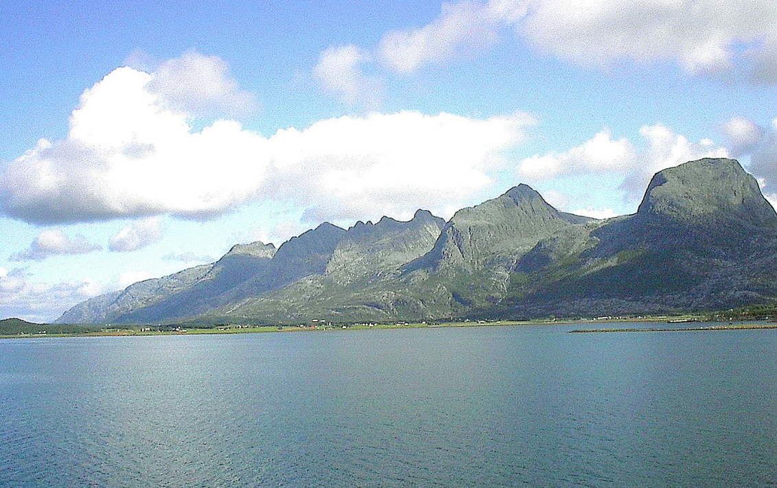
Die sieben versteinerten Schwestern