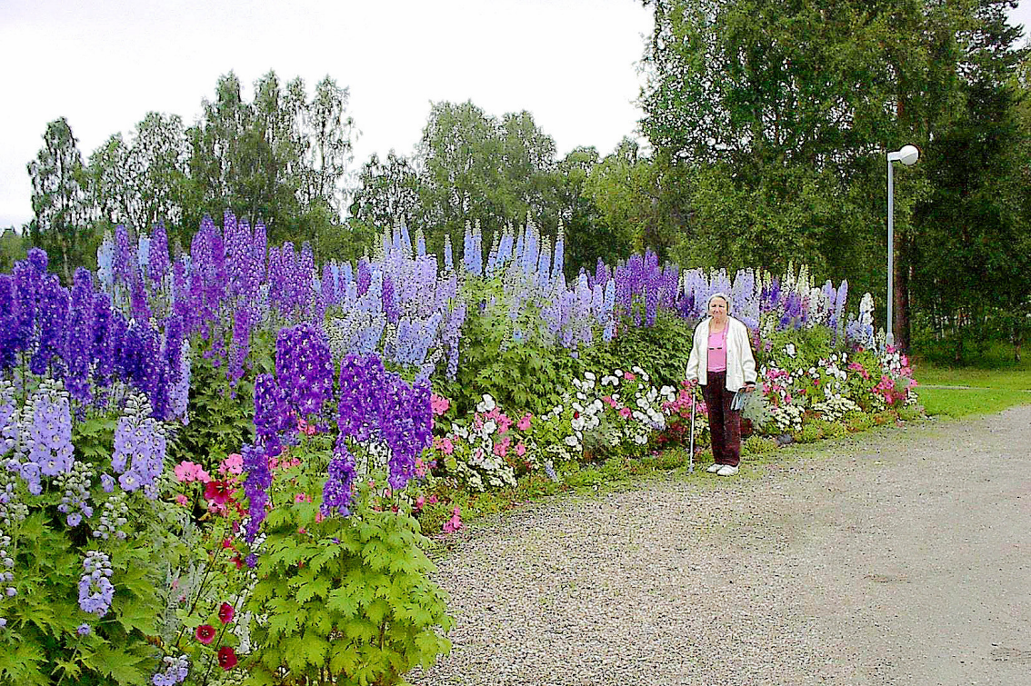
Pasvig Nationalpark Centre