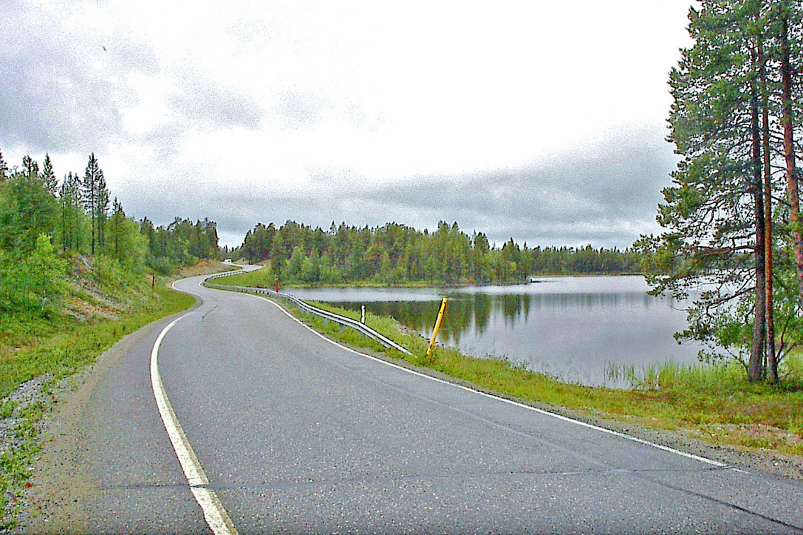
Straße nach Kirkenes, rechts der Inari-See