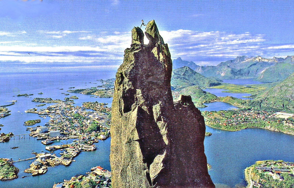
Svulvaersgeita, eine Stelle für eine Mutprobe