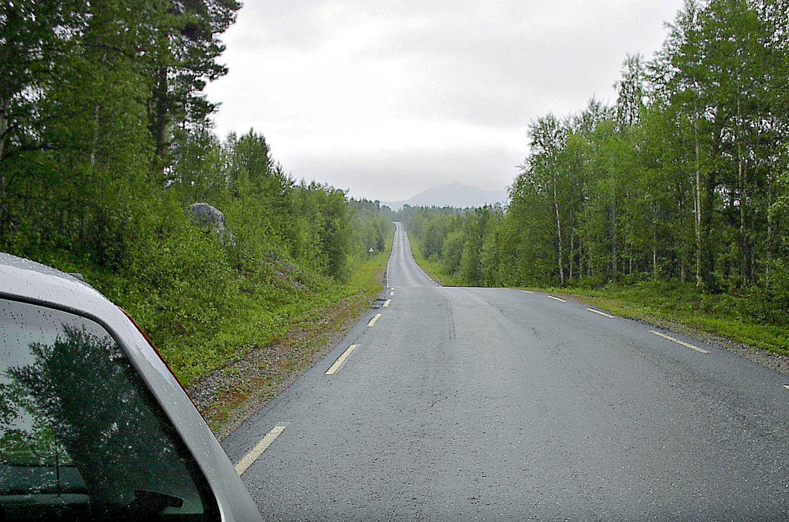
Straße 885 zwischen Vaggatam und Svanvig