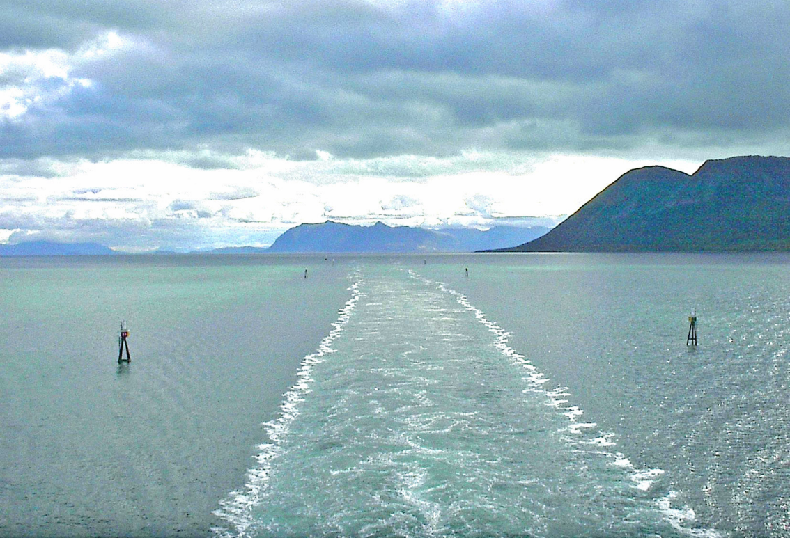
Die Rinne, die engste Stelle der Hurtig-Route