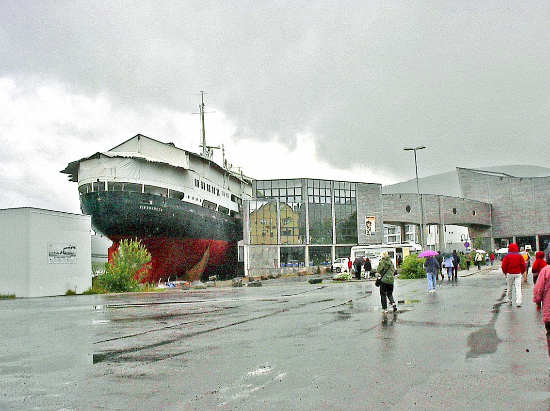
Stockmarknes - die alte Finnmarken