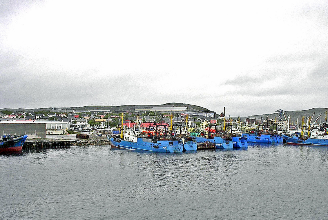
Kirkenes - Hafen, blaue Schiffe voll mit Blumen