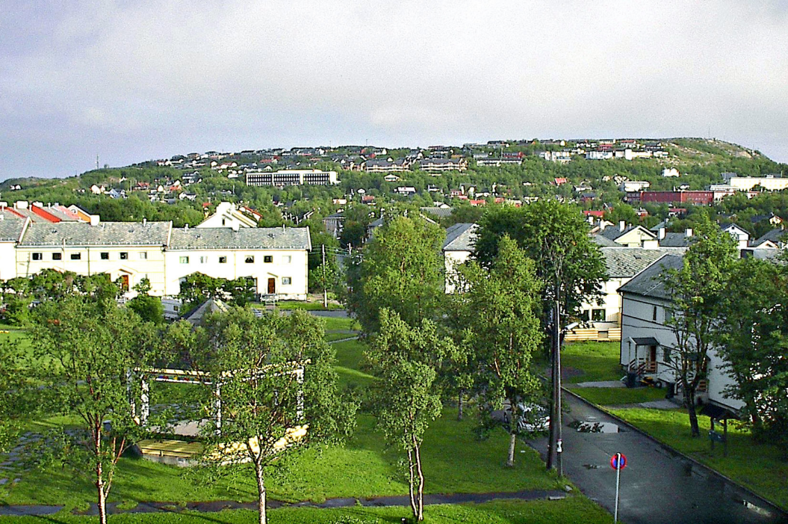
Kirkenes - der nordöstliche Teil