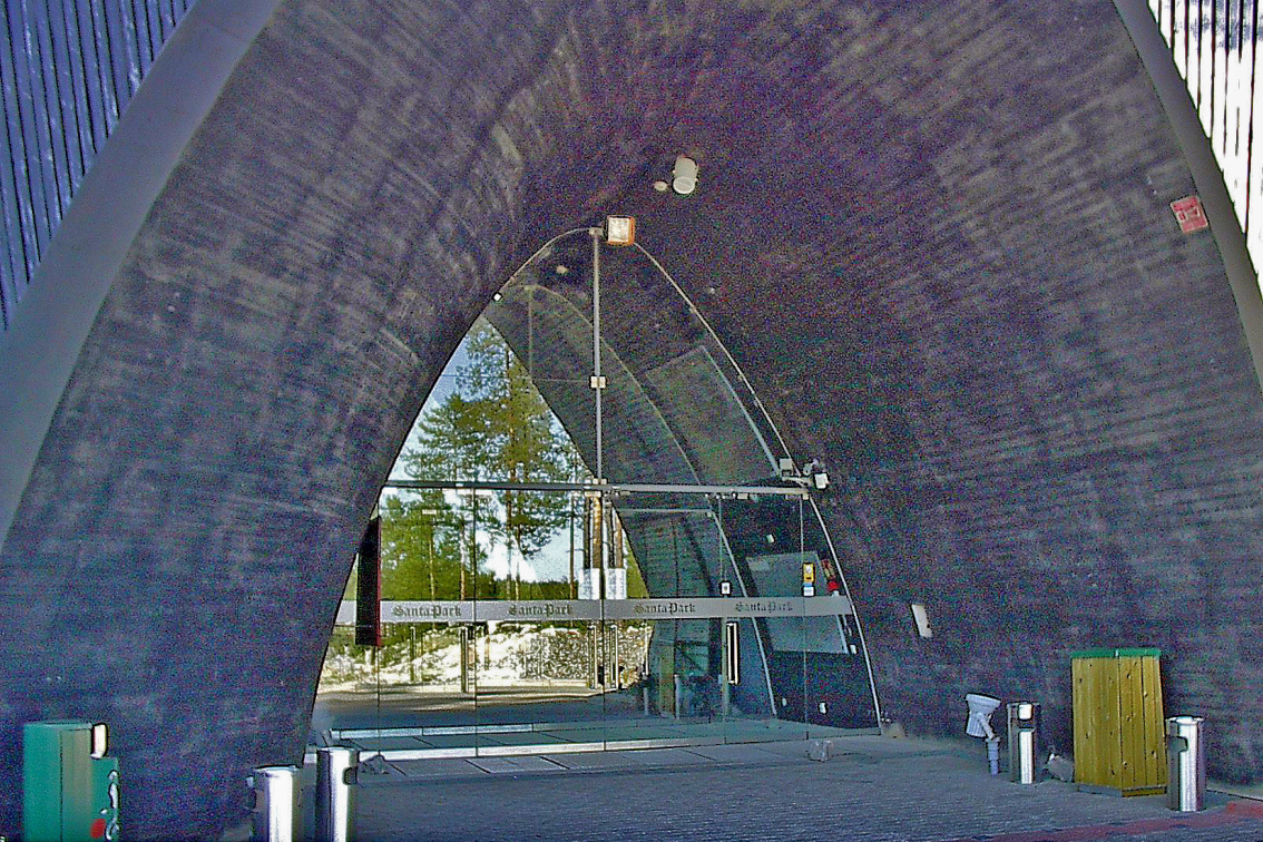
Eingang zum Santa Park