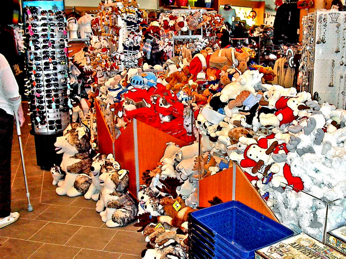
Artic-Circle-Center - Lager vom Weihnachtsmann