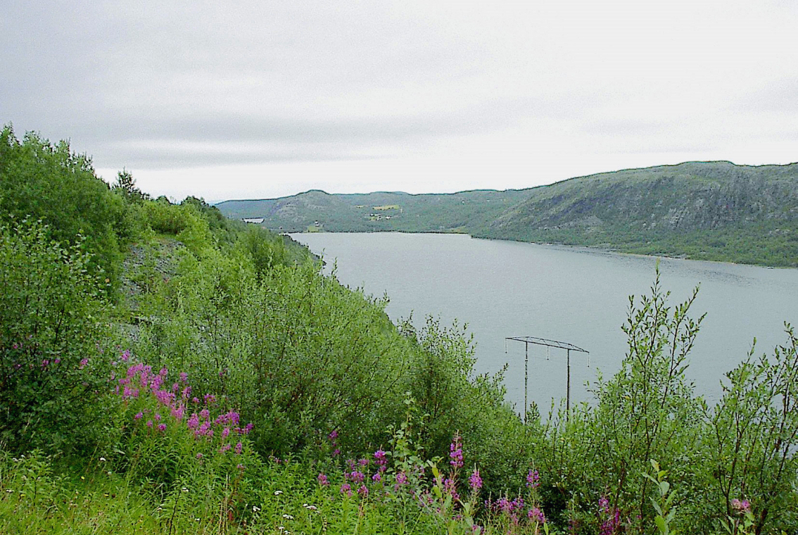
Pasvig - Grenzfluss zwischen Norwegen und Russland