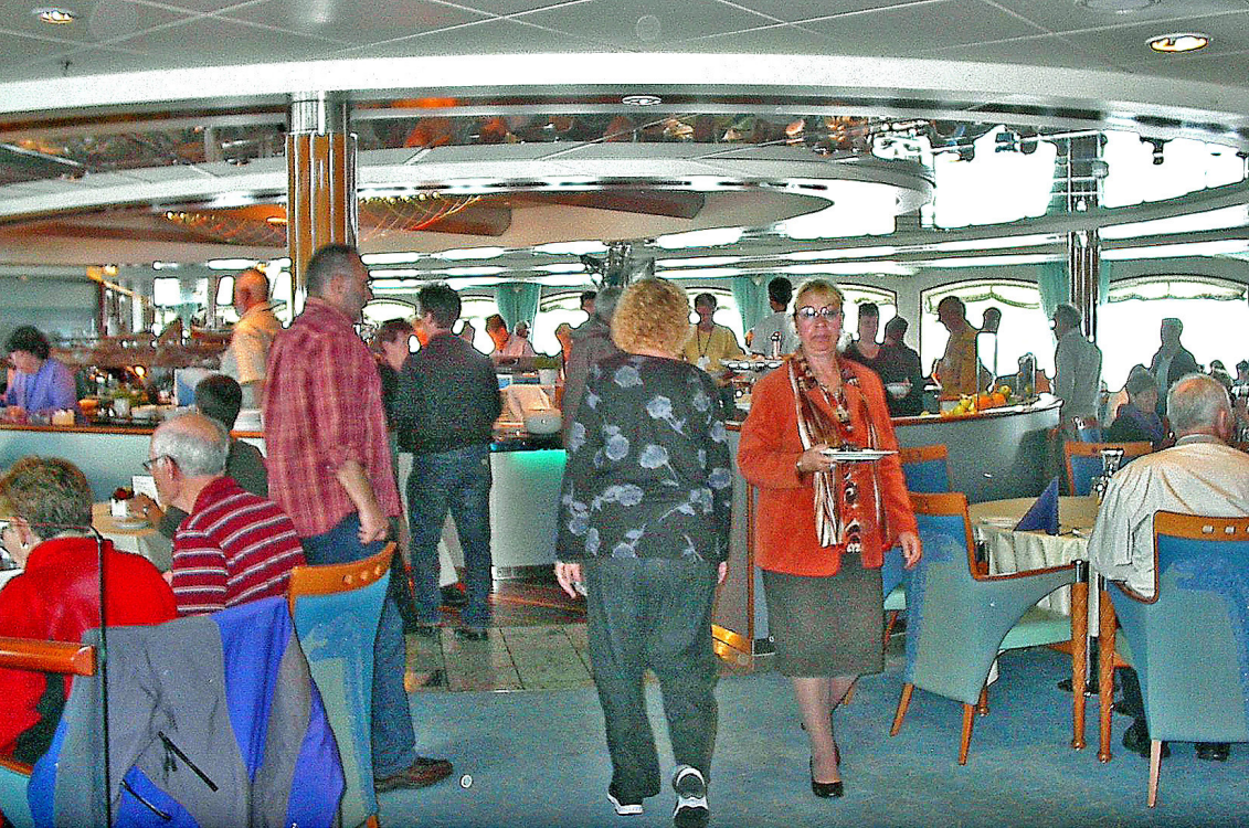
Mittagessen auf der Finnmarken