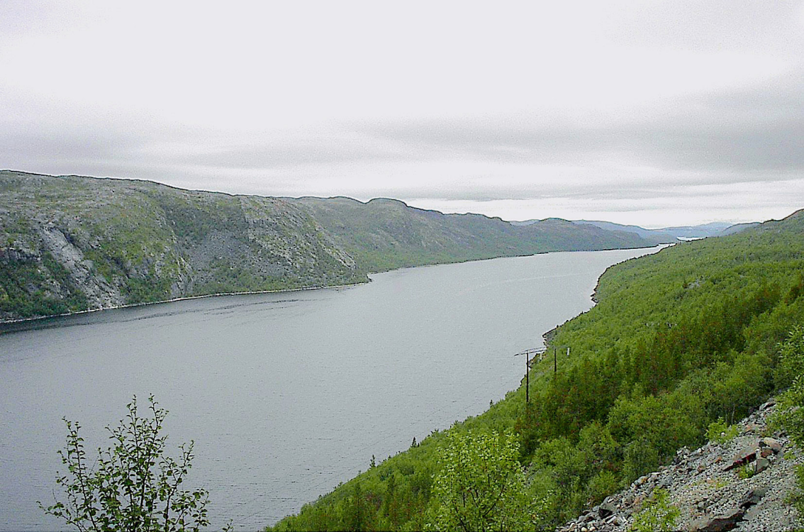
Pasvig - Grenzfluss zwischen Norwegen und Russland