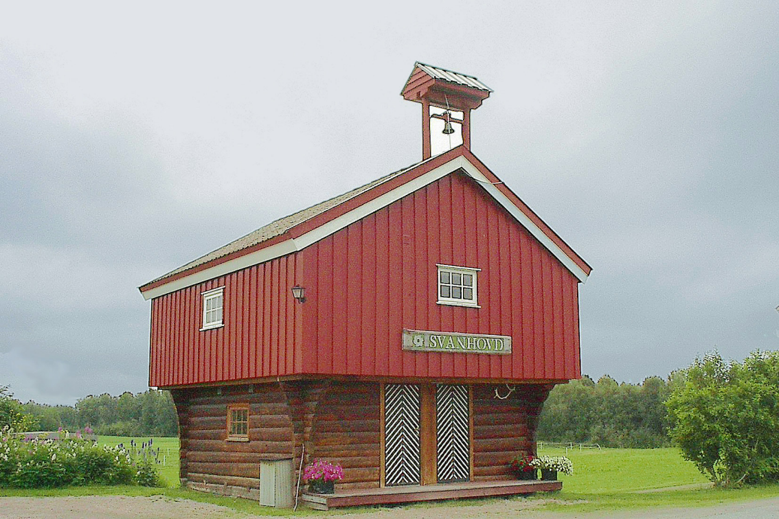
Pasvig Nationalpark Centre