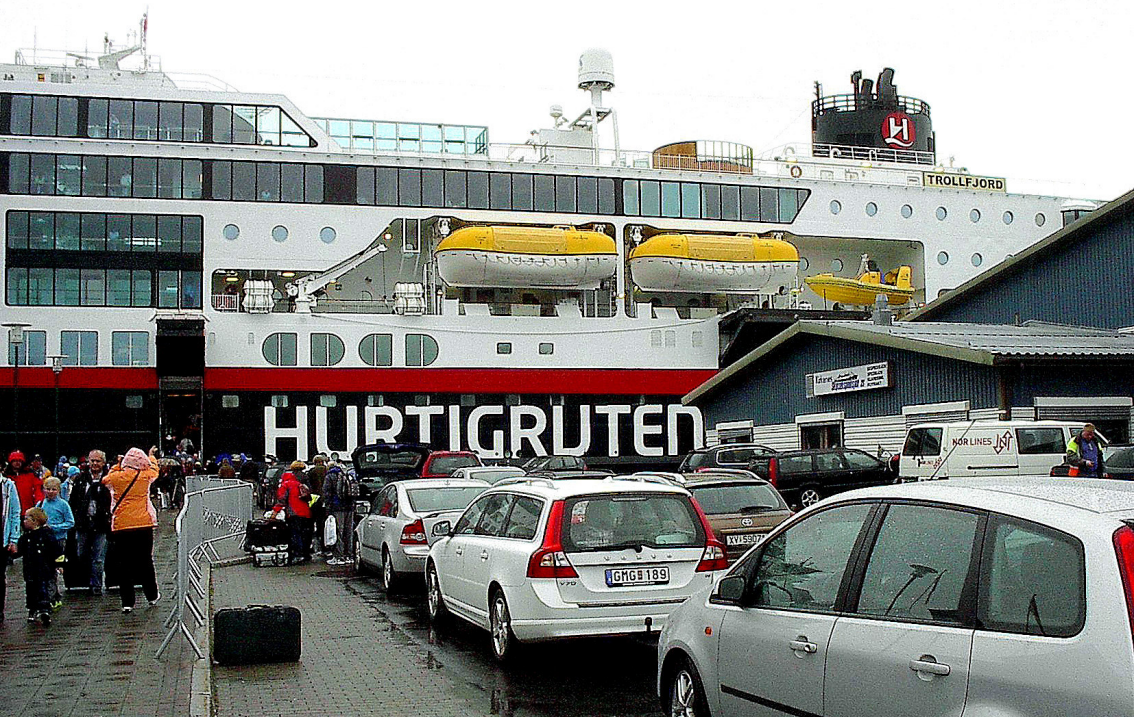
Kirkenes - vor dem Verladen