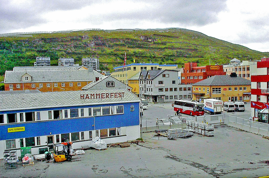
Hammerfest - Hafen