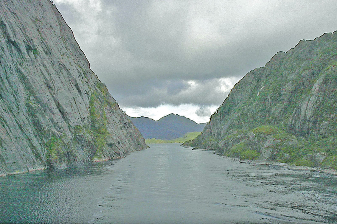
Einfahrt in den Trollfjord