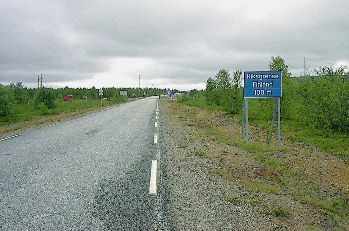
Straße nach Kirkenes