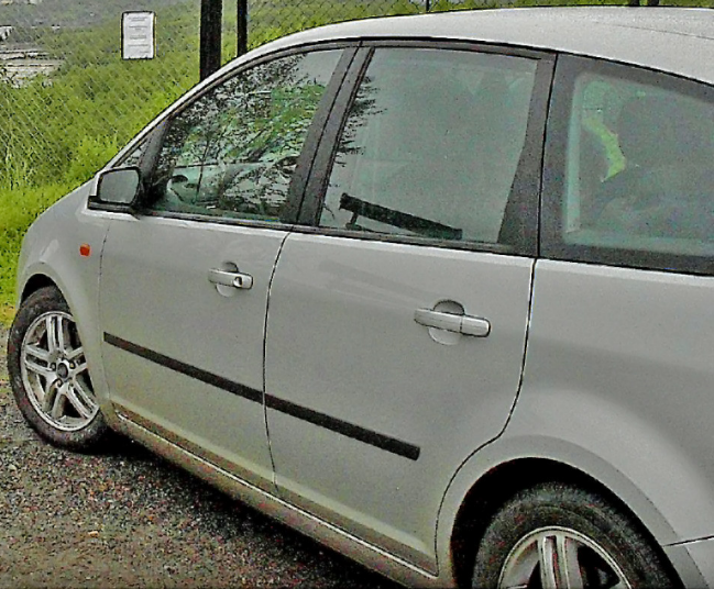
am Grenzzaun zu Russland

DIT ER FORBUDT Å KRYSSEREN OYDRETTIGLE KAN MEDSØRE EIRUTLANDIA. Næringsmiddel og personlig eiendom kan bli kontrollert. All informasjon om innreise, utreise eller reiserutegenerasjon IT IS FORBIDDEN TO CROSS THE NATIONAL BORDER. HOW COMPLIANCE CAN LEAD TO PROSECUTION. For further information concerning animals in the border area, and general border control or the border control office. ES IST VERBOTEN DIE STAATSGRENZE ZU ÜBERTRETEN. DIE ÜBERTRETUNG KANN VERURTEILT VERURTEILT WERDEN. Um weitere Informationen zum Grenzschutz und anderen die Polizei oder die Grenzschutzbehörde kontaktieren. Denne informasjonen er tilgjengelig på russisk, ukrainsk, polsk og litauisk. For mer informasjon se www.grens.no