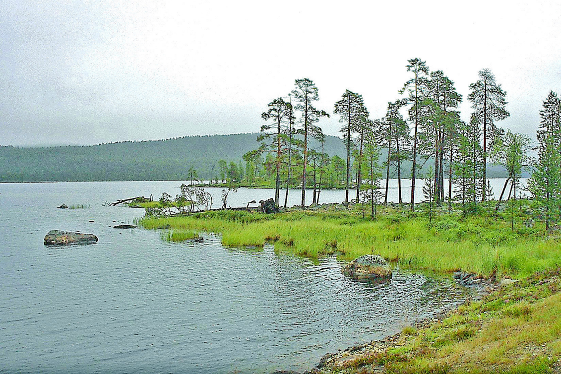
Inari-See (diesmal ohne Nebel)