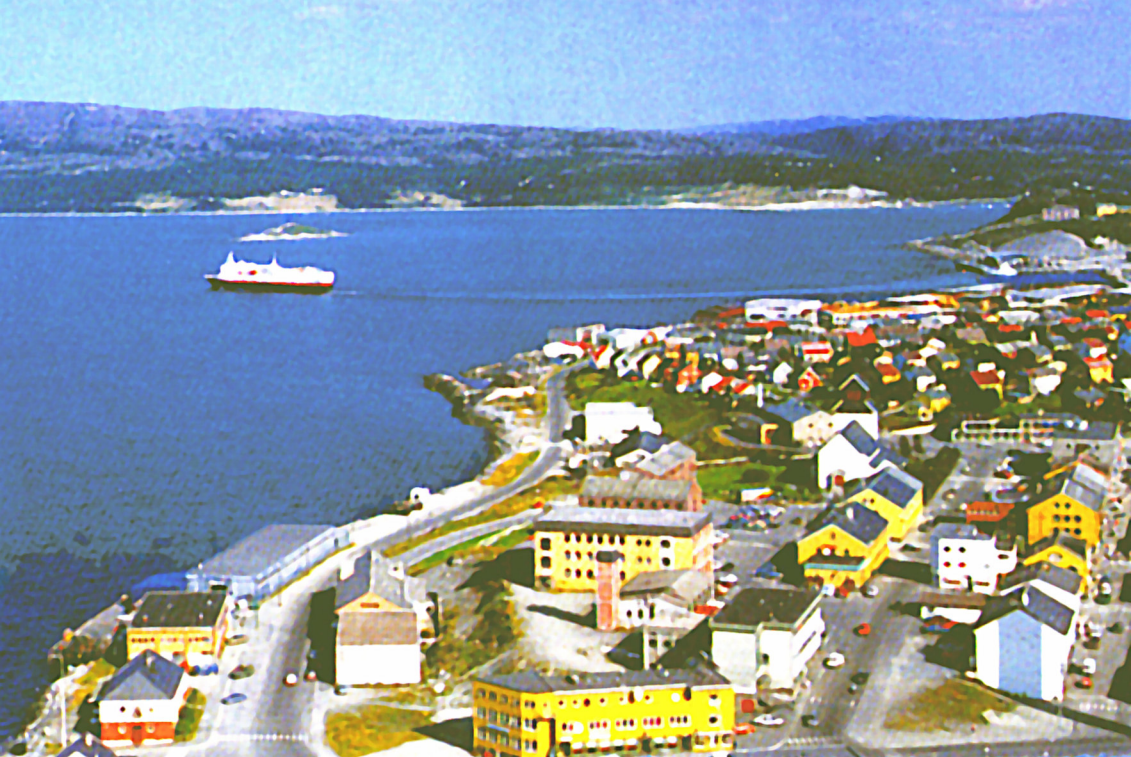
Kirkenes - Hafenstraße