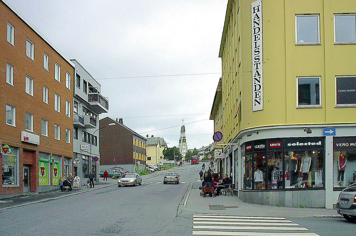
Hammerfest - Blick auf die Kirche