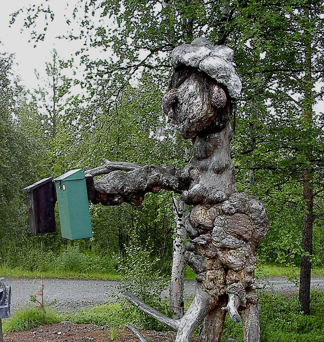
ein schöner Briefkasten-Halter an der 885 im Pasvig-Land