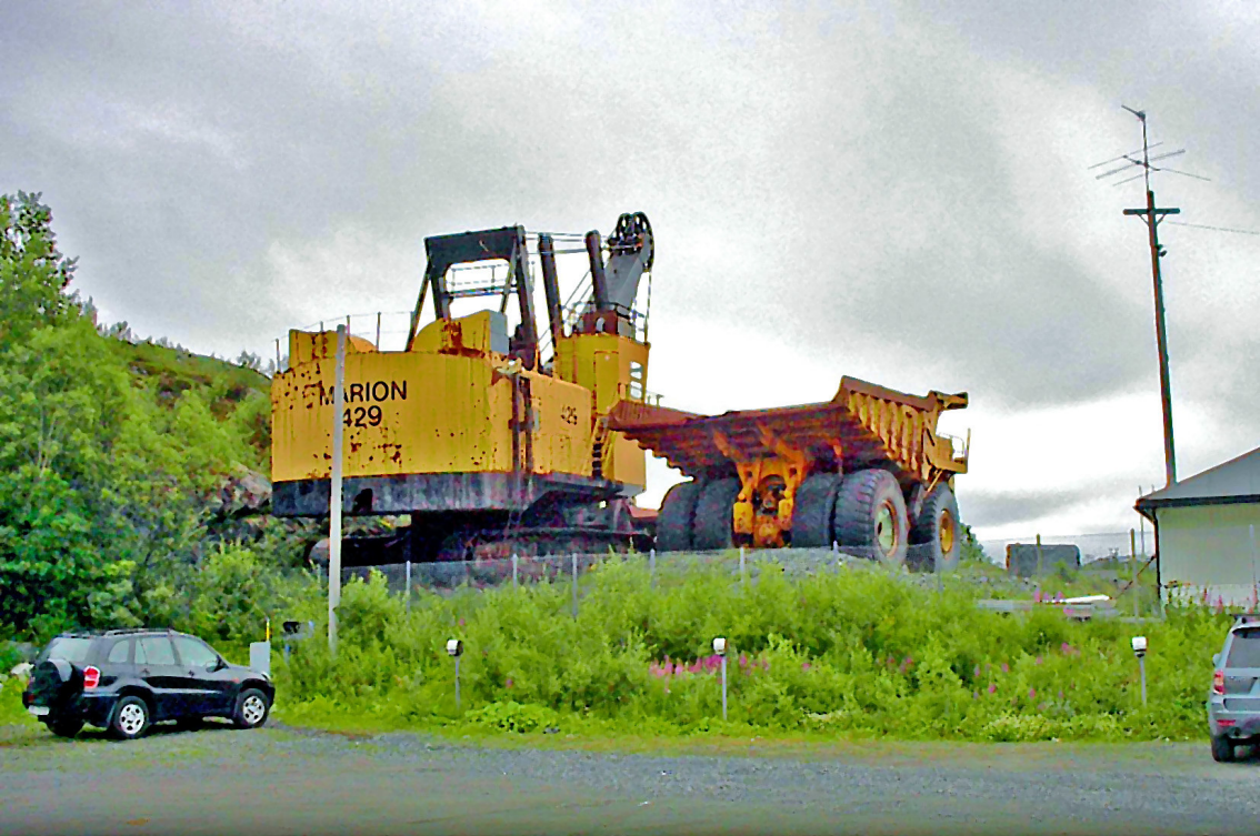
Eisenerz-Tagebau bei Kirkenes (nun australisch und nicht mehr zu besichtigen)