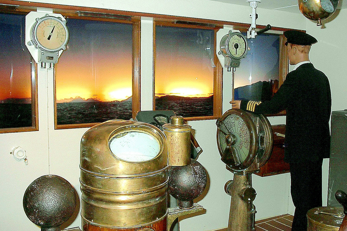
in der alten Finnmarken in Stockmarknes