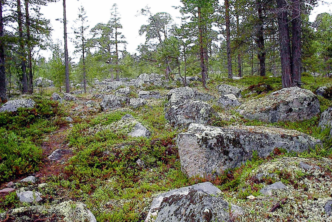
an der Straße nach Kirkenes, Reste der Eiszeit