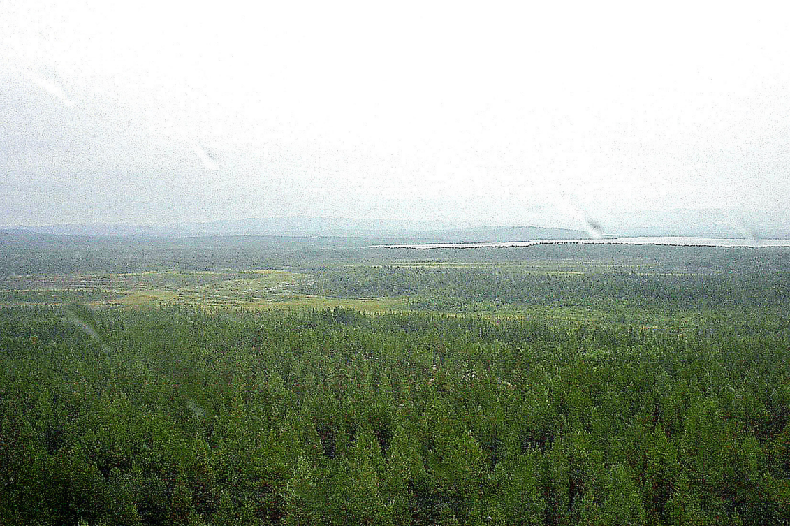
Pasvig Nationalpark - Höhe 96, am anderen Pasvig-Ufer liegt Nickel im Nebel