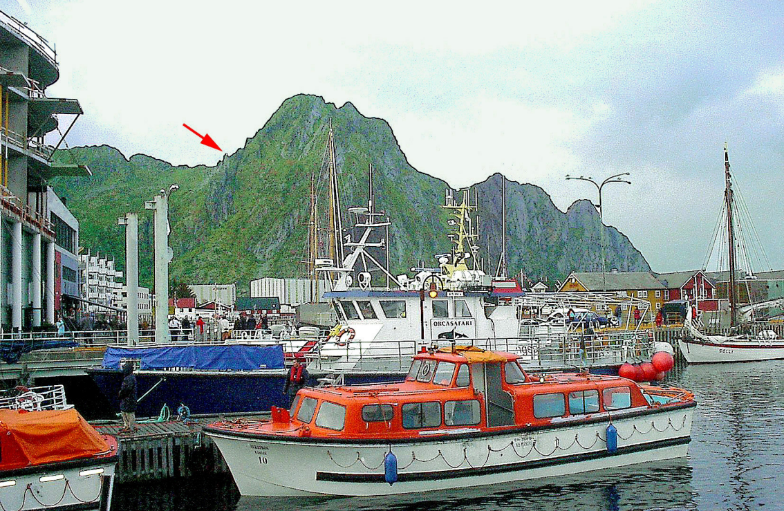
Svolveer - der Pfeil zeigt auf Svolveersgeita