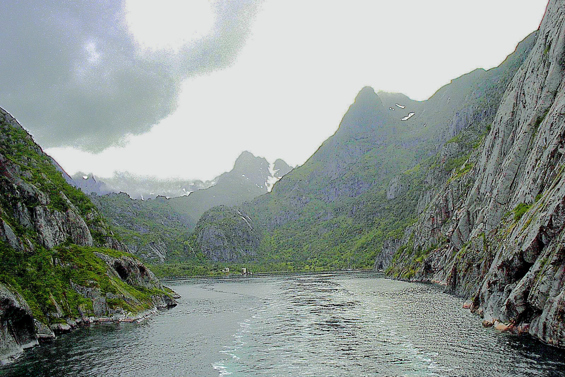
Ausfahrt aus dem Trollfjord