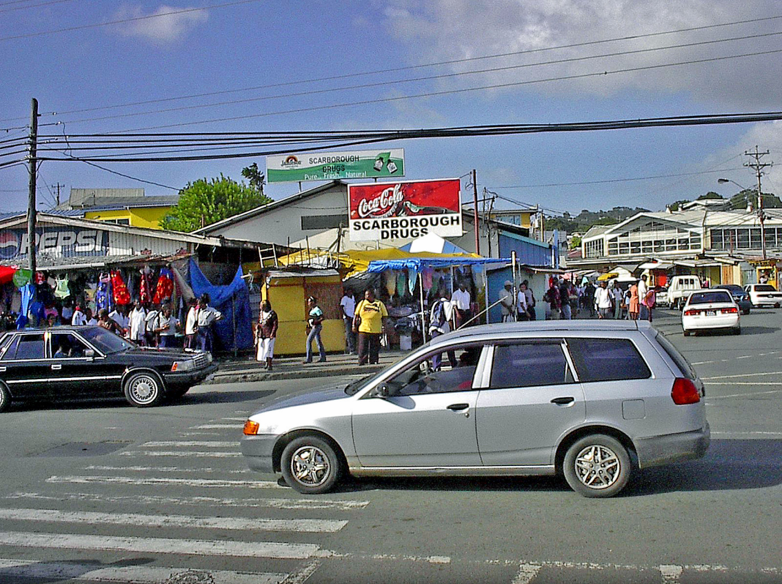
Tobago - Scarborough