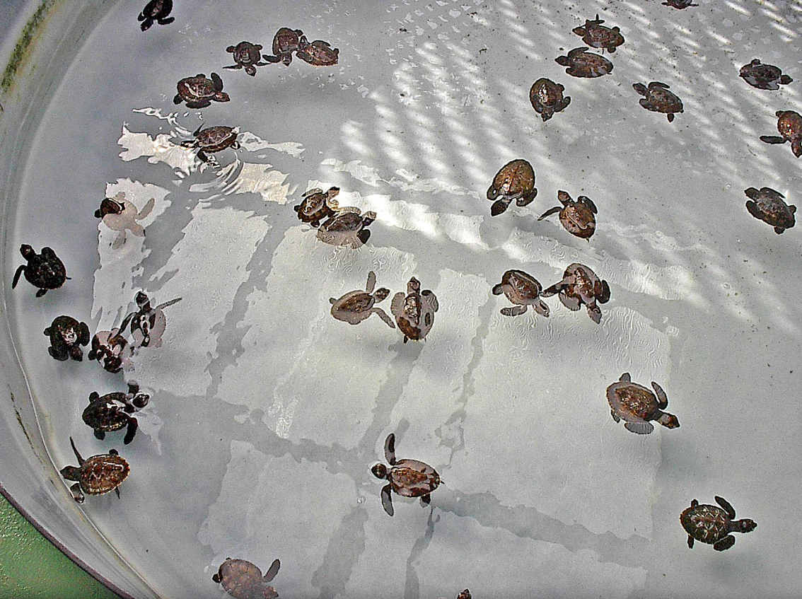
Bequia - Schildkröten-Aufzuchtstation