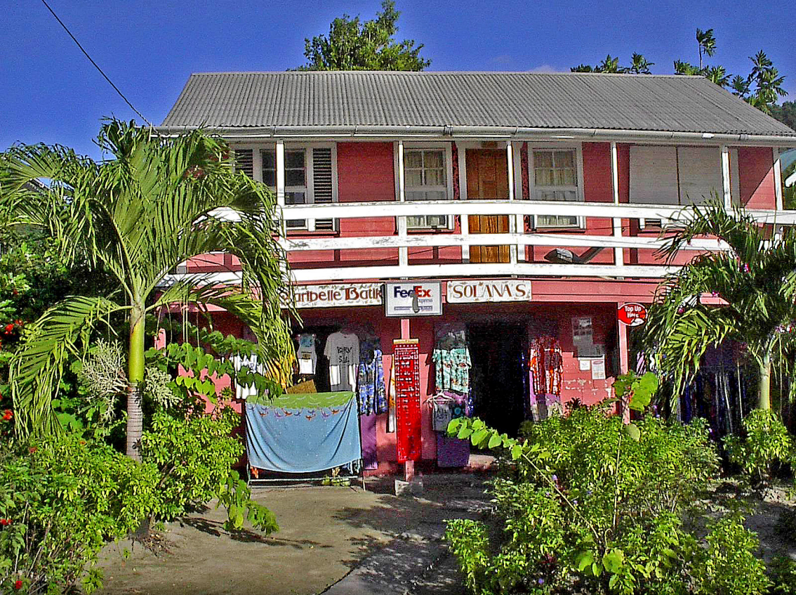
Bequia - Port Elizabeth, Laden am Hafen