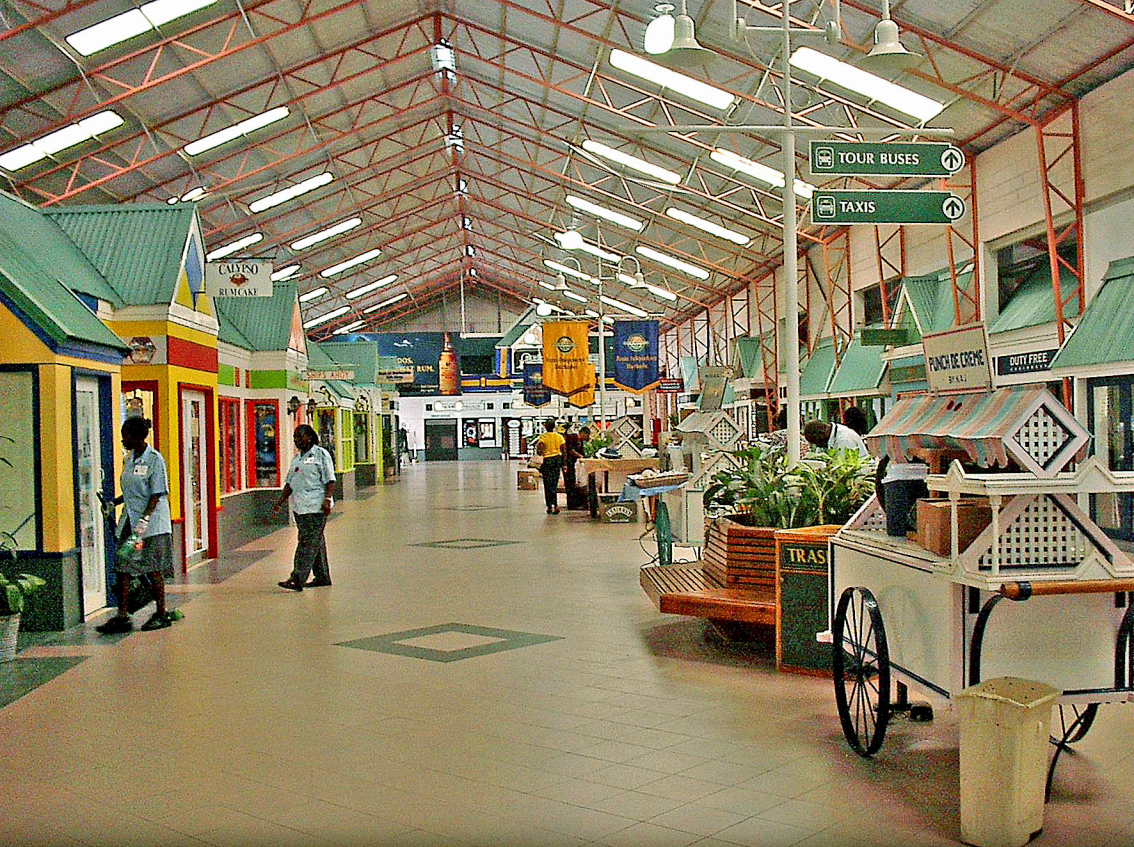
Barbados - Hafengebäude