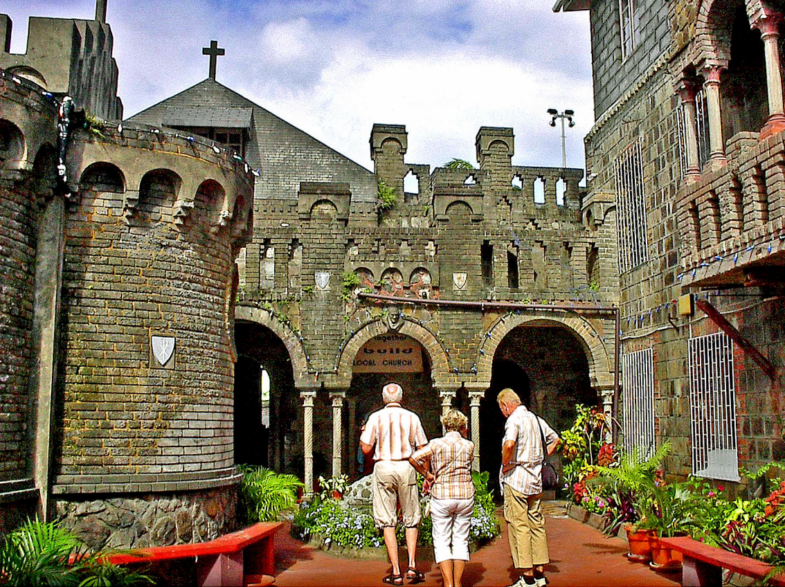
St. Vincent - Kingstown, Kloster