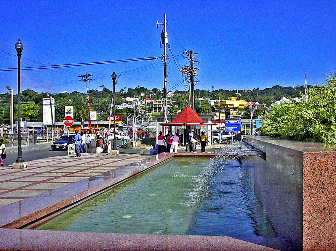
Tobago - Scarborough