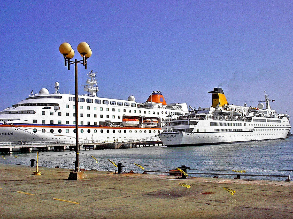
Tobago - links die MS-Columbus rechts die Fähre nach Trinidad