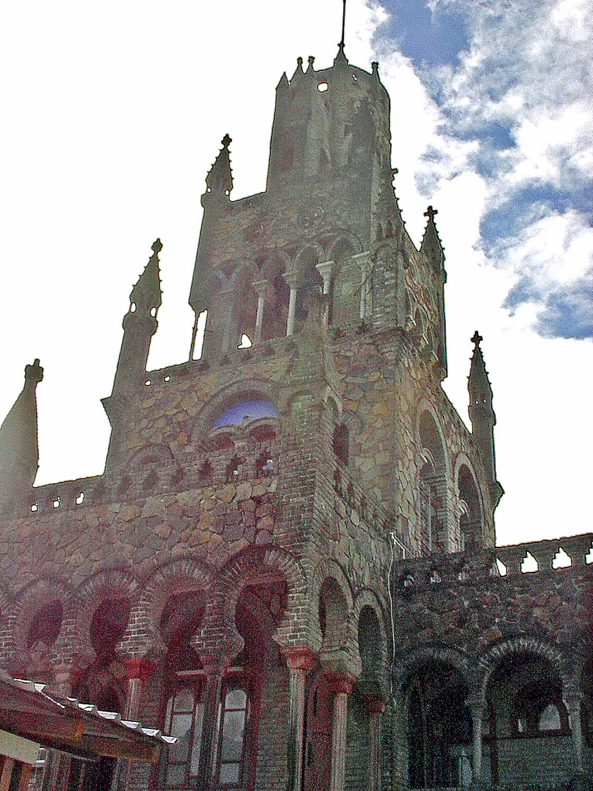
St. Vincent - Kingstown, Kloster