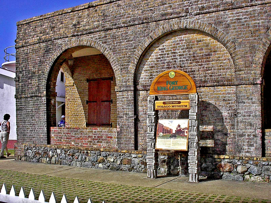
Tobago - Fort King