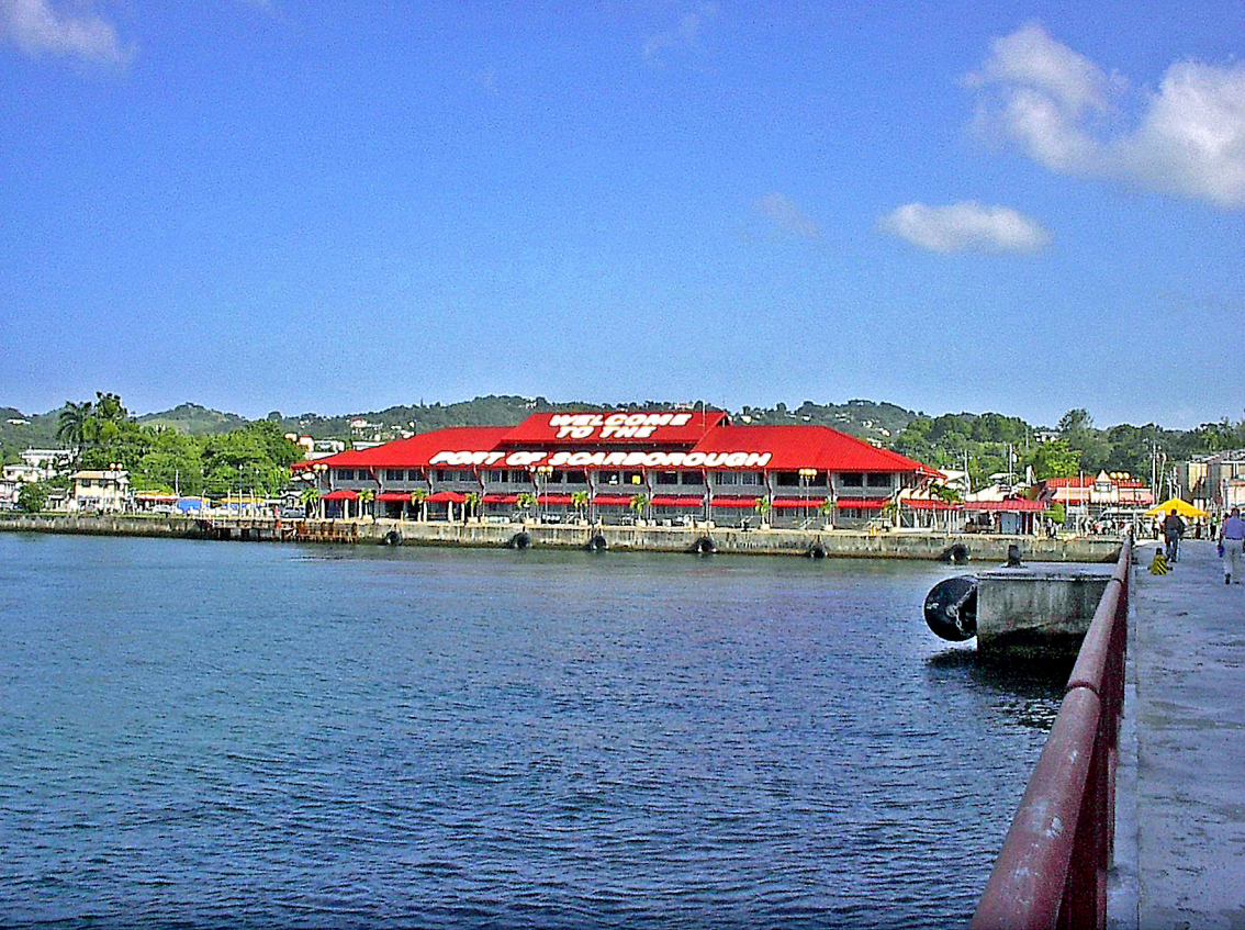
Tobago - Hafen von Scarborough