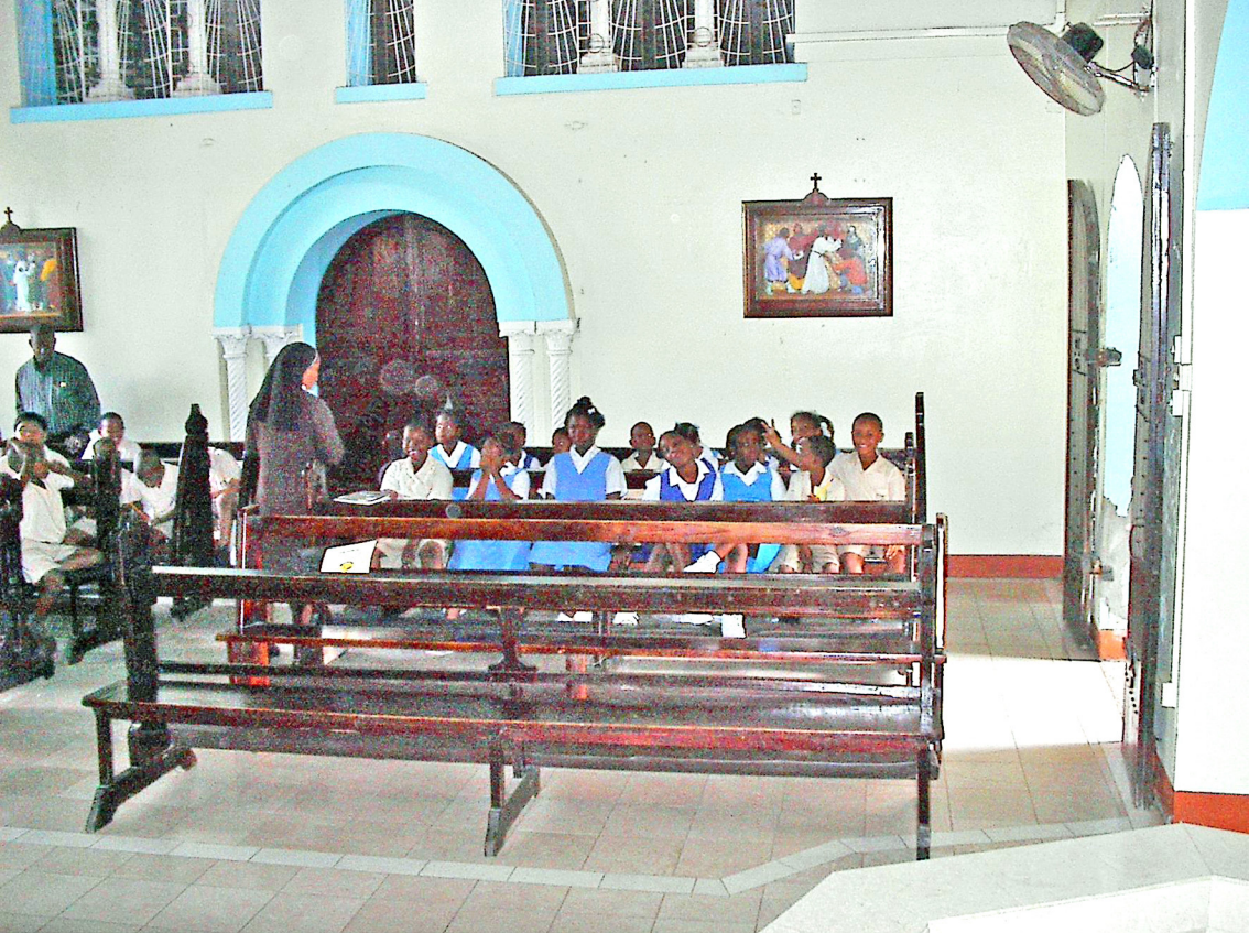
St. Vincent - Kingstown, Klosterschule