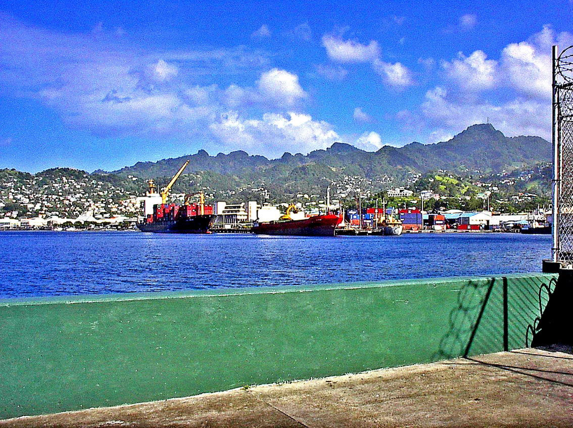
St. Vincent - Hafen von Kingstown