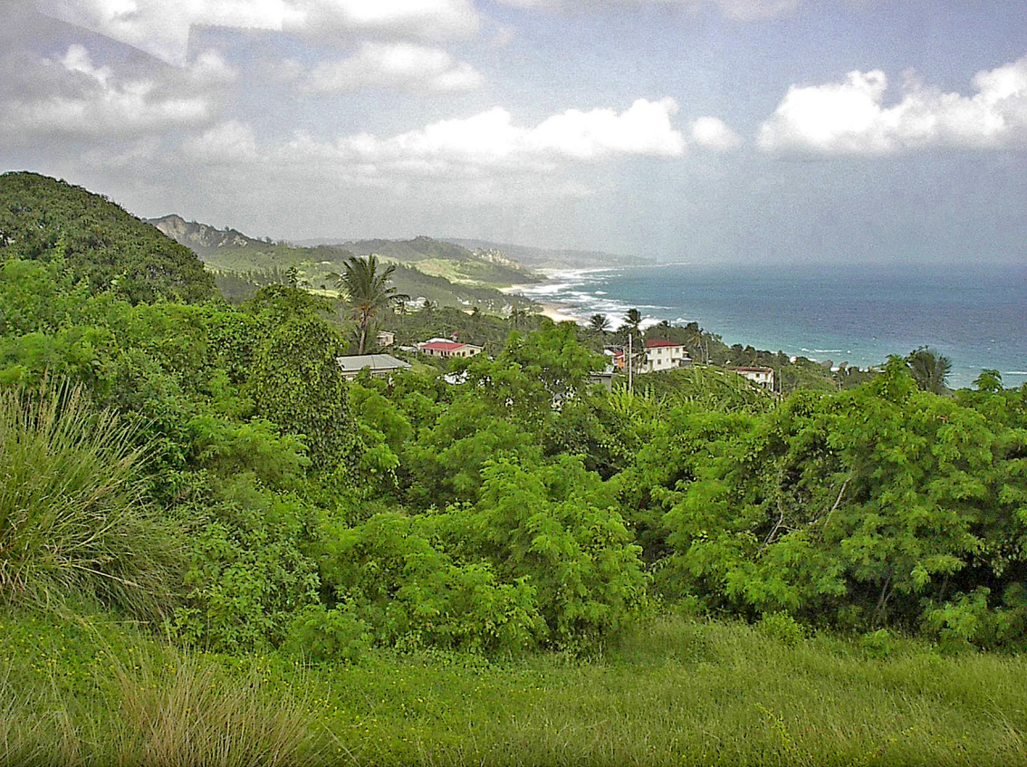
Barbados - Atlantikküste bei Bathsheba