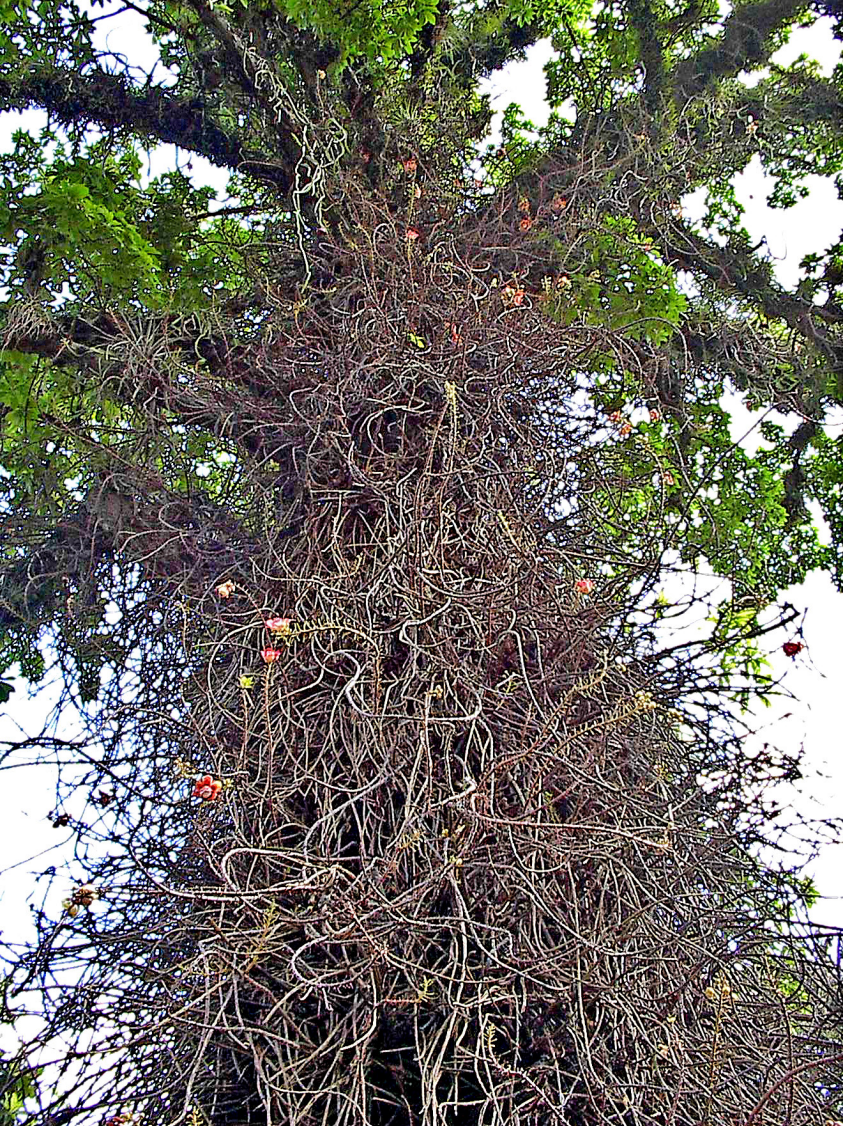
St. Vincent - Bot. Garten, Kanonenkugelbaum