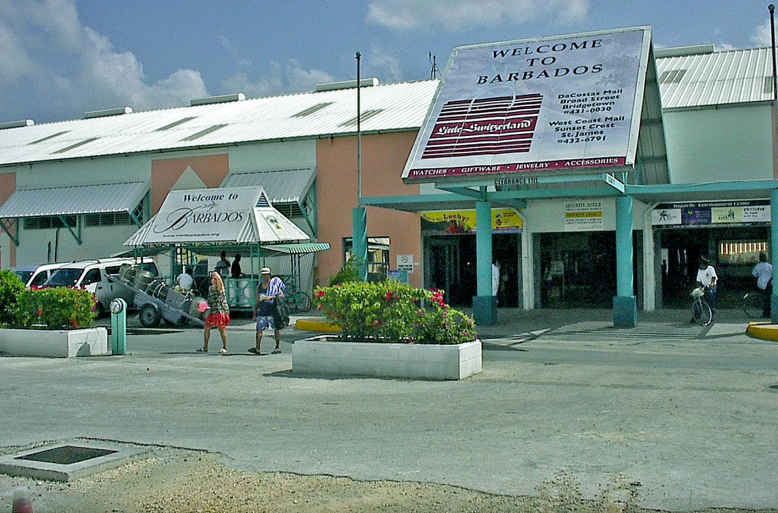
Barbados - Hafen