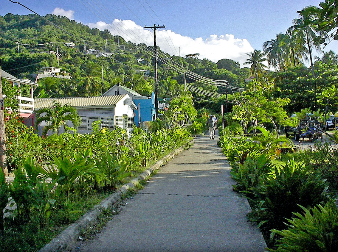
Bequia - Port Elizabeth, Park am Hafen