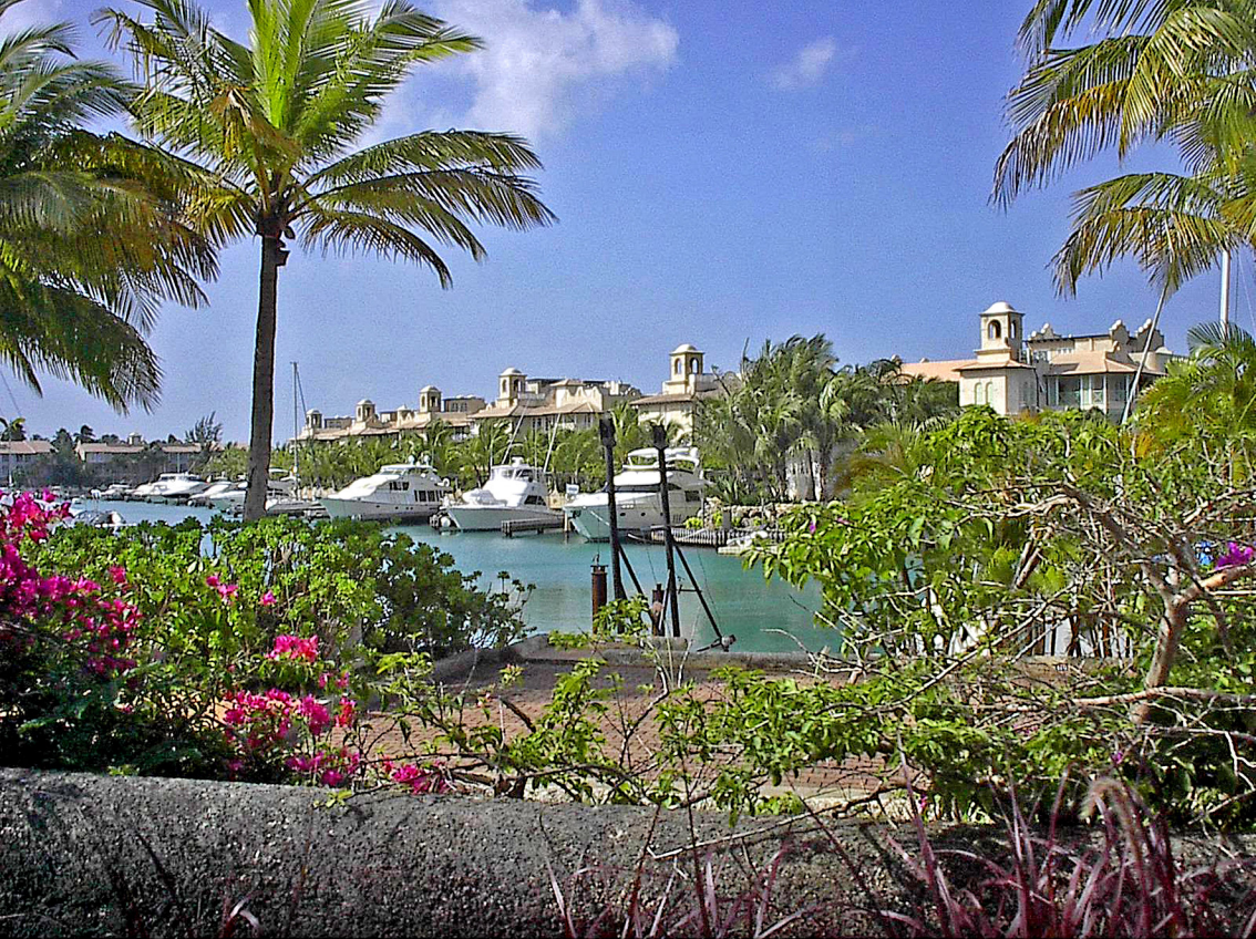
Barbados - Jachthafen