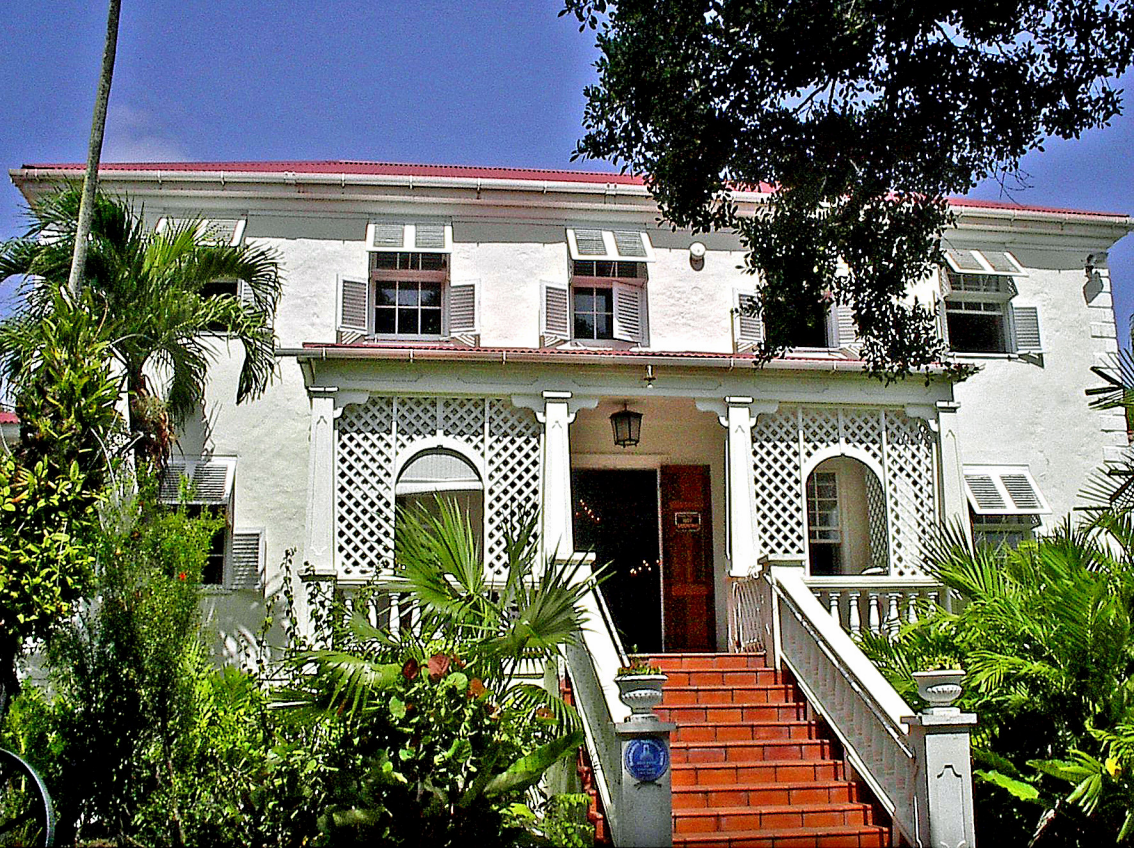
Barbados - Sunbury Plantation House