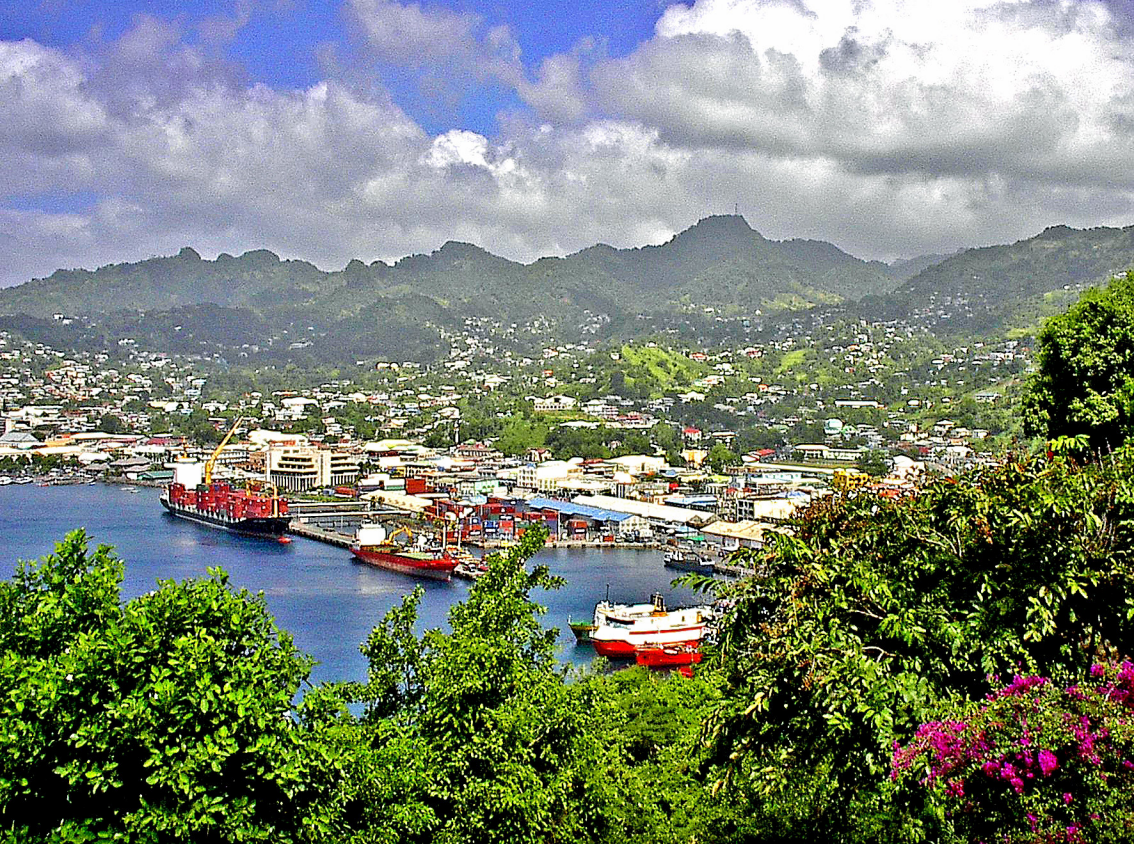
St. Vincent - Blick von Fort Charlotte auf Kingstown