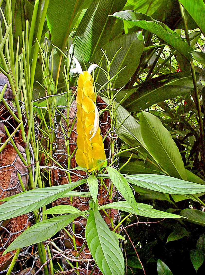
Barbados - Andromeda Botanic Garden