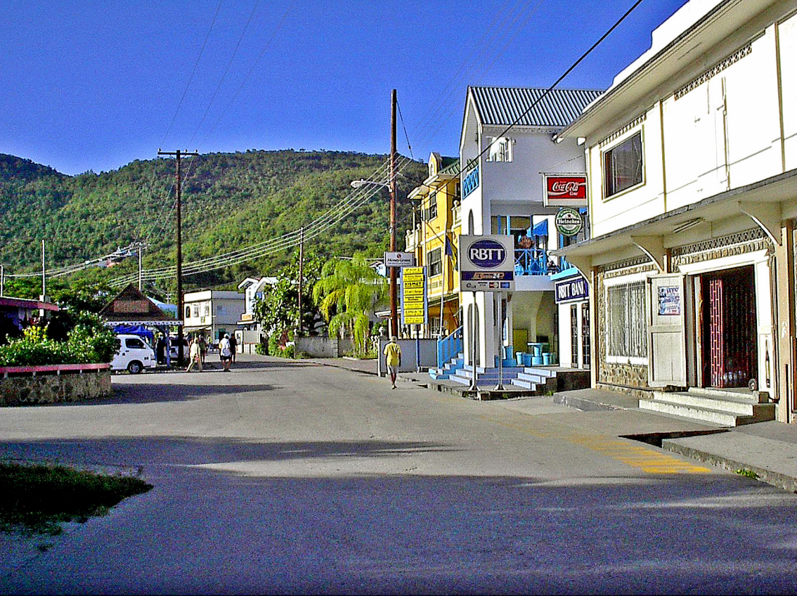
Bequia - Port Elizabeth, Hauptstraße