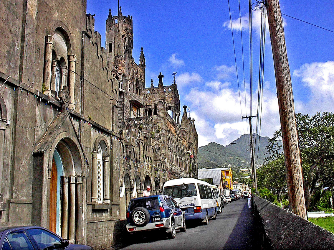
St. Vincent - Kingstown, Kloster