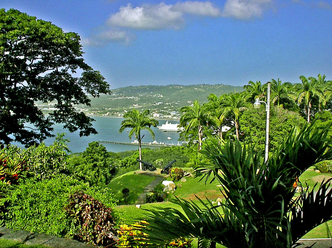
Blick vom Fort King über die Insel