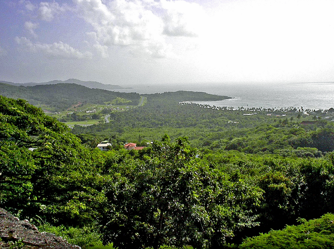
Blick von Fort King über Tobago