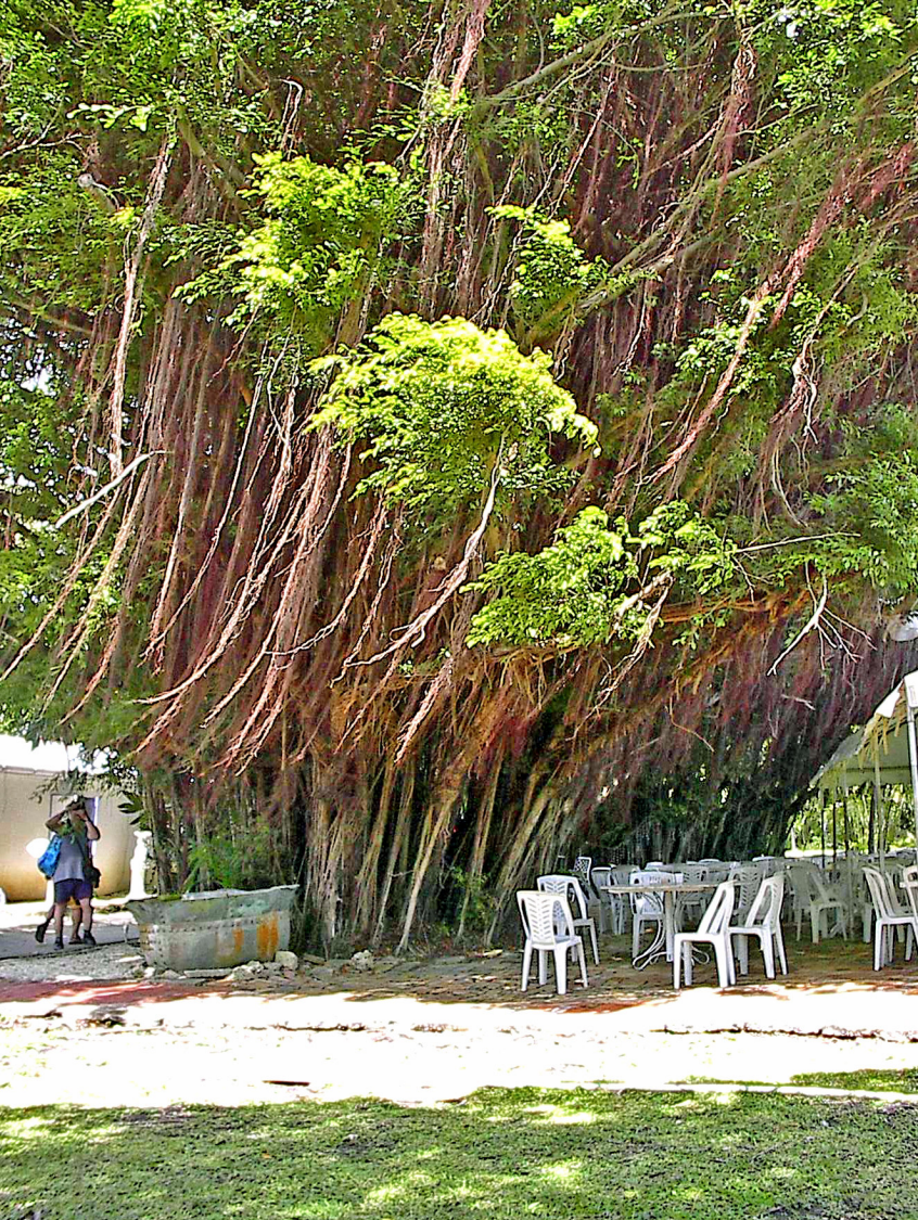
Barbados - Andromeda Botanic Garden riesige Bäume mit Luftwurzeln gaben der Insel den Namen