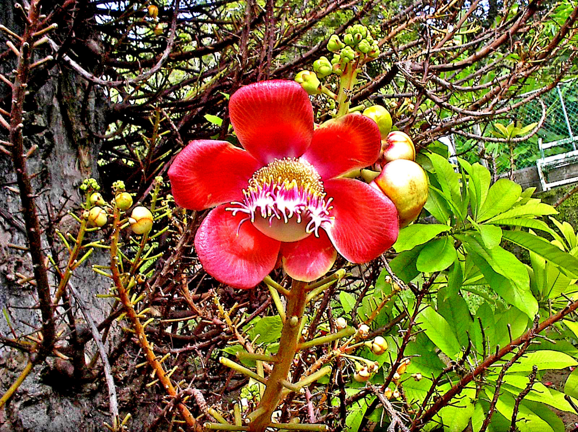
St. Vincent - Bot. Garten, Kanonenkugelbaum - Blüte