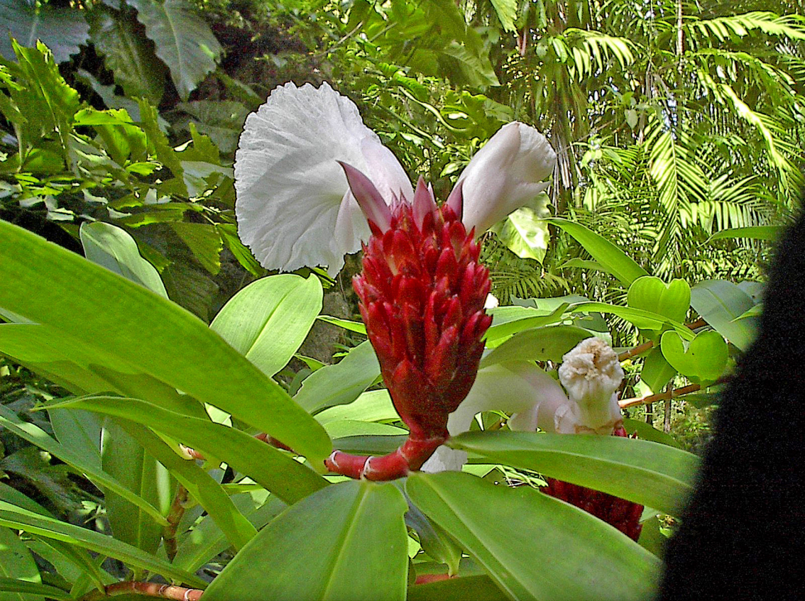
Barbados - Andromeda Botanic Garden