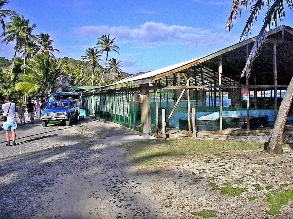
Bequia - Schildkröten-Aufzuchtstation