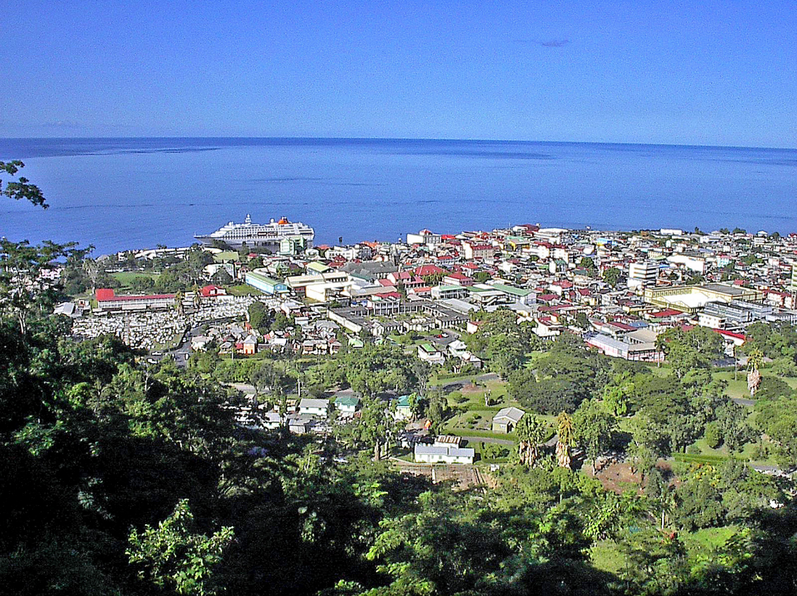
Roseau auf Dominica