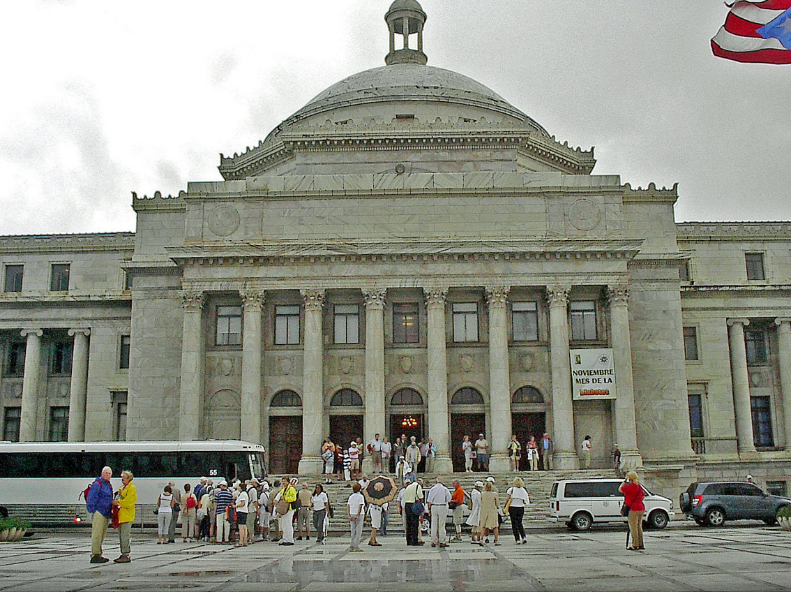
St. Juan - Capitol