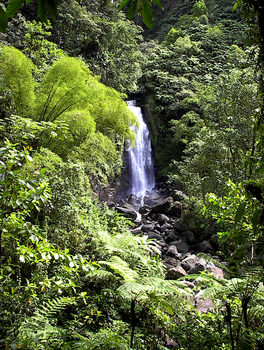
Dominica - Trafalga Fall