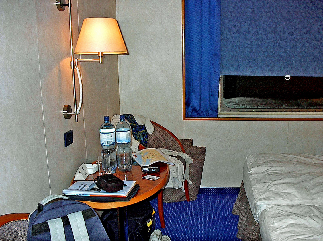
MS-Columbus - unsere Kabine Kat. 10