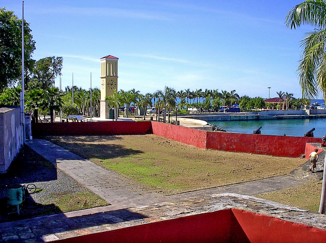
St. Cruix, Frederiksted, Festung (1780)