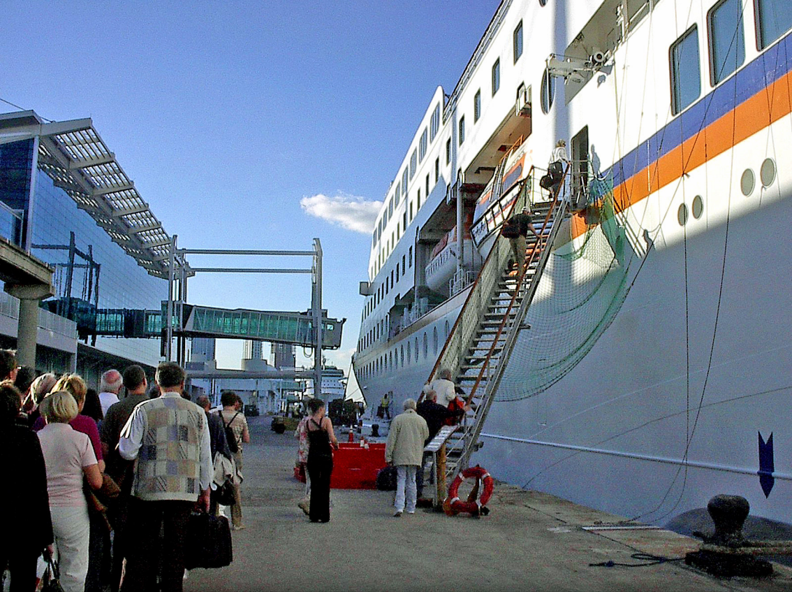
Maiami-Haden; es geht an Bord der MS-Columbus