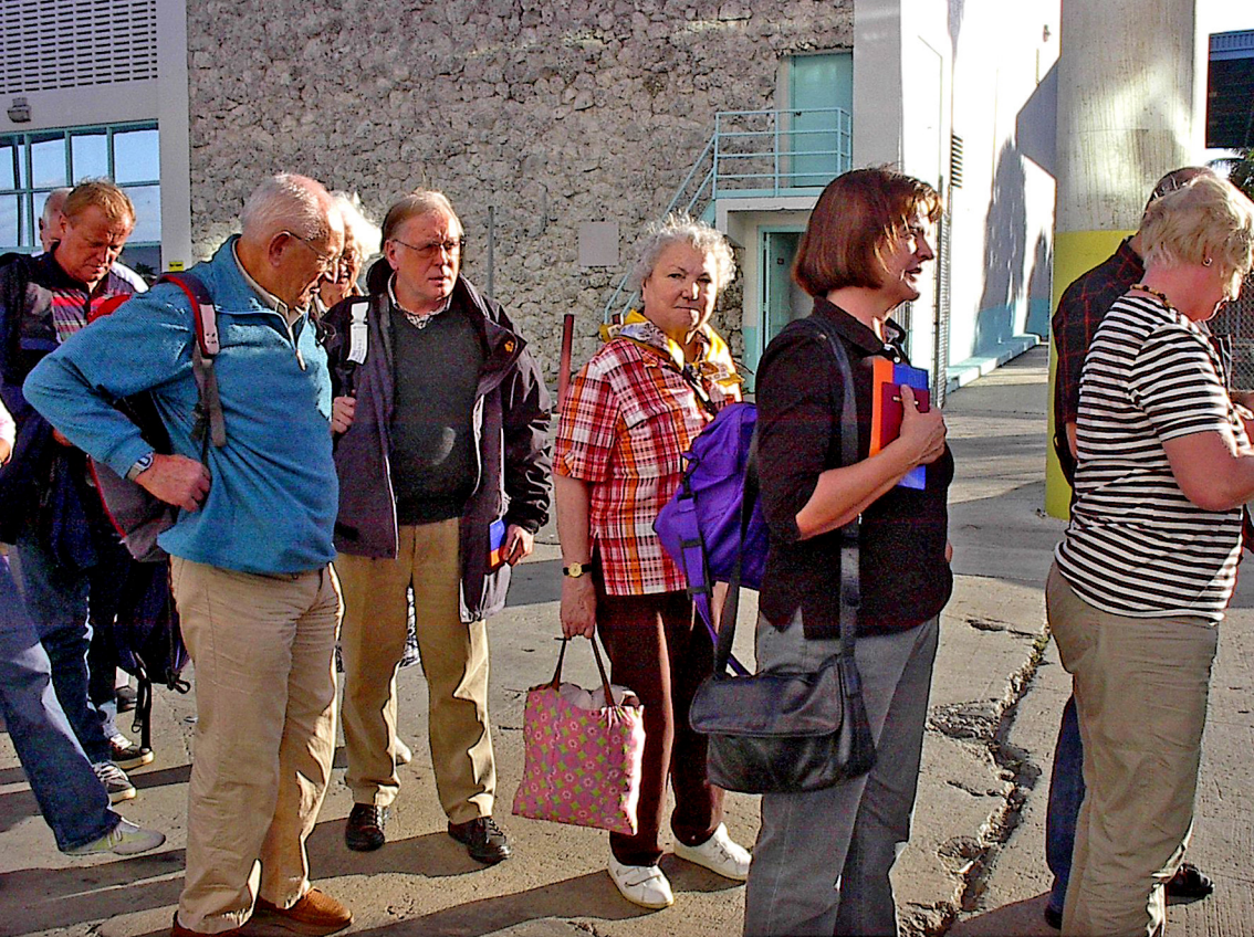
Miami-Hafen; es geht an Bord