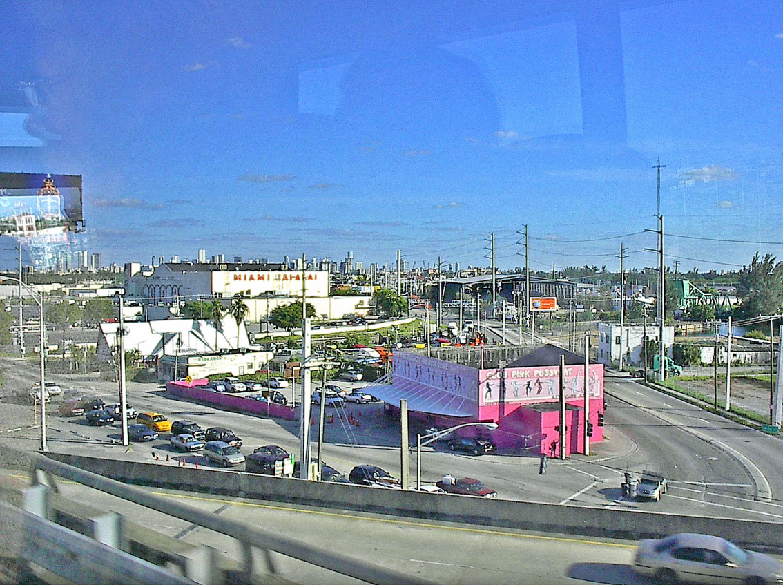
Miami - Stadtrundfahrt