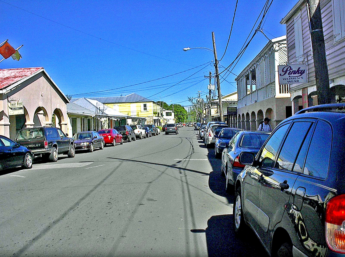
St. Cruix, Frederiksted, Marktstraße