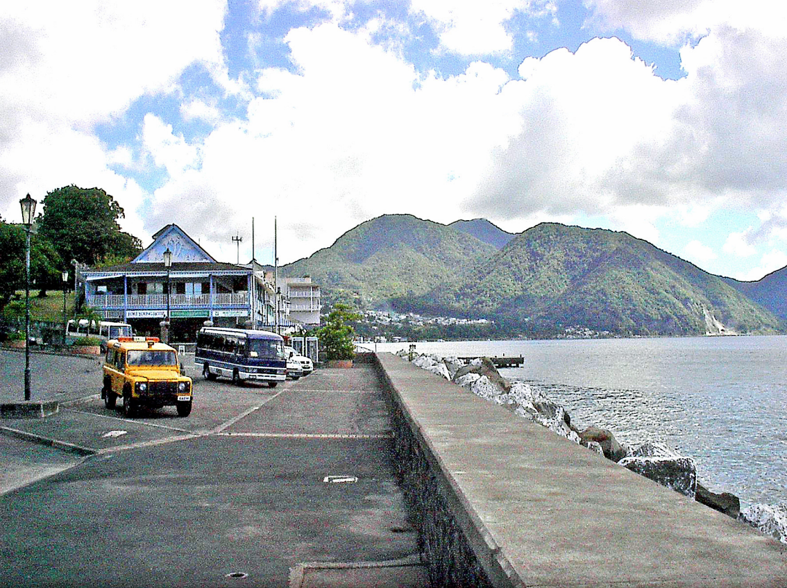
Roseau auf Dominica