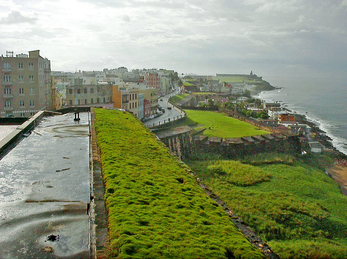
Blick von 'San Cristobal' auf St. Juan