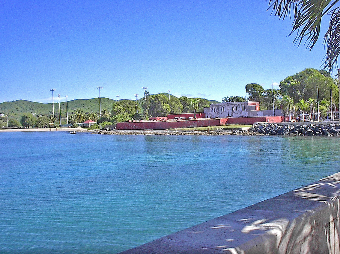
Hafen von St. Cruz