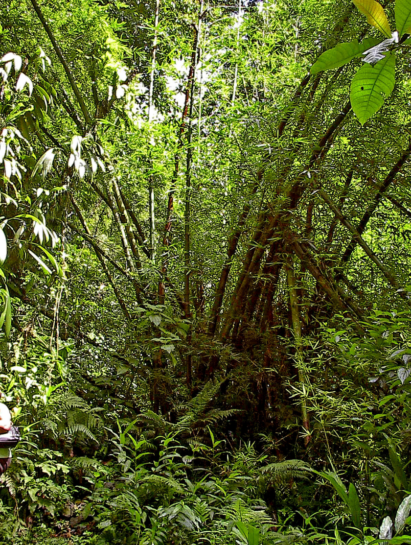
Dominica - zwischen Farnen und Orchideen