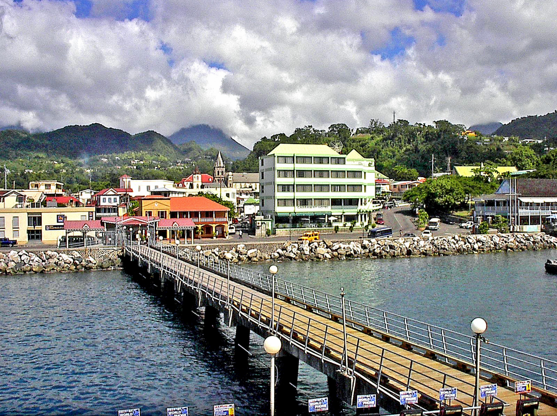
Roseau auf Dominica