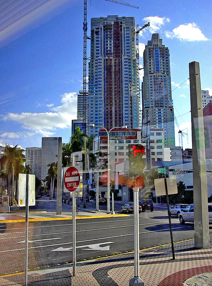
Miami - Stadtrundfahrt