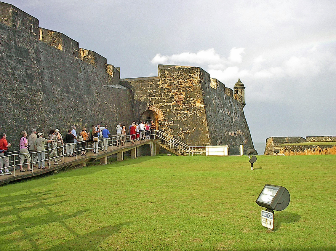
San Juan - Festung Del Morro