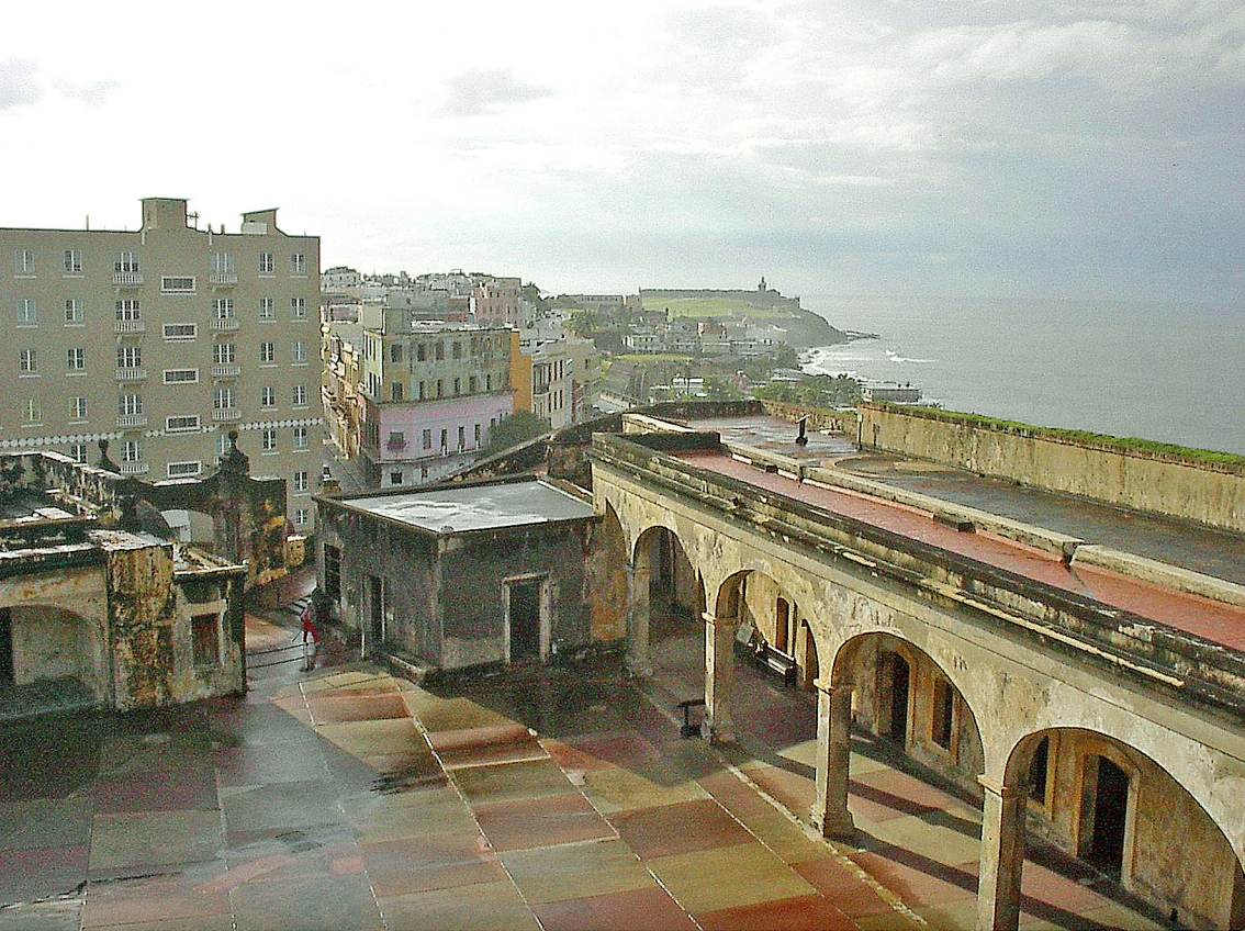
St. Juan - Festung San Cristobal (1539)