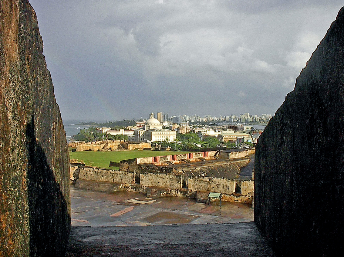
Blick von Del Morro auf St. Juan