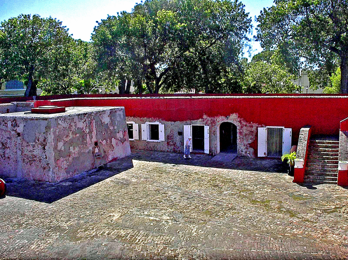
St. Croix, Frederiksted, Festung (1780)