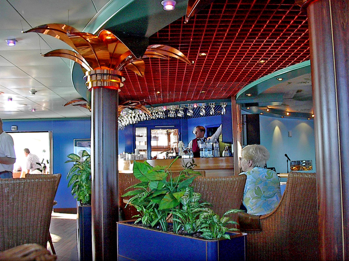
MS-Columbus - Bar