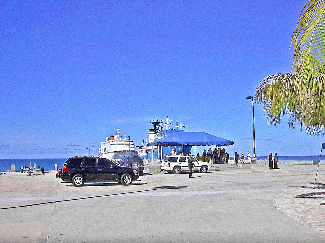
im Hafen von St. Cruz