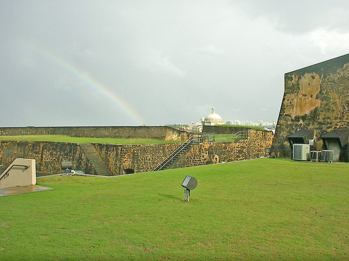
San Juan - Festung Del Morro (1539)