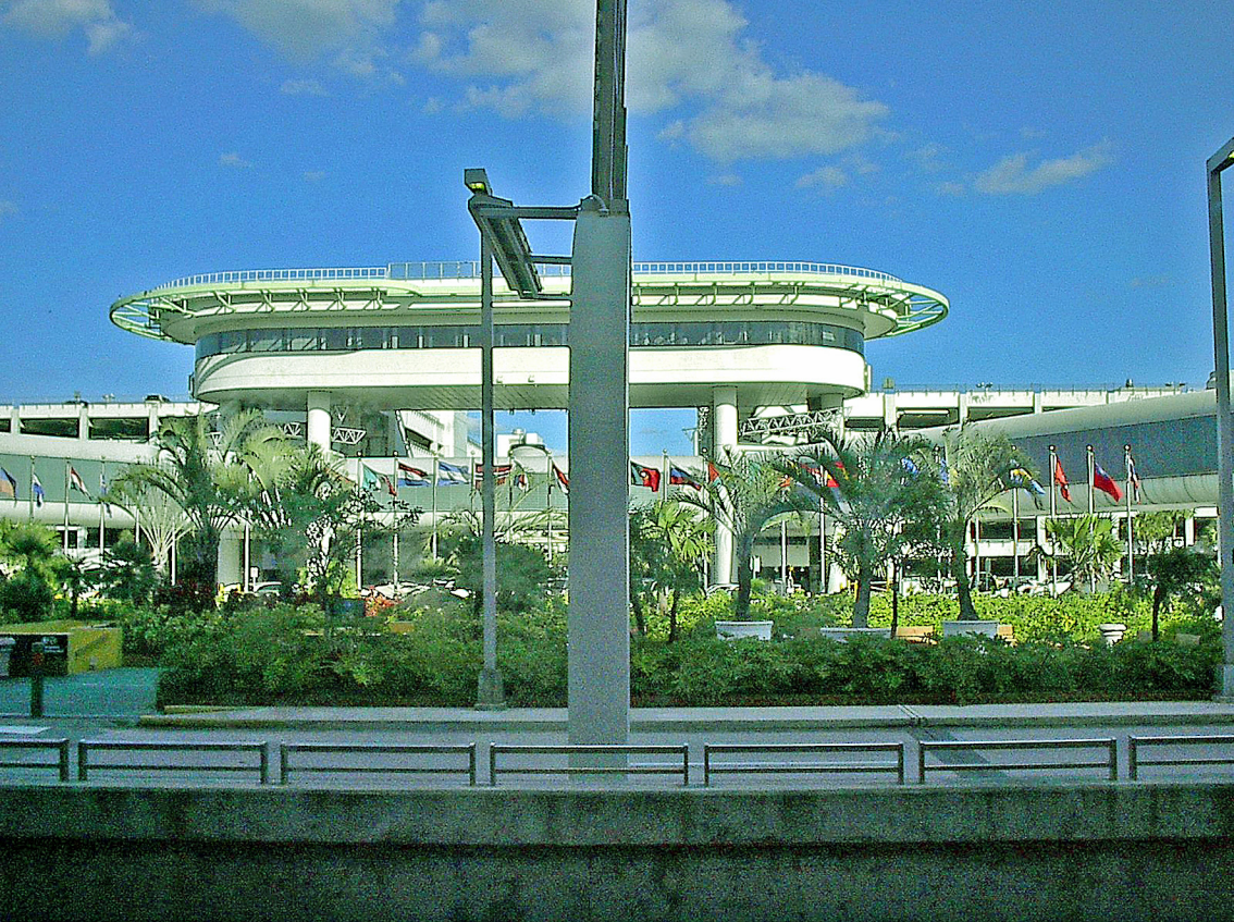
Miami - Flughafen