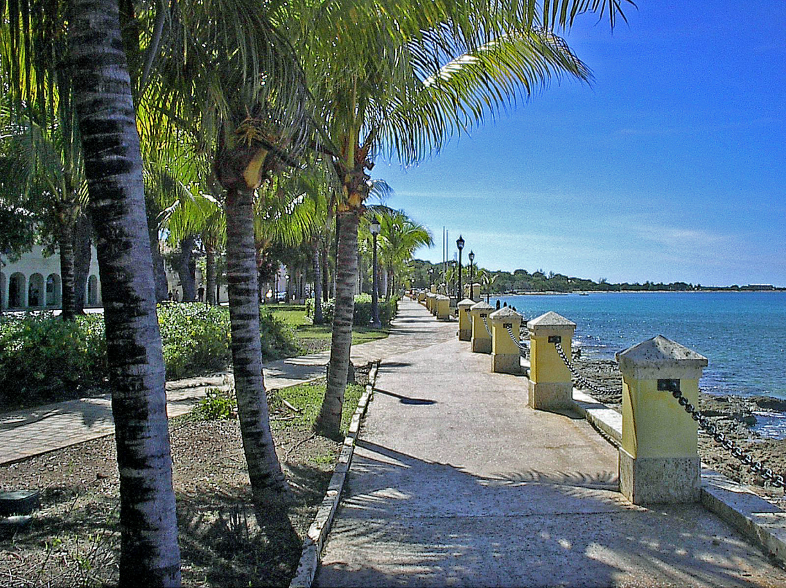
St. Cruix, Frederiksted, Küstenpromenade