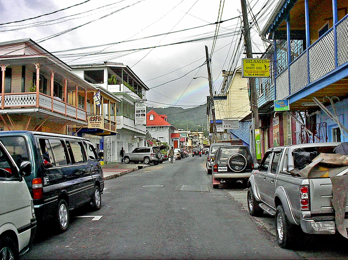
Roseau auf Dominica