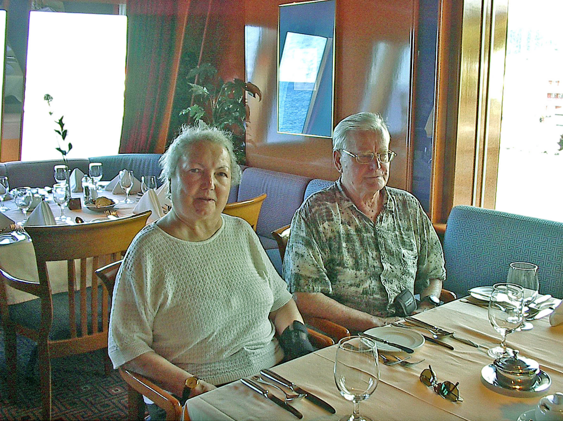
MS-Columbus - unsere Tischplätze