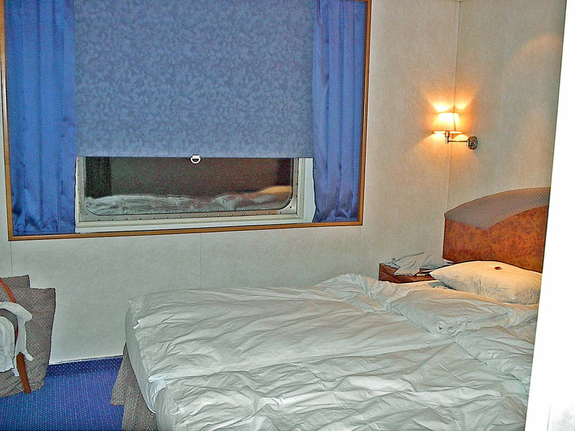
MS-Columbus - unsere Kabine