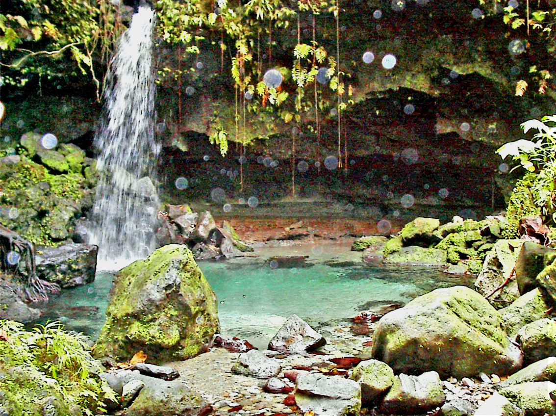
Dominica - Emerald Pool