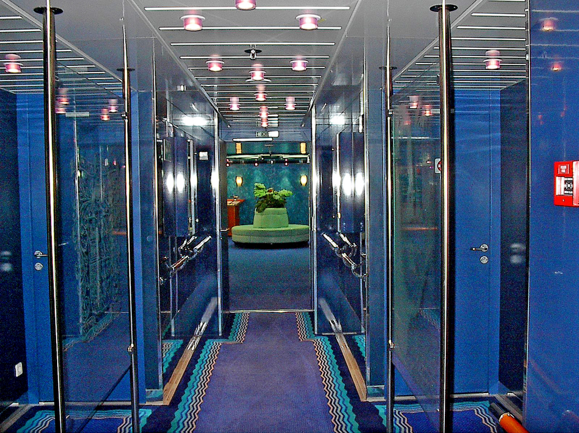
MS-Columbus - bei den Liften