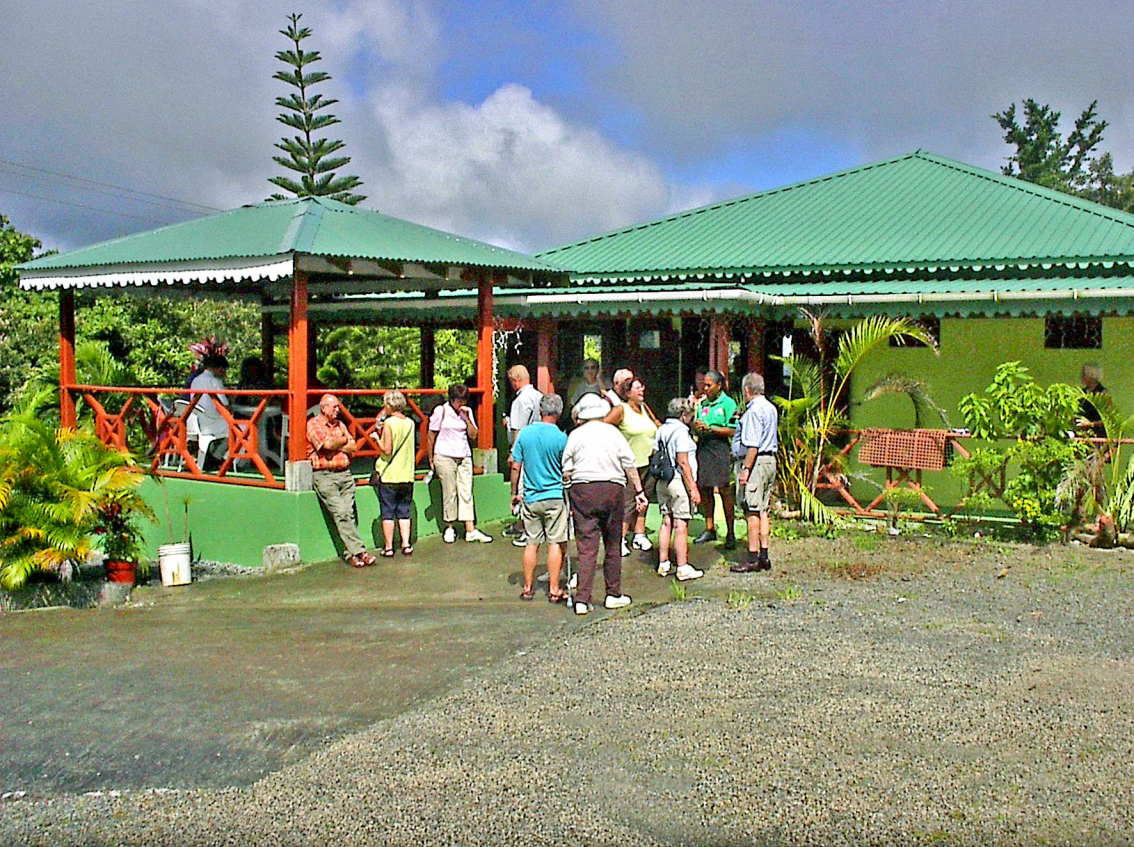
Dominica - im Tal des Morne-Trois-Piton (1380 m)