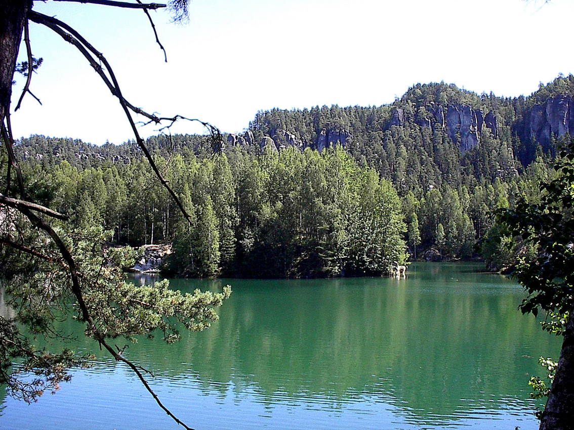
See am Eingang zur Aderspacher Felsenstadt