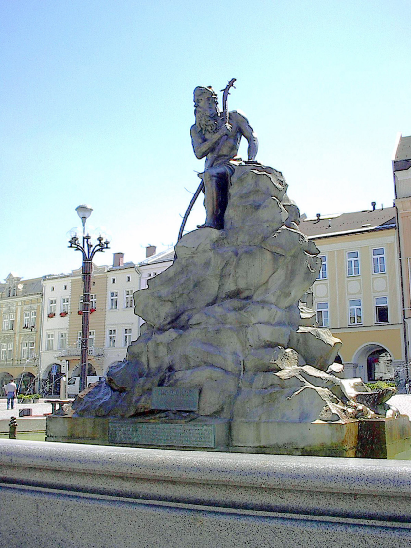
Trutnov - Růbezahel-Brunnen