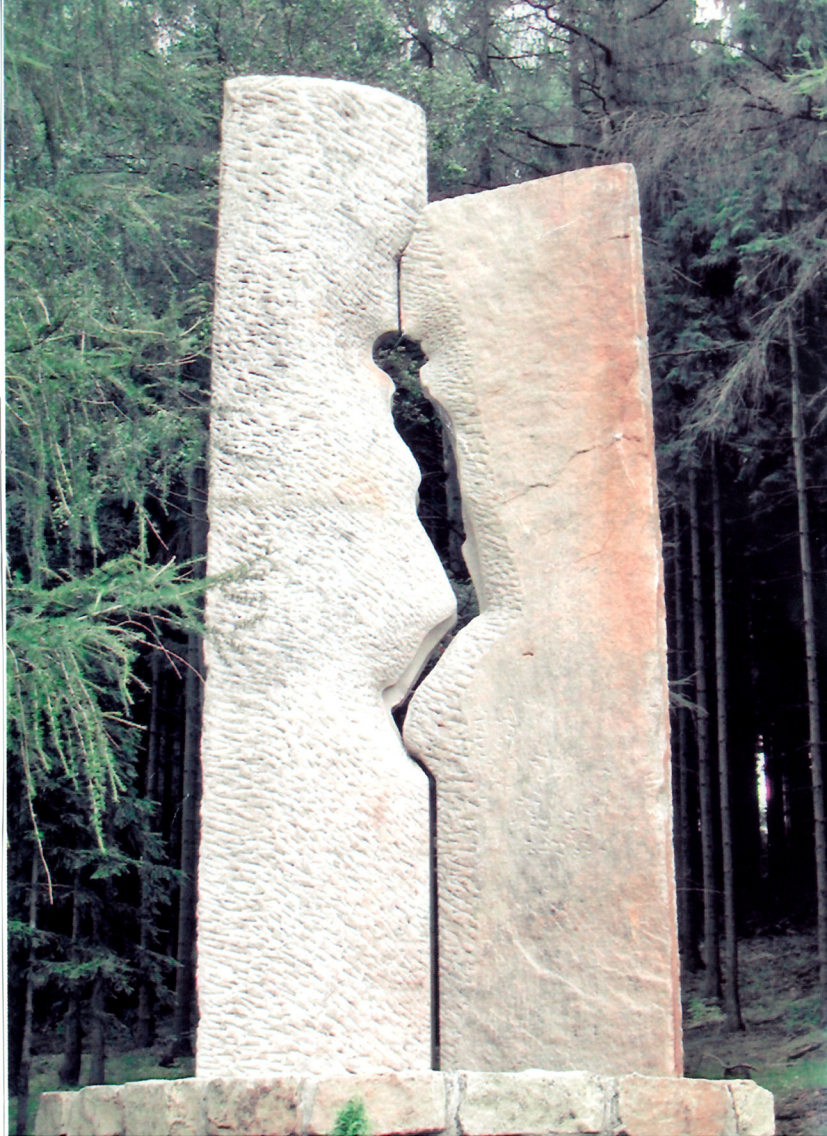
Skulptur zum Gedenken der 1945 bei Wekelsdorf ermordeten 21 deutschen Frauen und Kindern