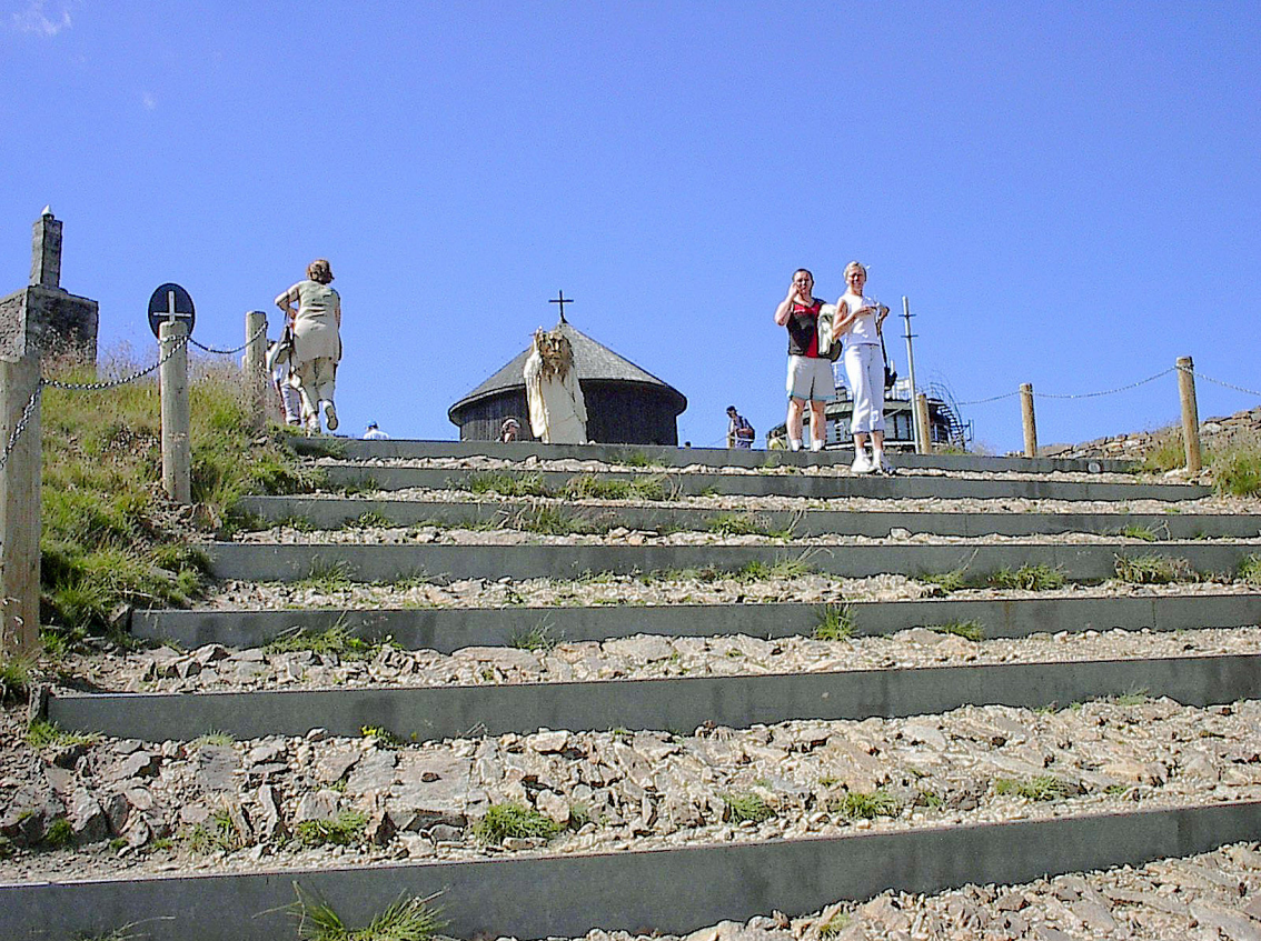
Schneekoppe - Rübezahl vor der Laurentius-Kapelle