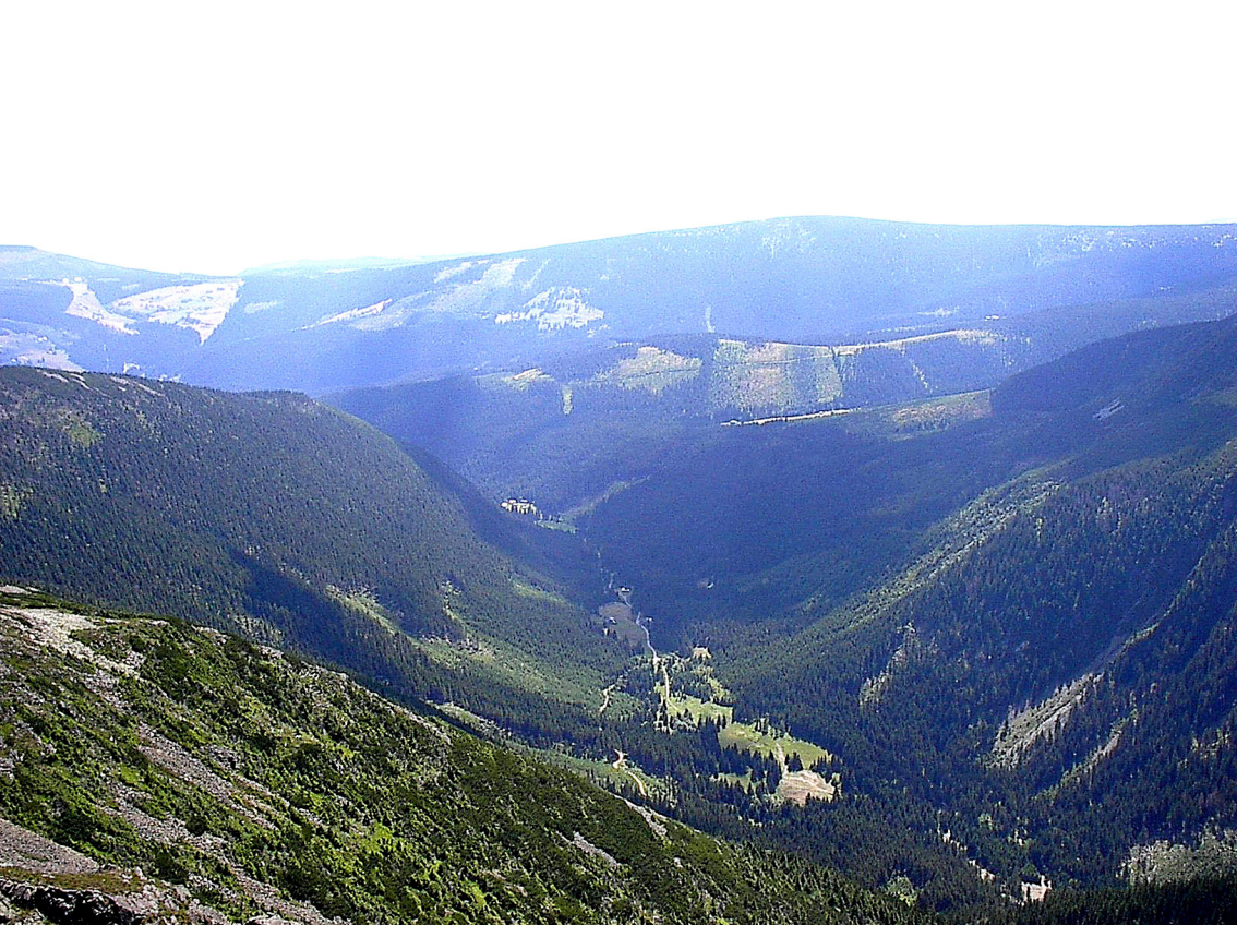
Schneekoppe - Blick nach Süden