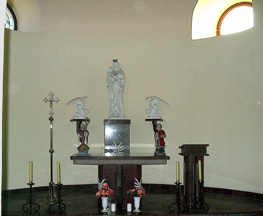
Schneekoppe - in der Laurentius-Kapelle