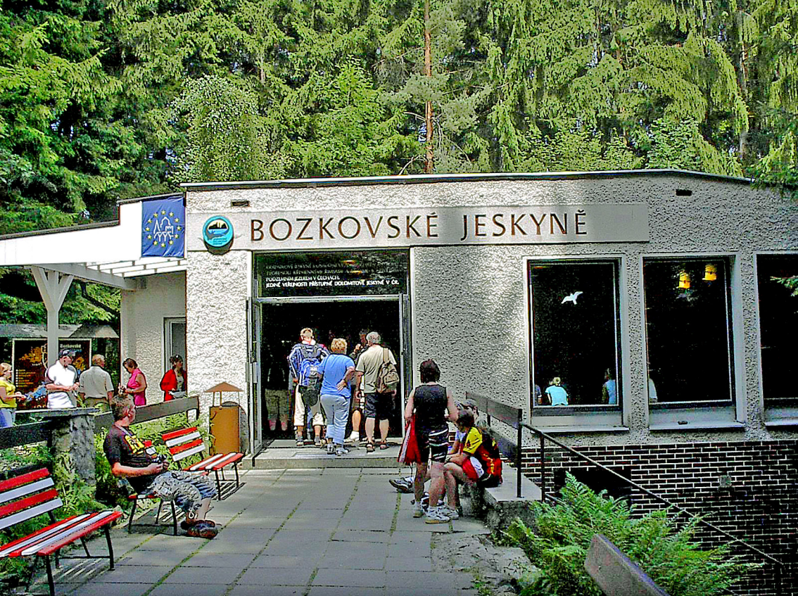
Höhle im Böhmischem Paradies (bei Zelezny Brod)