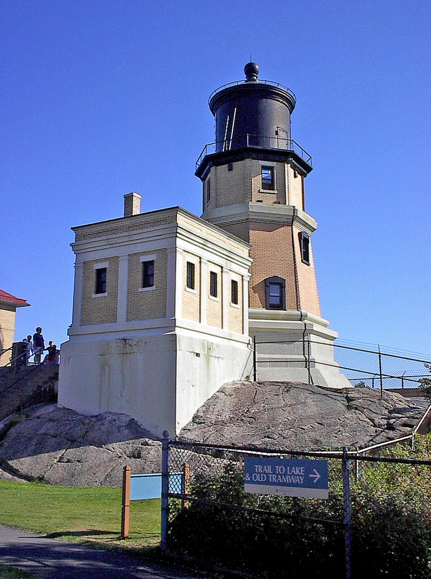
Split Rock Lighthouse (Drehgestell schwimmt auf Quecksilber)