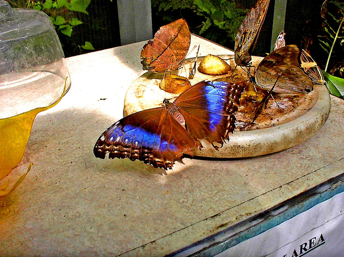
Mackinac - eines der schönsten Schmetterlingshäuser