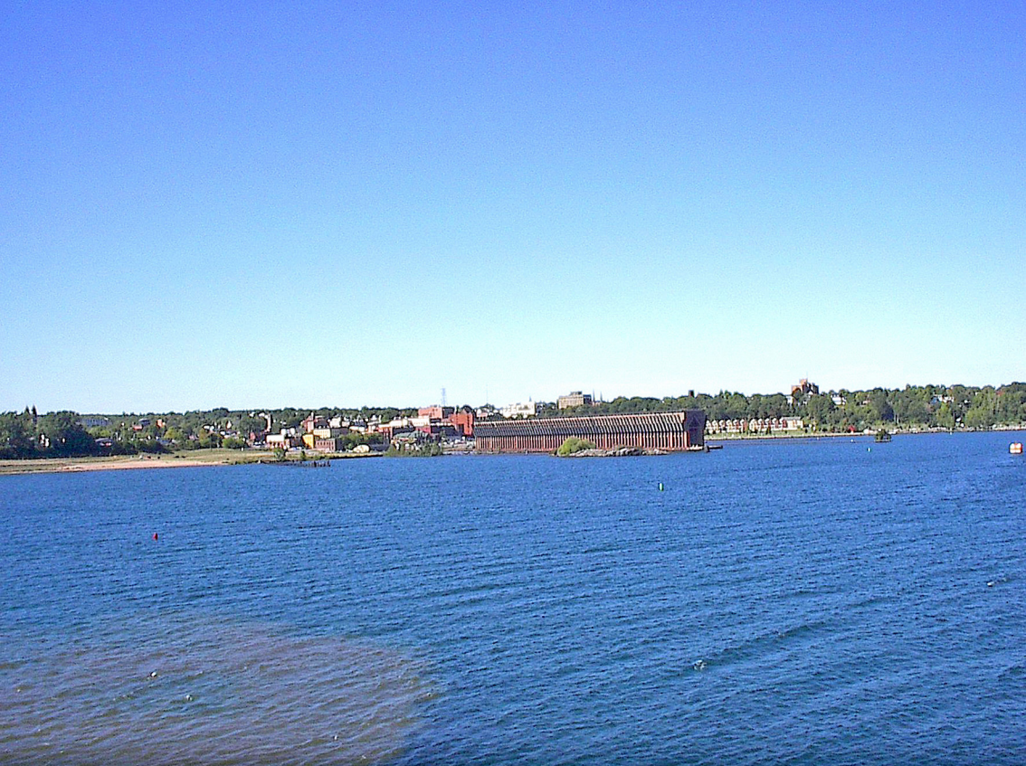
Duluth - Erz-Verlade-Hafen