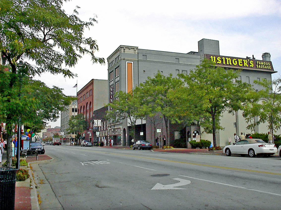
Milwaukee - Old World Third Street, die berühmte Usinger's Wurstfabrik