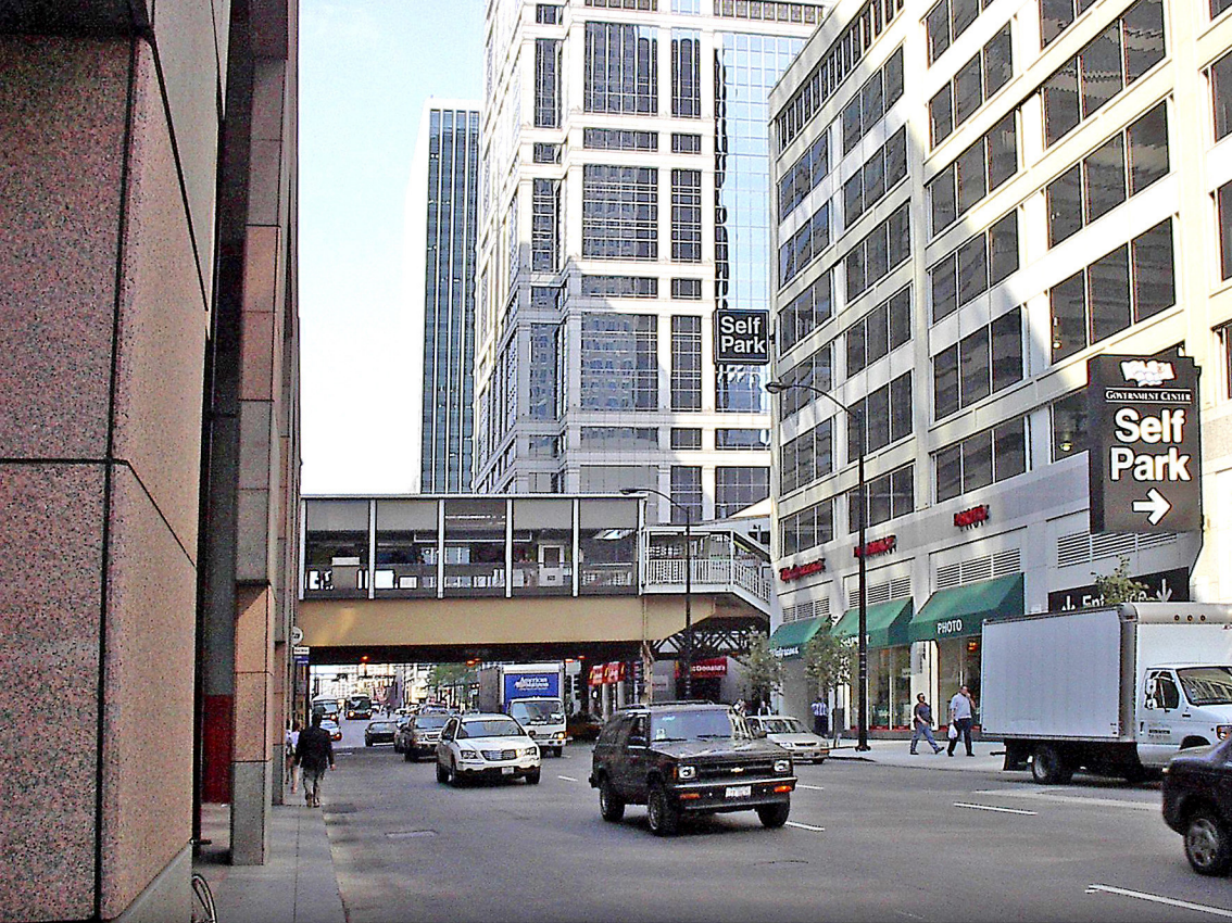
Chicago - CircleTrain Station