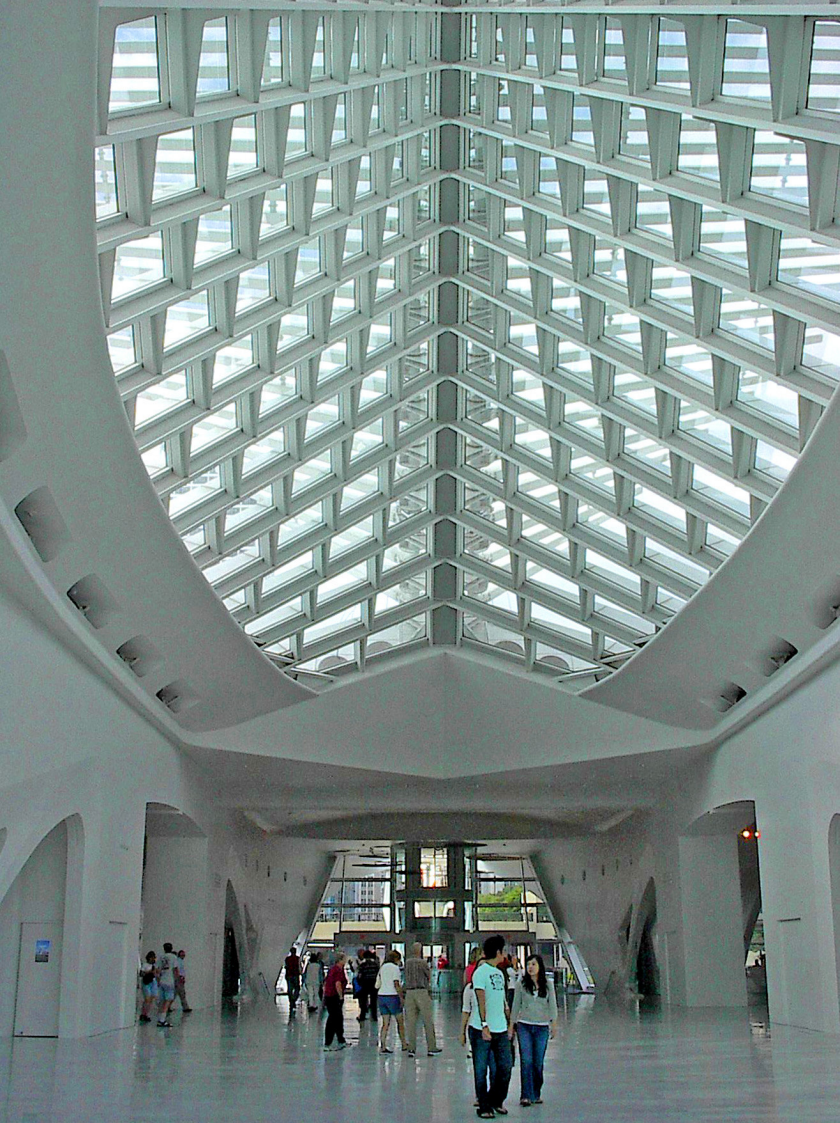
Milwaukee - Kunstmuseum