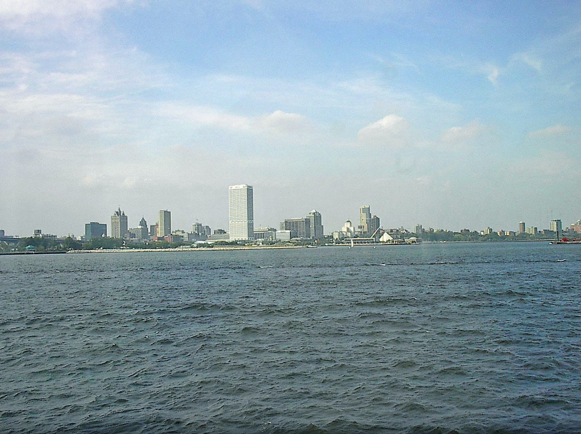
Milwaukee - Skyline von der Hafeneinfahrt