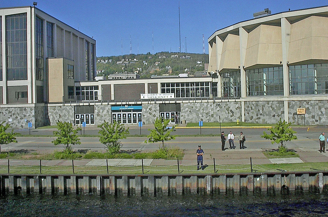
Duluth - Kai