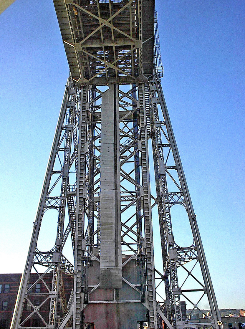
Aerial Lift Bridge - die MS Columbus passt gerade durch