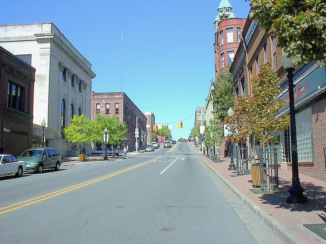
Marquette - Mainstreet