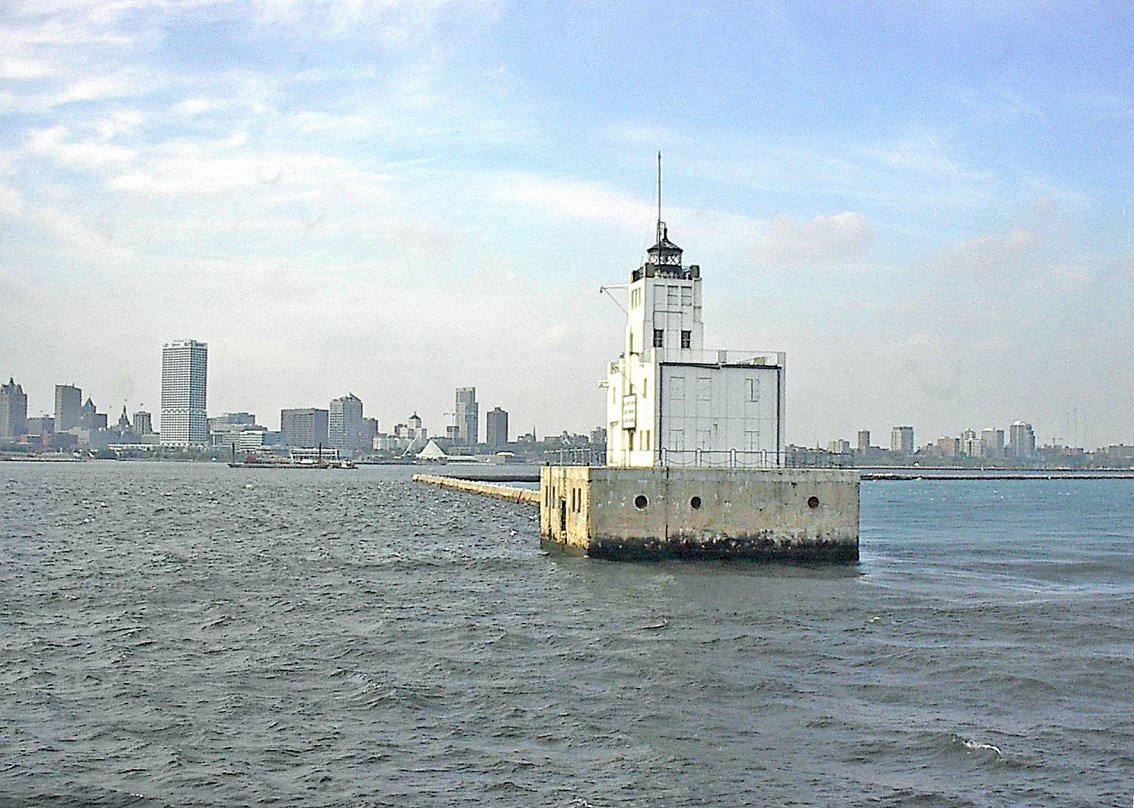
Milwaukee - Hafen-Einfahrt