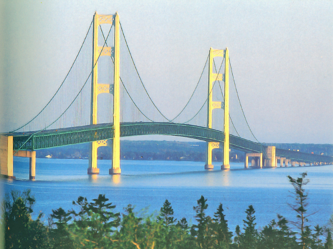
Mackinac-Brücke - 8 km lang am Lake Michigan