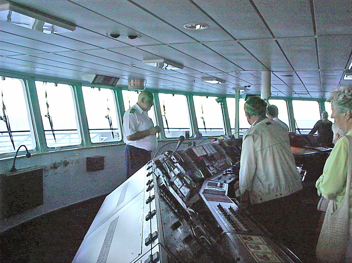
Der Kapitän auf der Brücke der MS Columbus