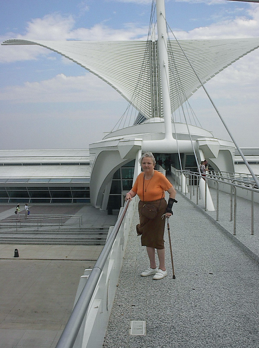
Milwaukee - Kunst-Museum