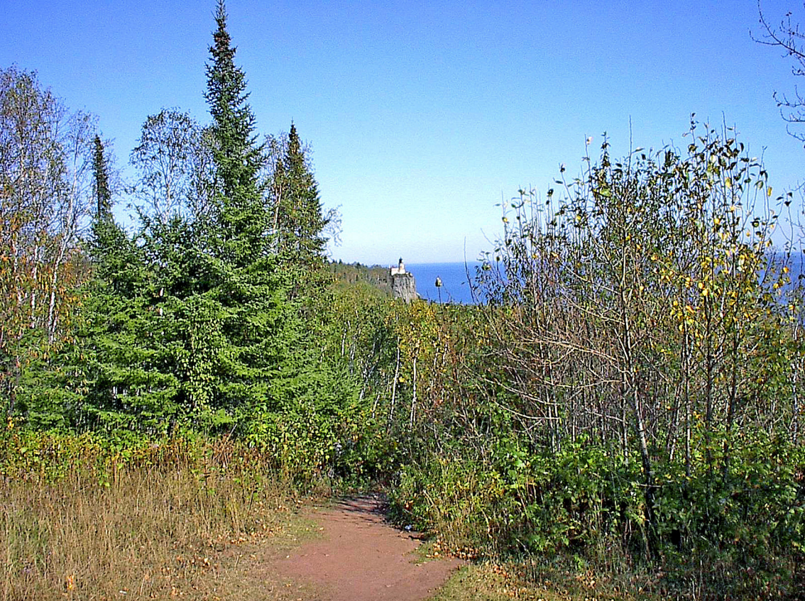
am Highway 61 auf der Klippe das Split Rock Lighthouse