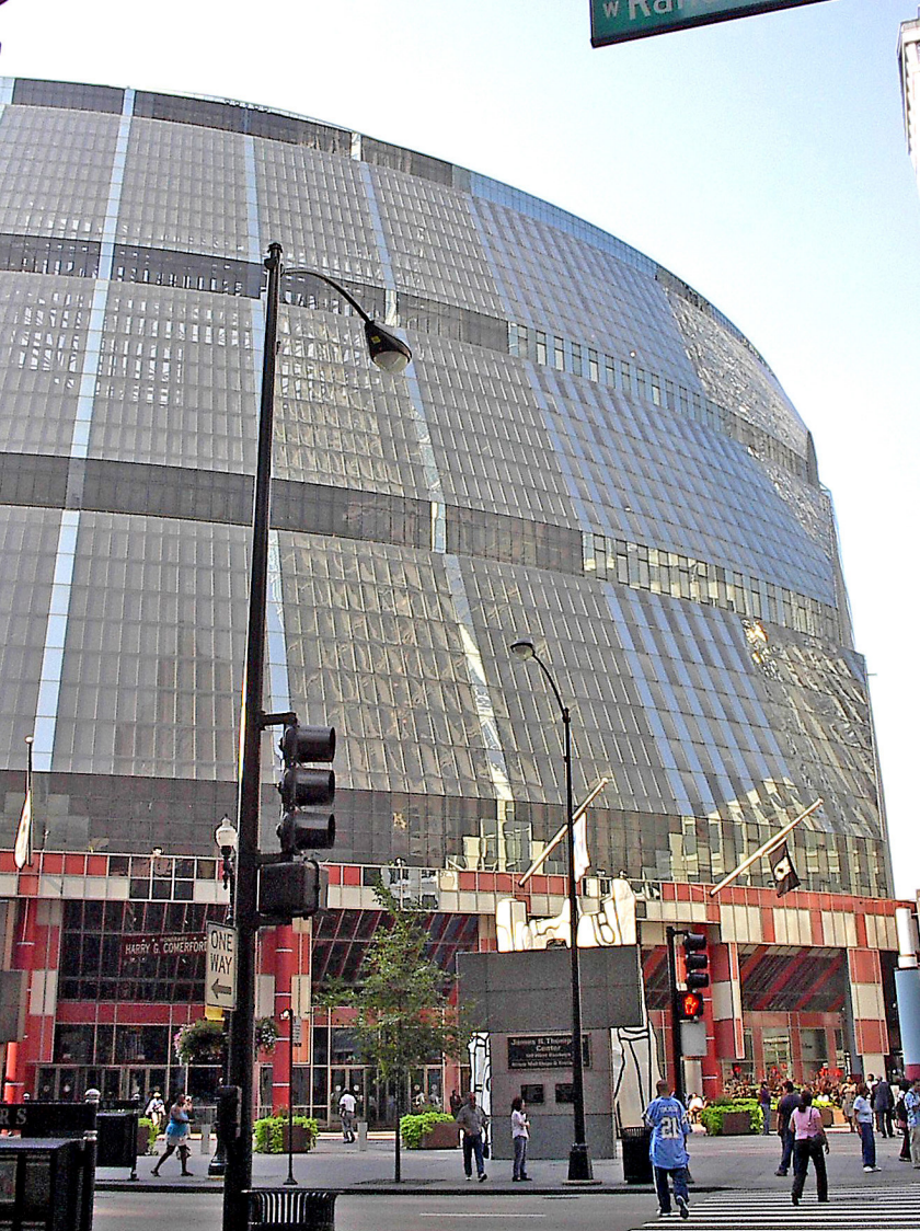
Chicago - moderne Architektur