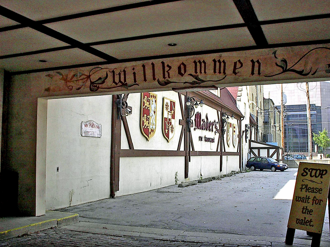
Milwaukee - Old World Third Street, das berühmte Mader's Restaurant