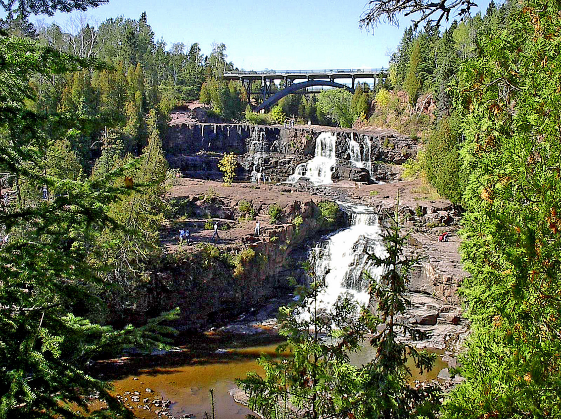
Falls am Gooseberry River (bei Duluth)