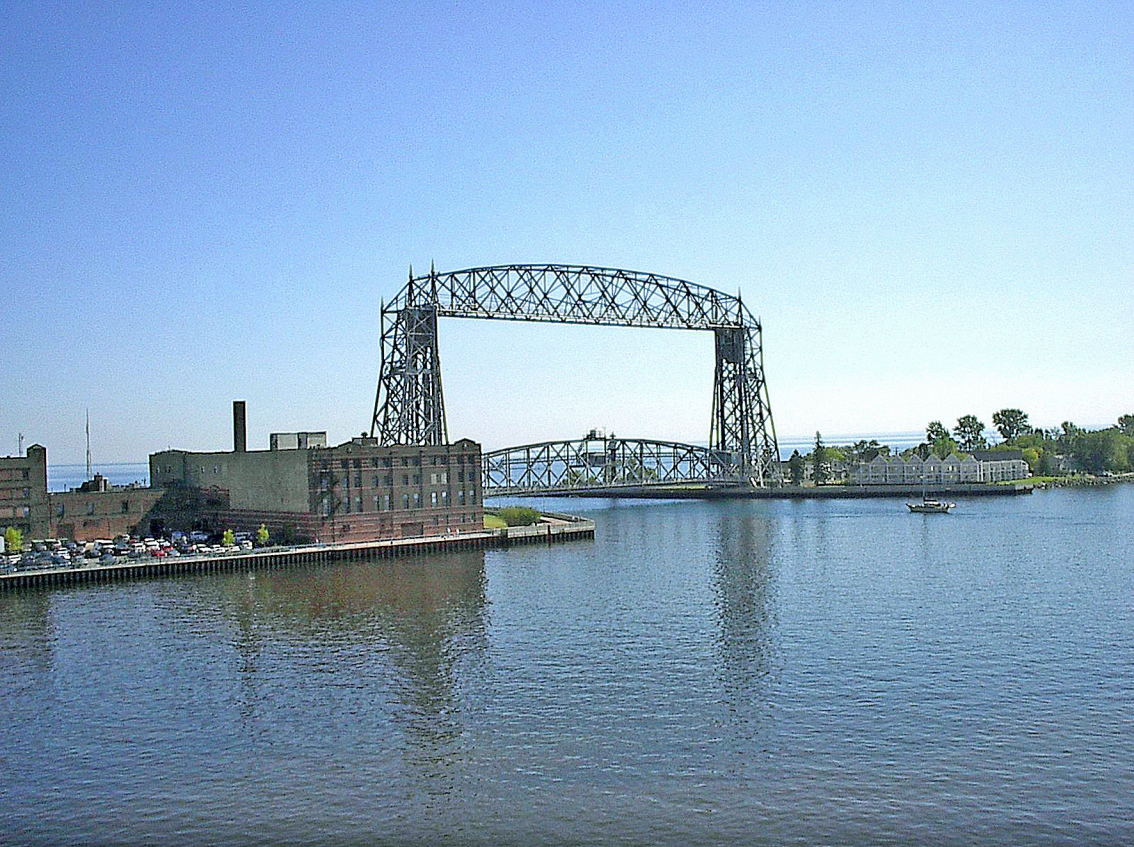
Duluth - Aerial Lift Bridge