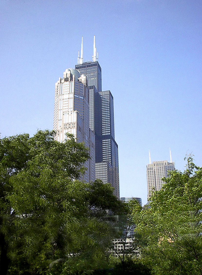
Chicago - Searstower