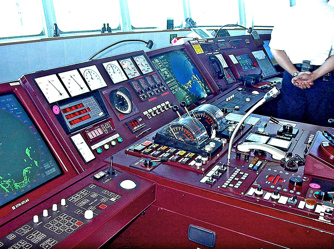
Die Brücke der MS Columbus