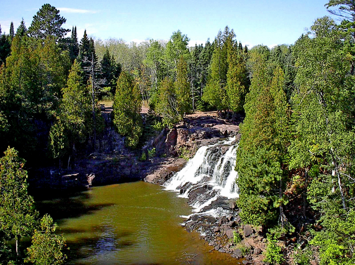
Falls am Gooseberry River (bei Duluth)