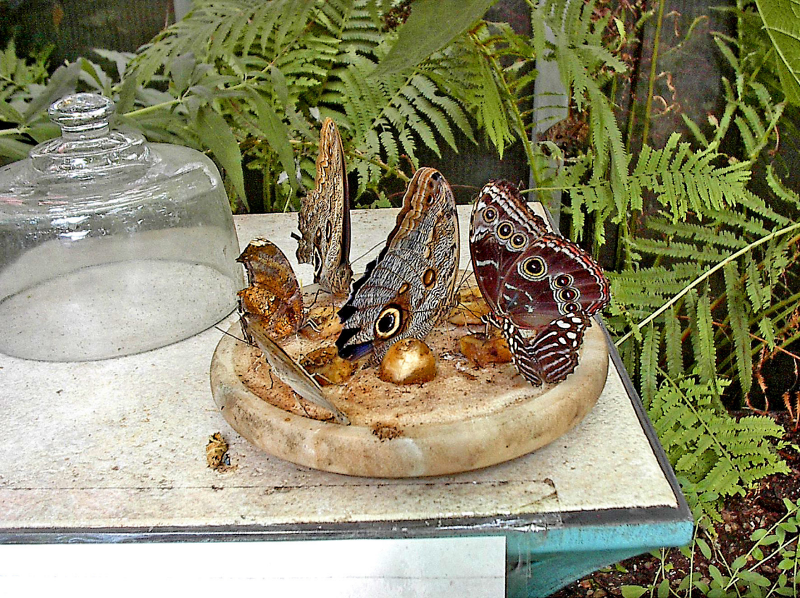
Mackinac - eines der schönsten Schmetterlingshäuser