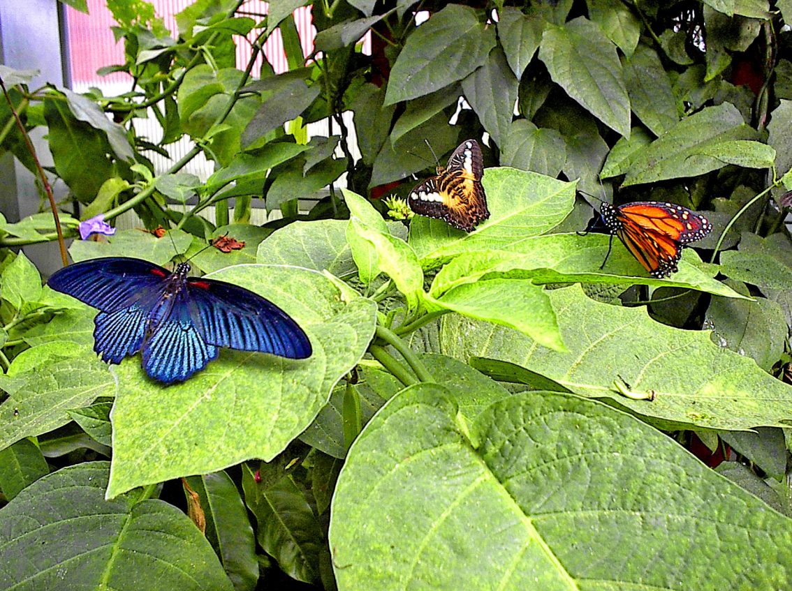
Mackinac - eines der schönsten Schmetterlingshäuser