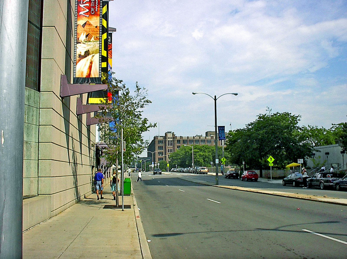
Milwaukee - Old World Third Street