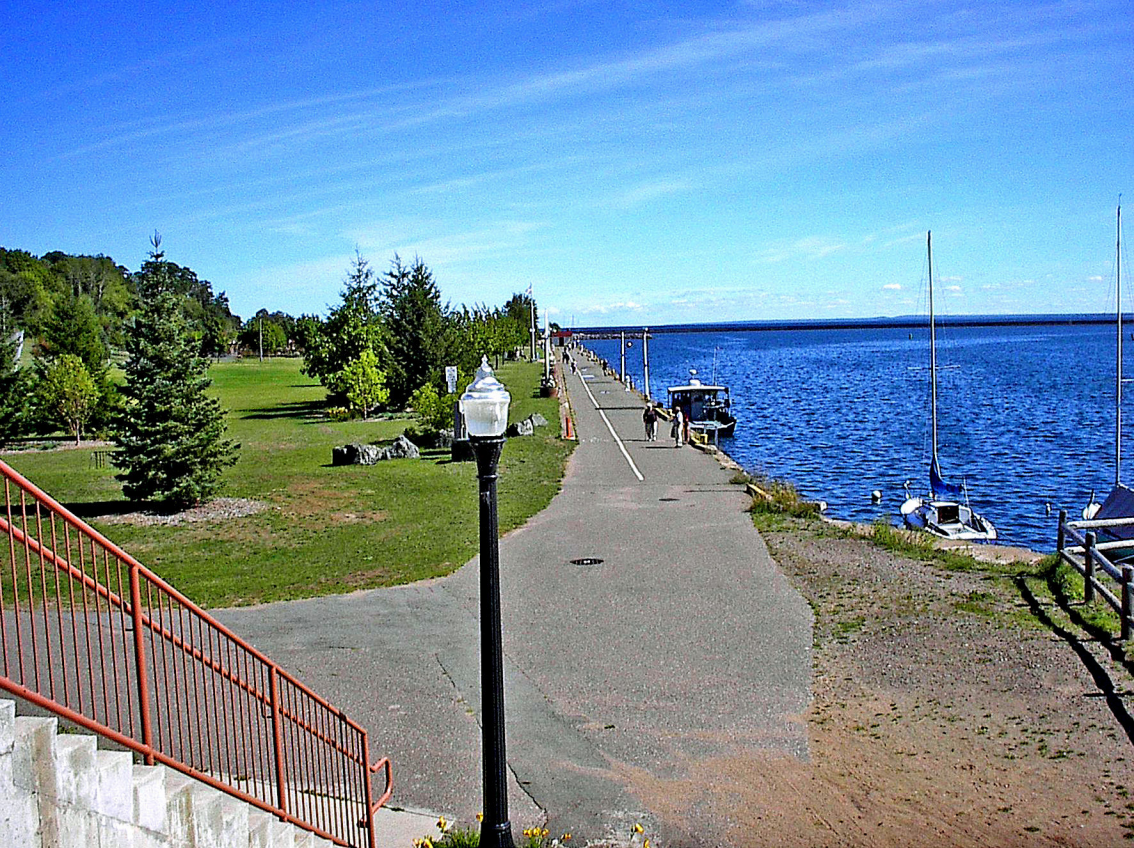
Duluth - Strand