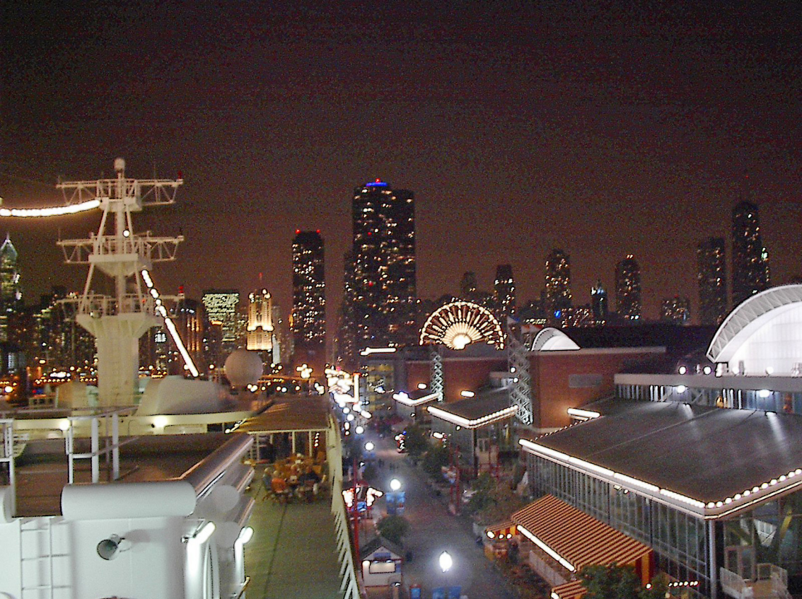
Chicago - vom oberen Deck der MS Columbus am Navy Piers