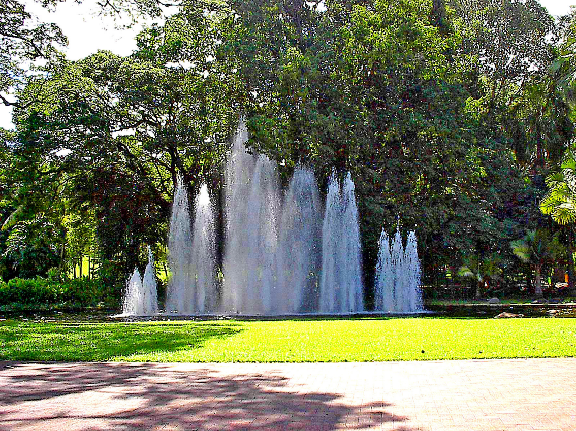
Darwin - Botanischer Garten