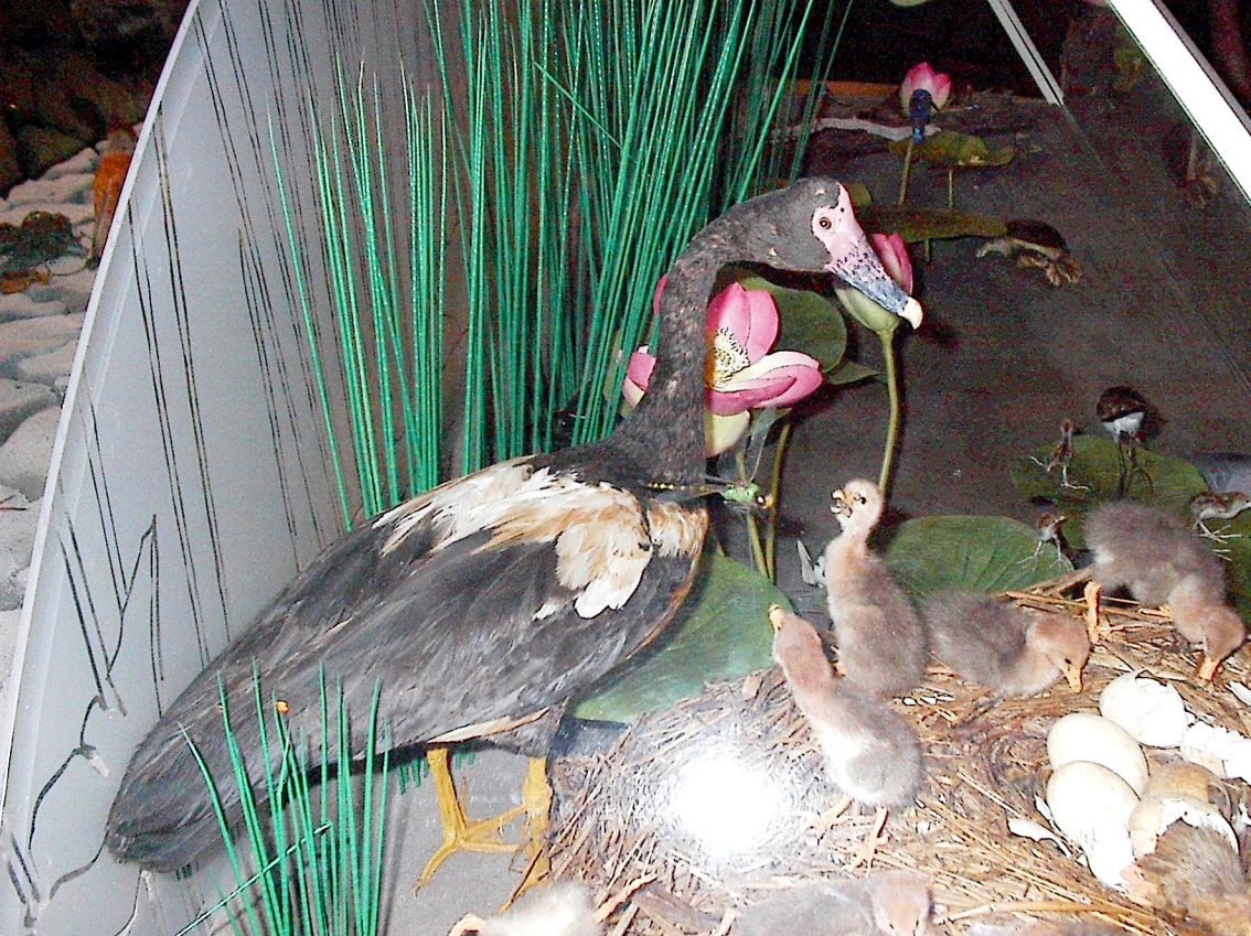
Darwin - im 'Wildlife-Parc'