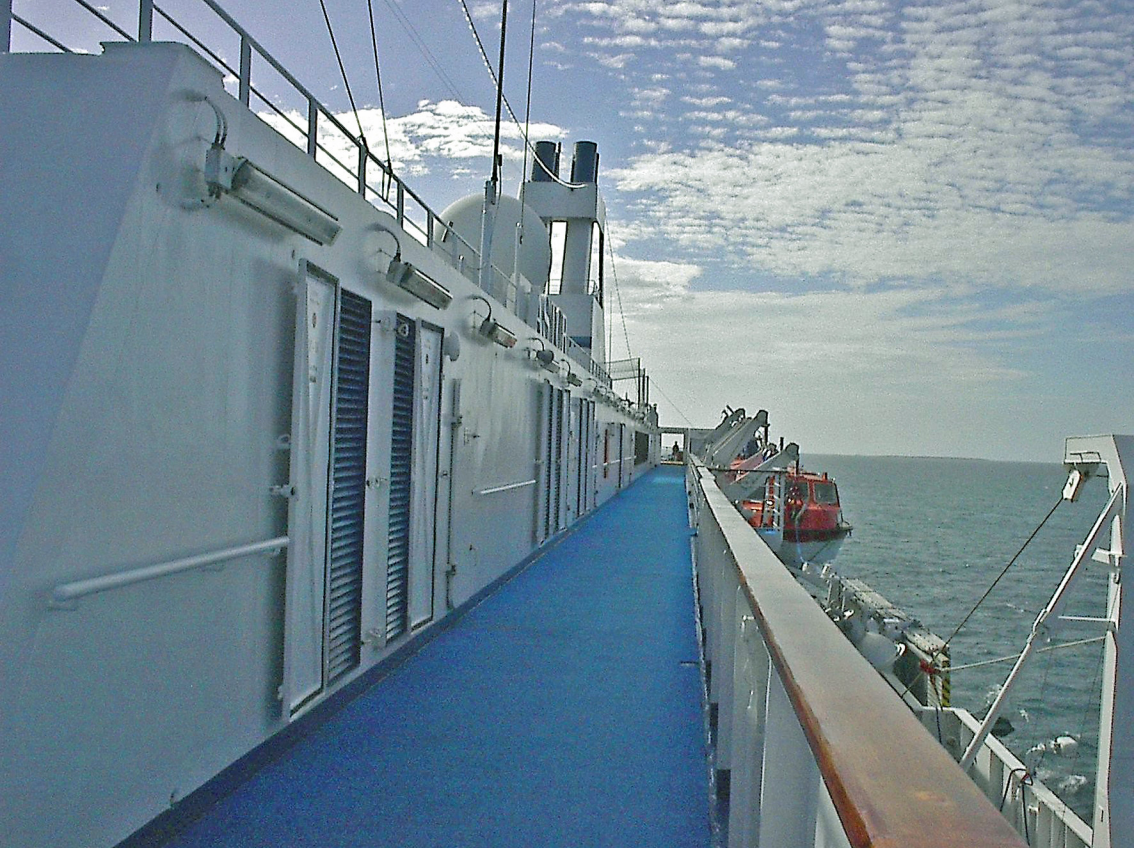
MS Astor - außen