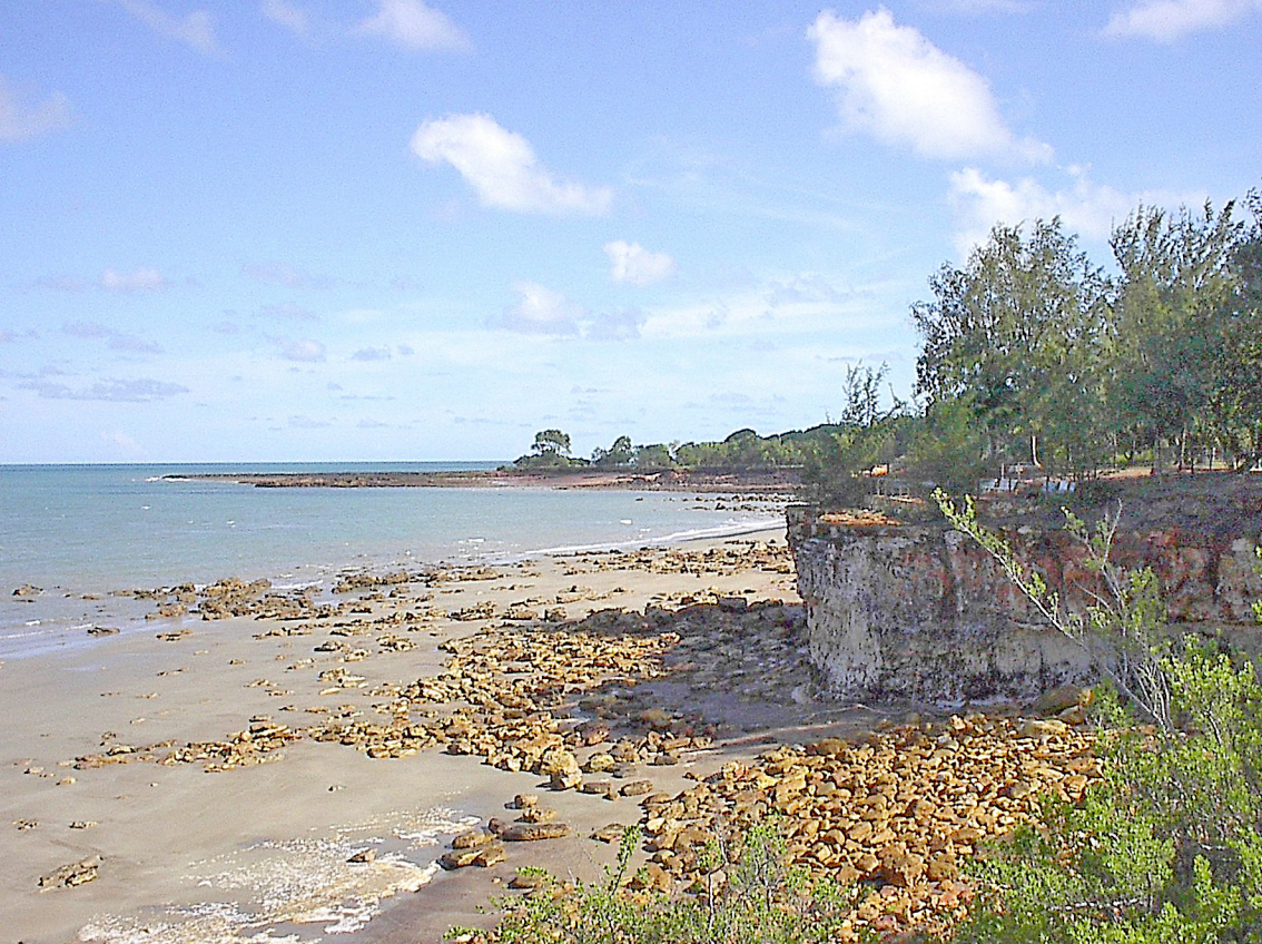
Darwin - Nordküste