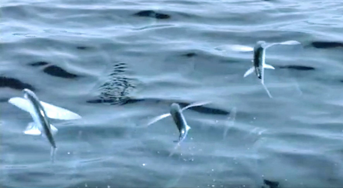
Fliegende Fische (Segler)