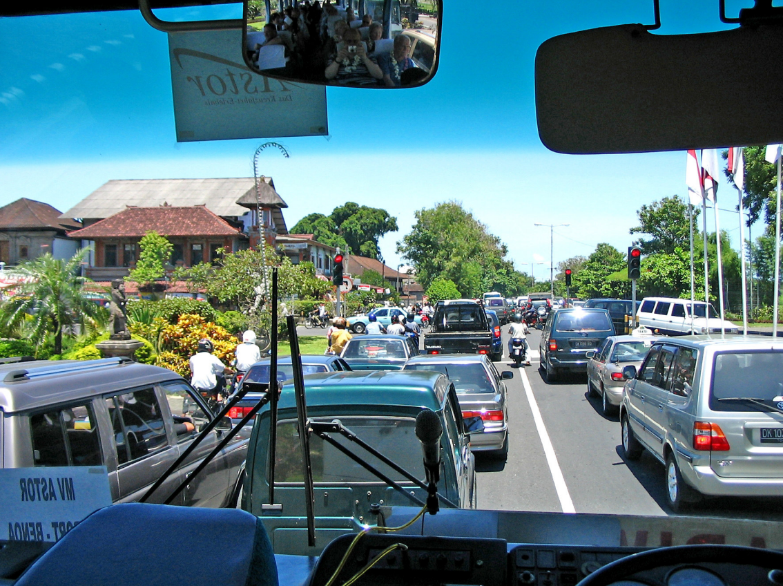
Bali - Bena