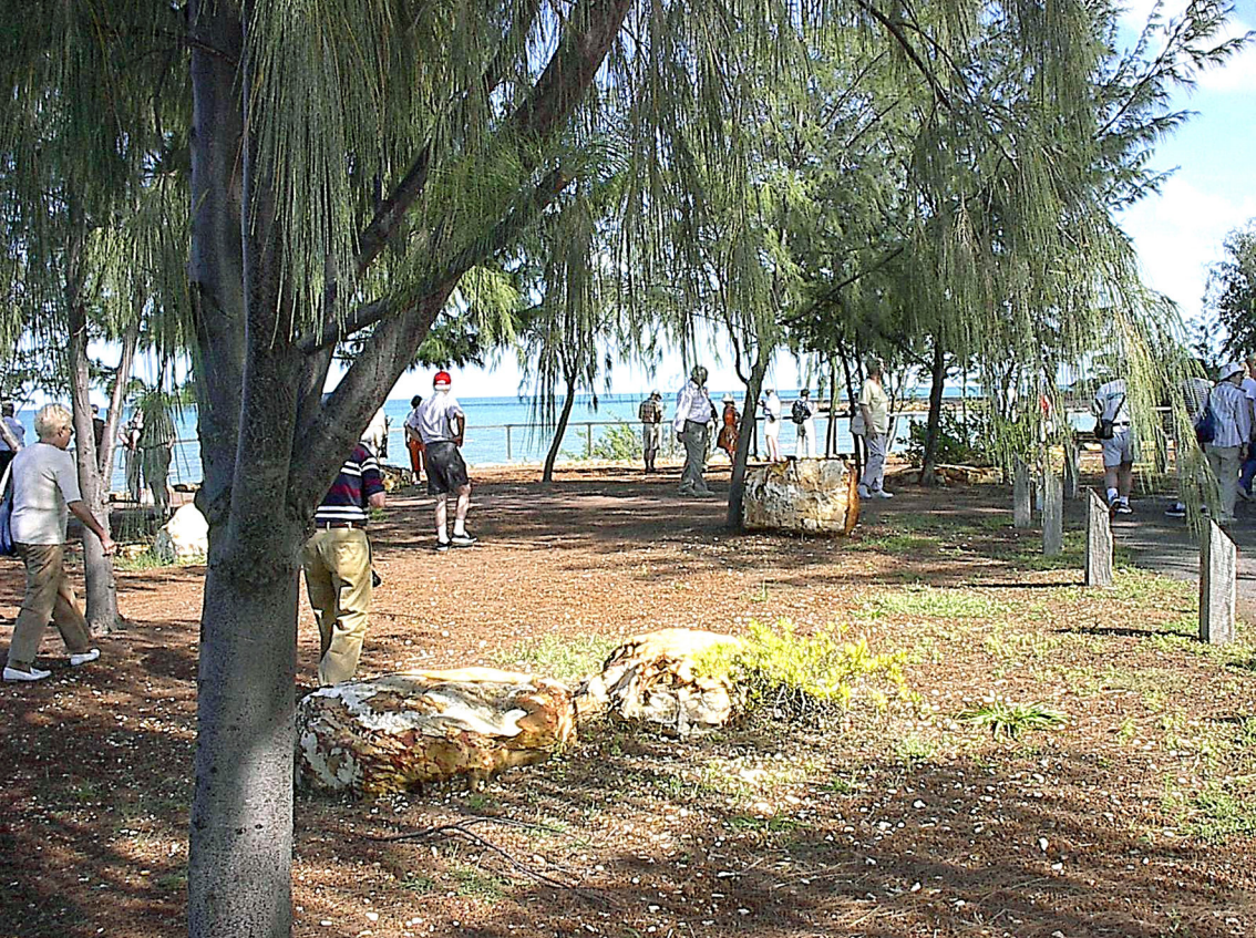
Darwin - Nordküste