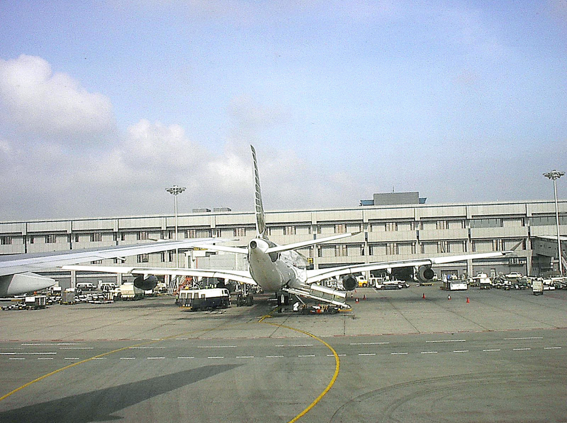
Bali - Flughafen