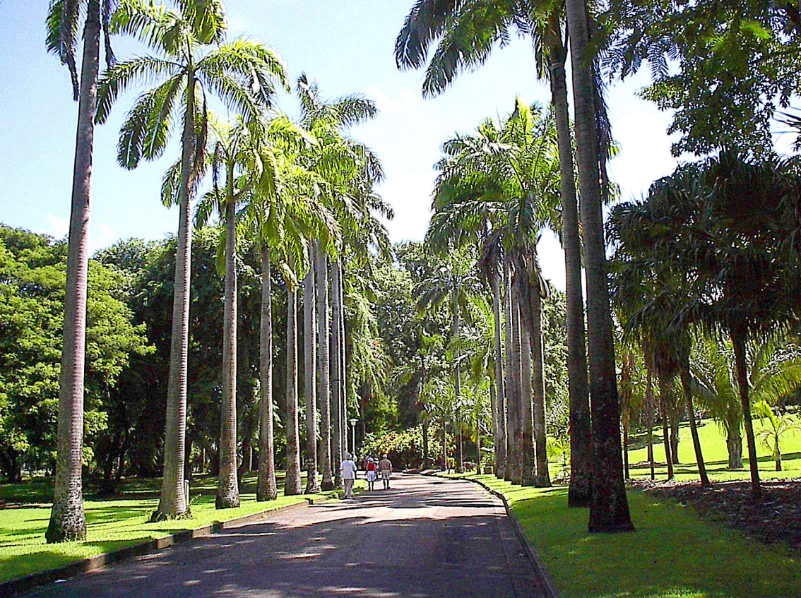
Darwin - Botanischer Garten