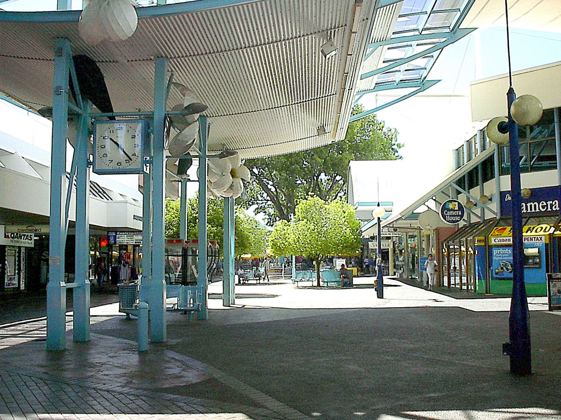
Darwin - Mall