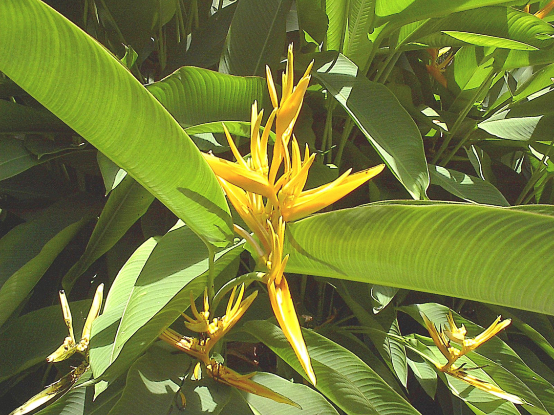
Darwin - Botanischer Garten