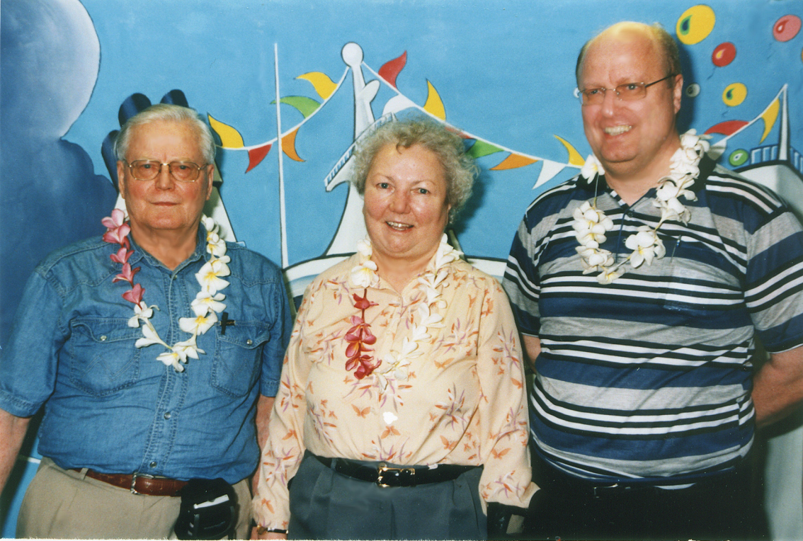
Bali - Begrüßung auf der MS Astor