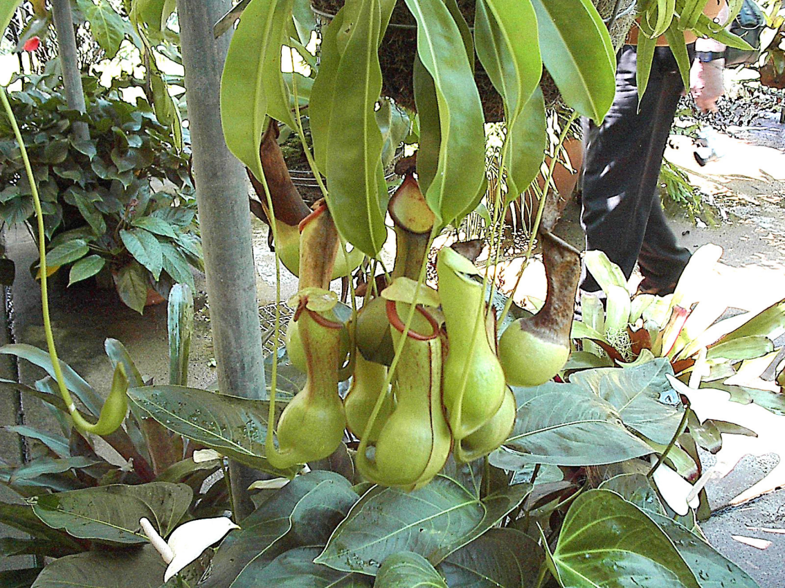
Darwin - Botanischer Garten