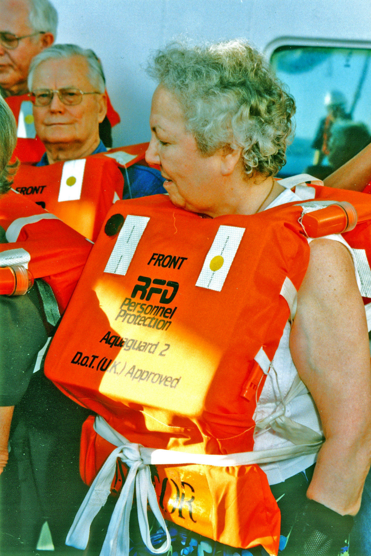
MS Astor, Rettungsübung