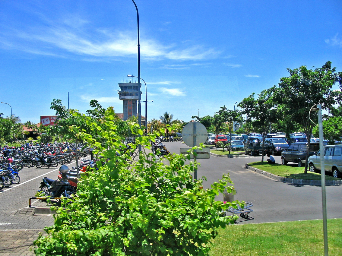
Bali - Benoa