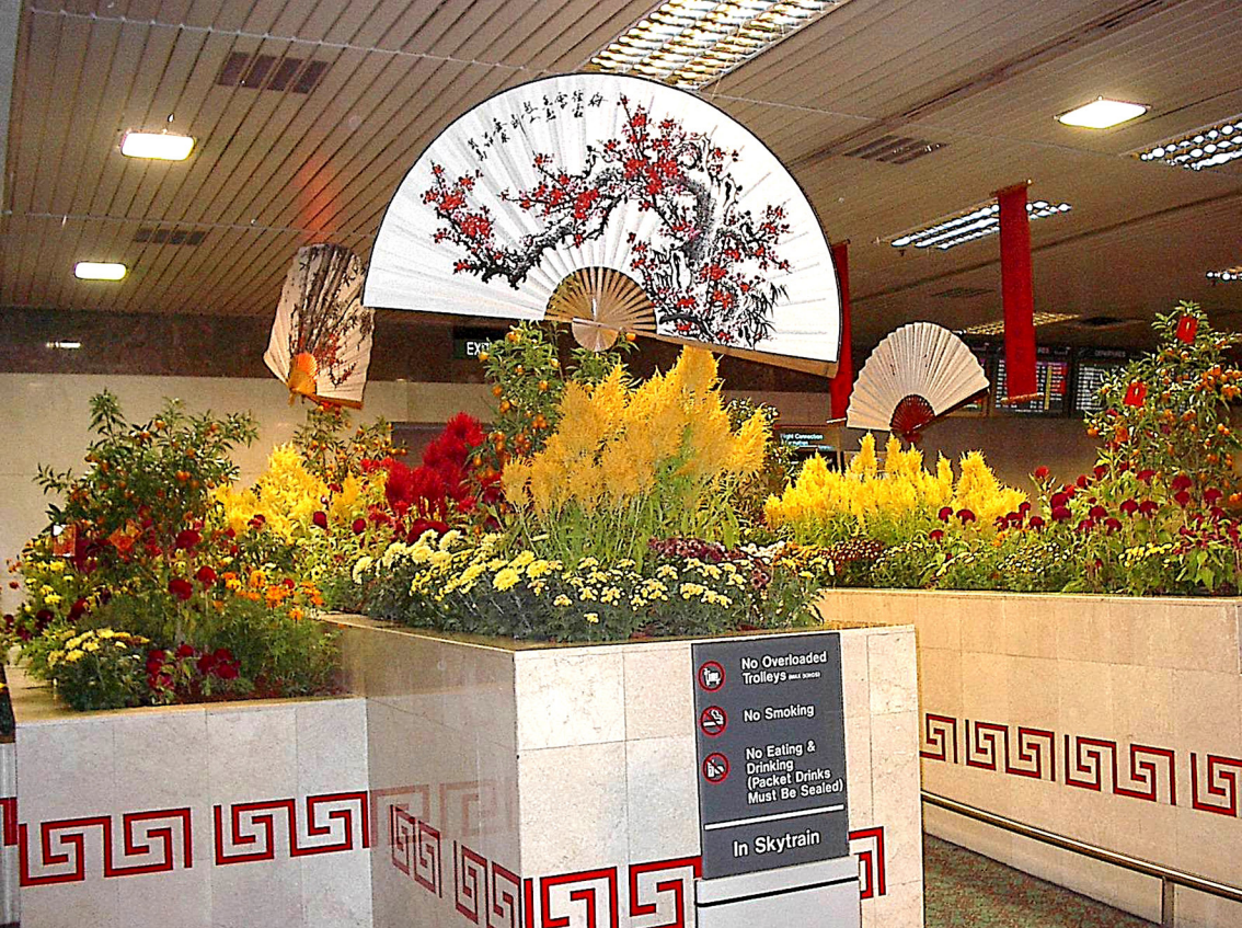
Bali - Flughafen