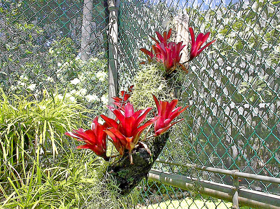
Darwin - Botanischer Garten