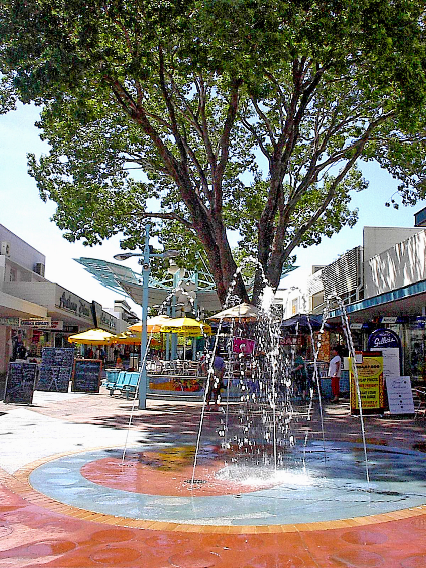
Darwin - Mall