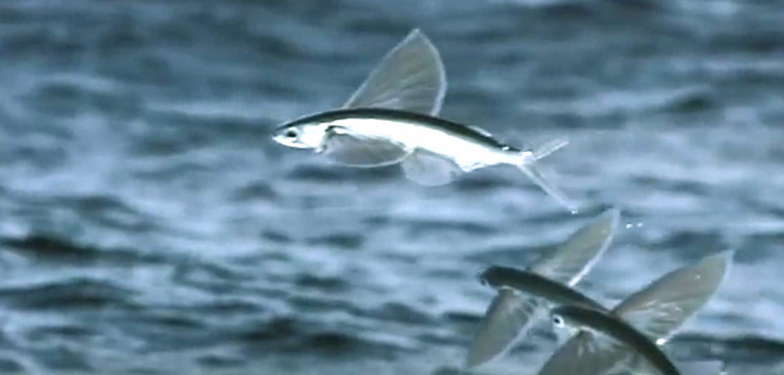
Fliegende Fische (Segler)