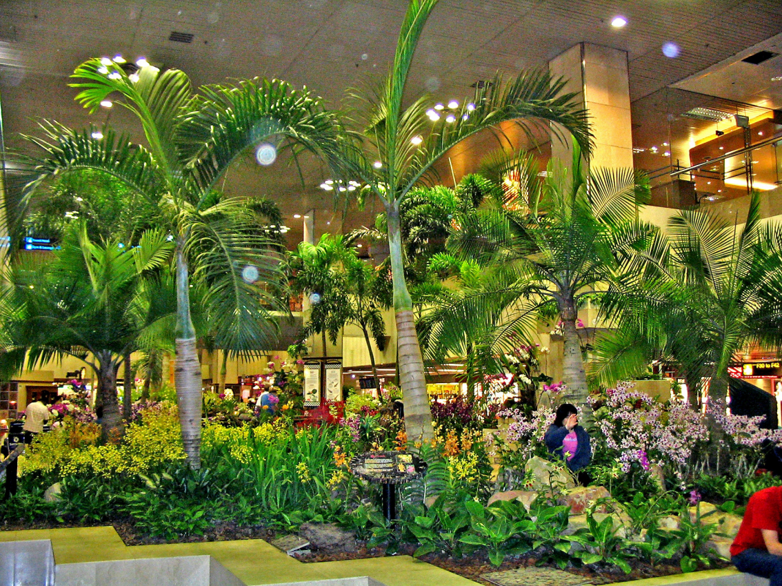
Bali - Bena, Flughafen