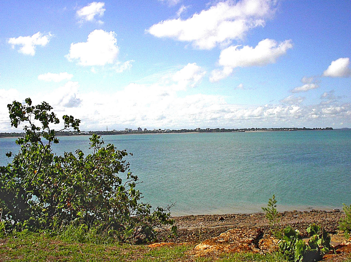
Darwin - Skyline von der Nordküsten-Aussicht