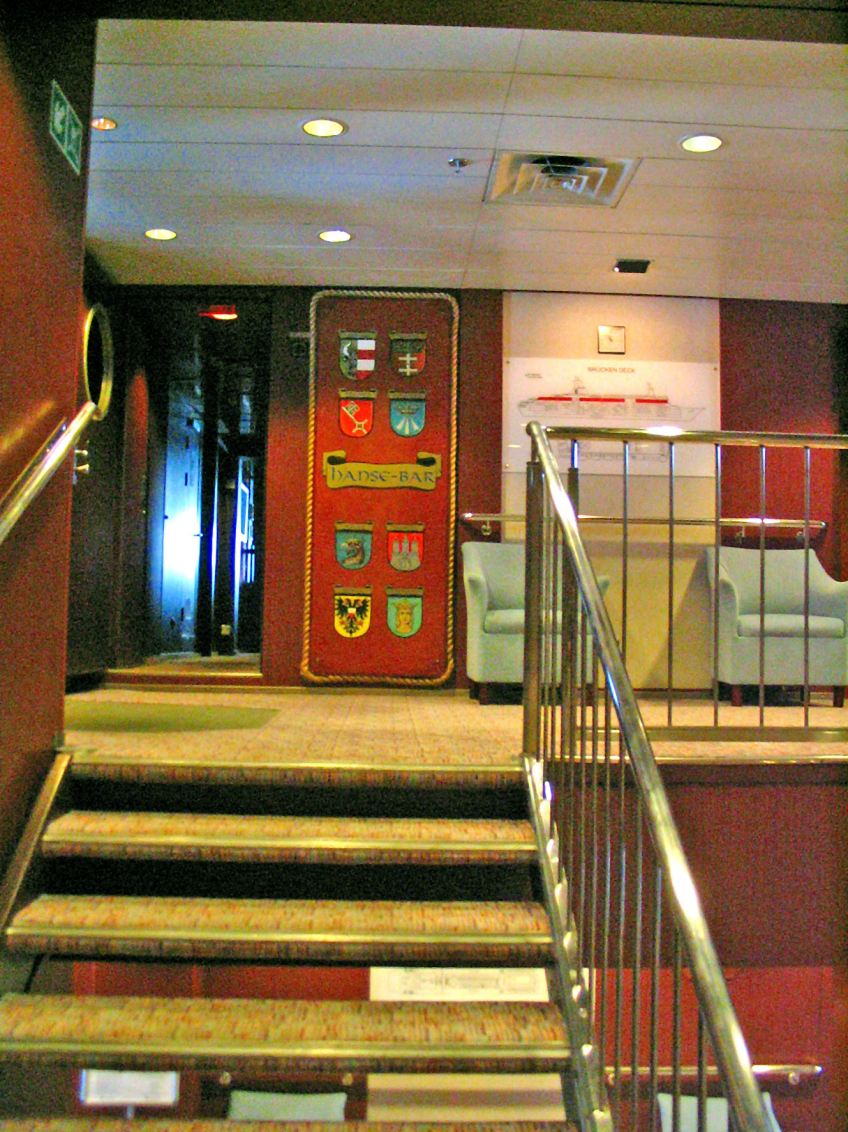
MS Astor, Hanse Bar