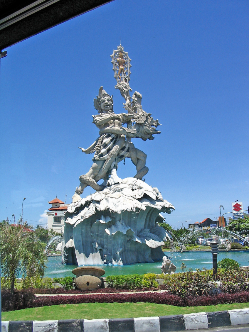
Bali - Bena