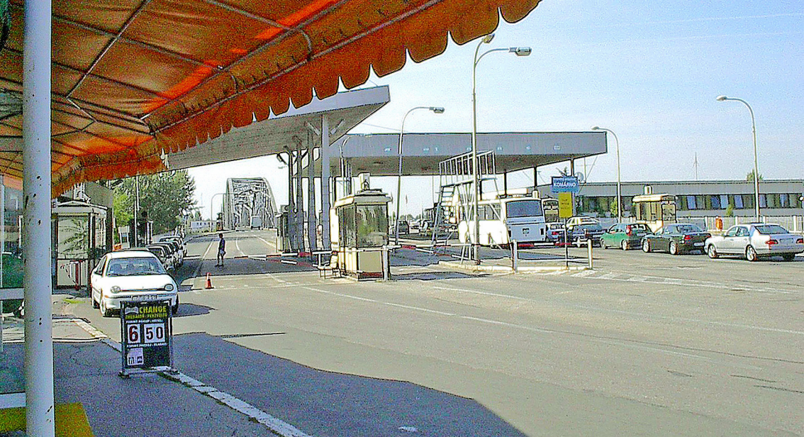
Komarno - Grenze, slowakische Seite