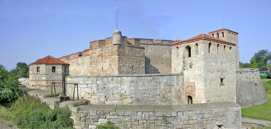
Belgrad - Burg