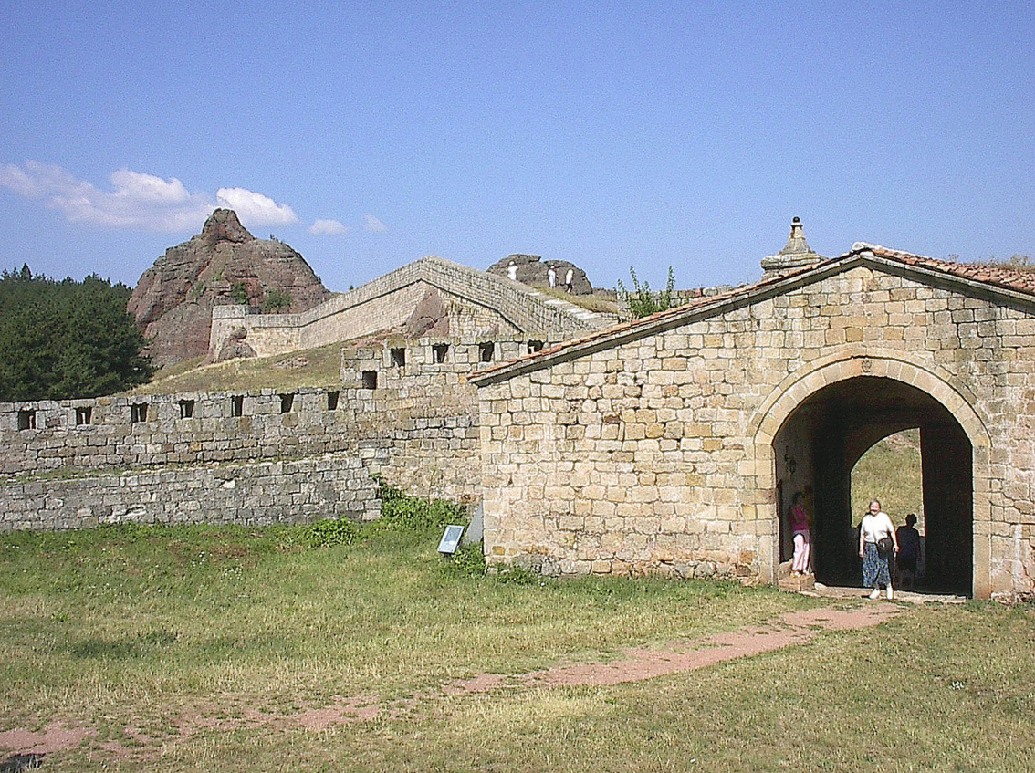
Festung Kaleto bei Belgradschik (Bulgarien)