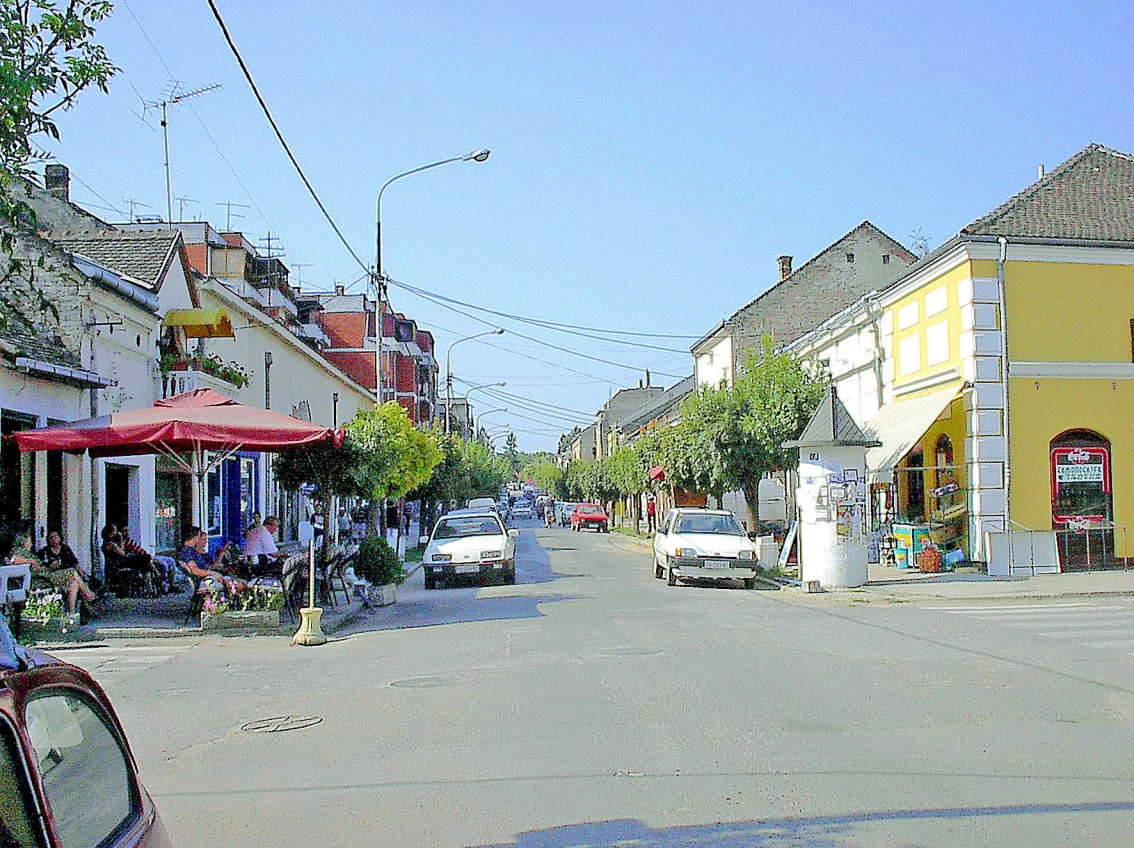
Veliki Gradiste (Serbien)