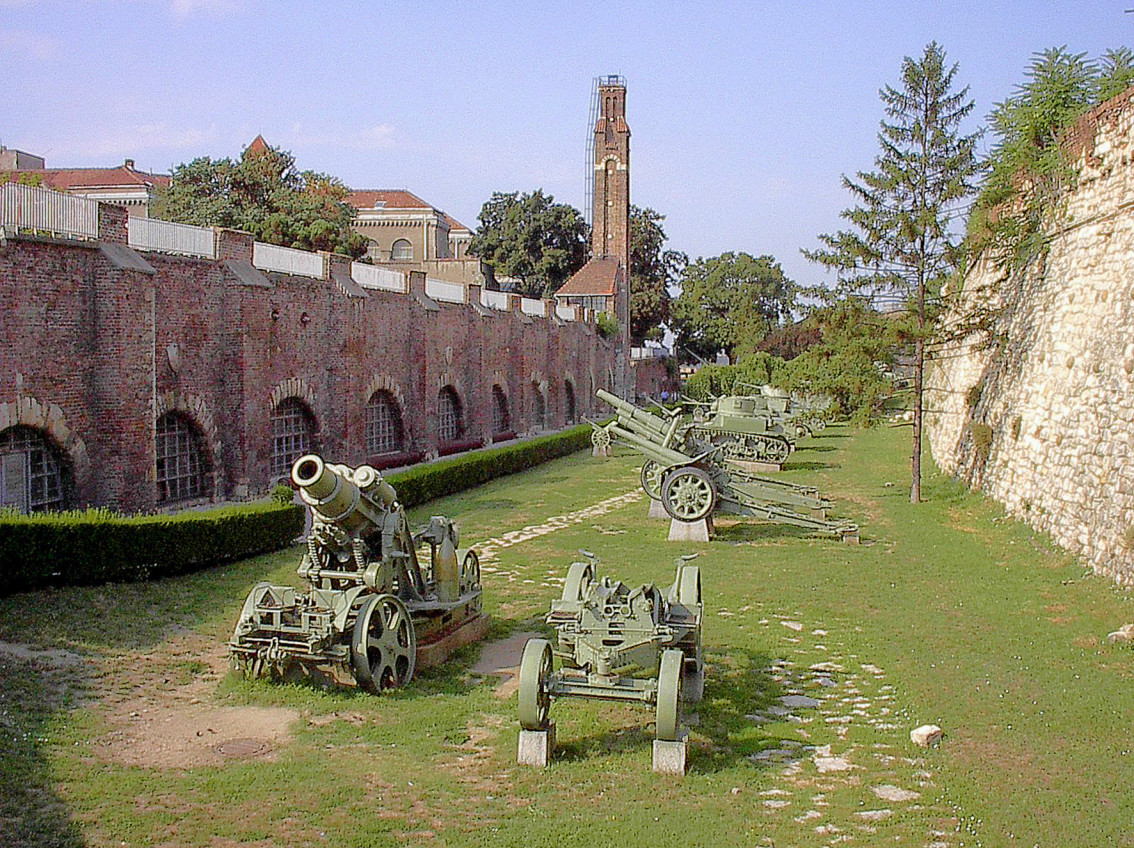
Belgrad - Burg