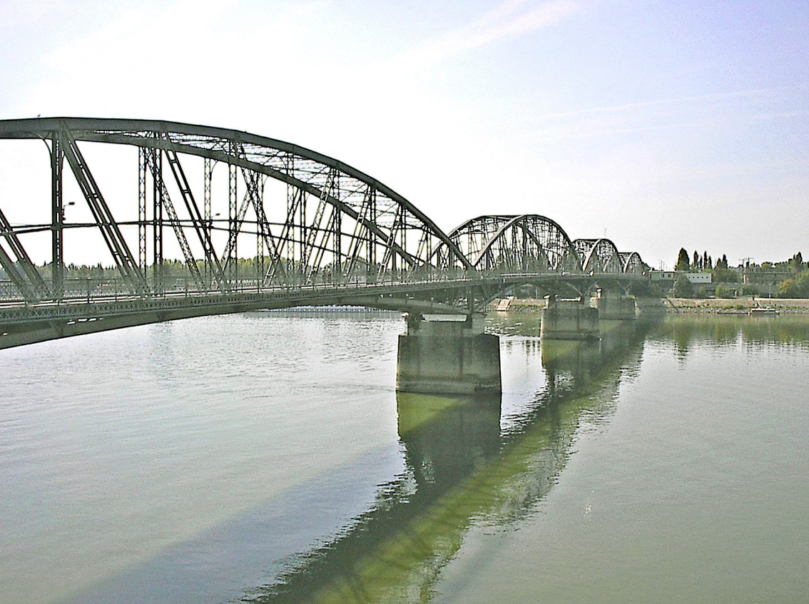
Elisabeth-Brücke - Grenze zwischen Ungarn und Slowakei