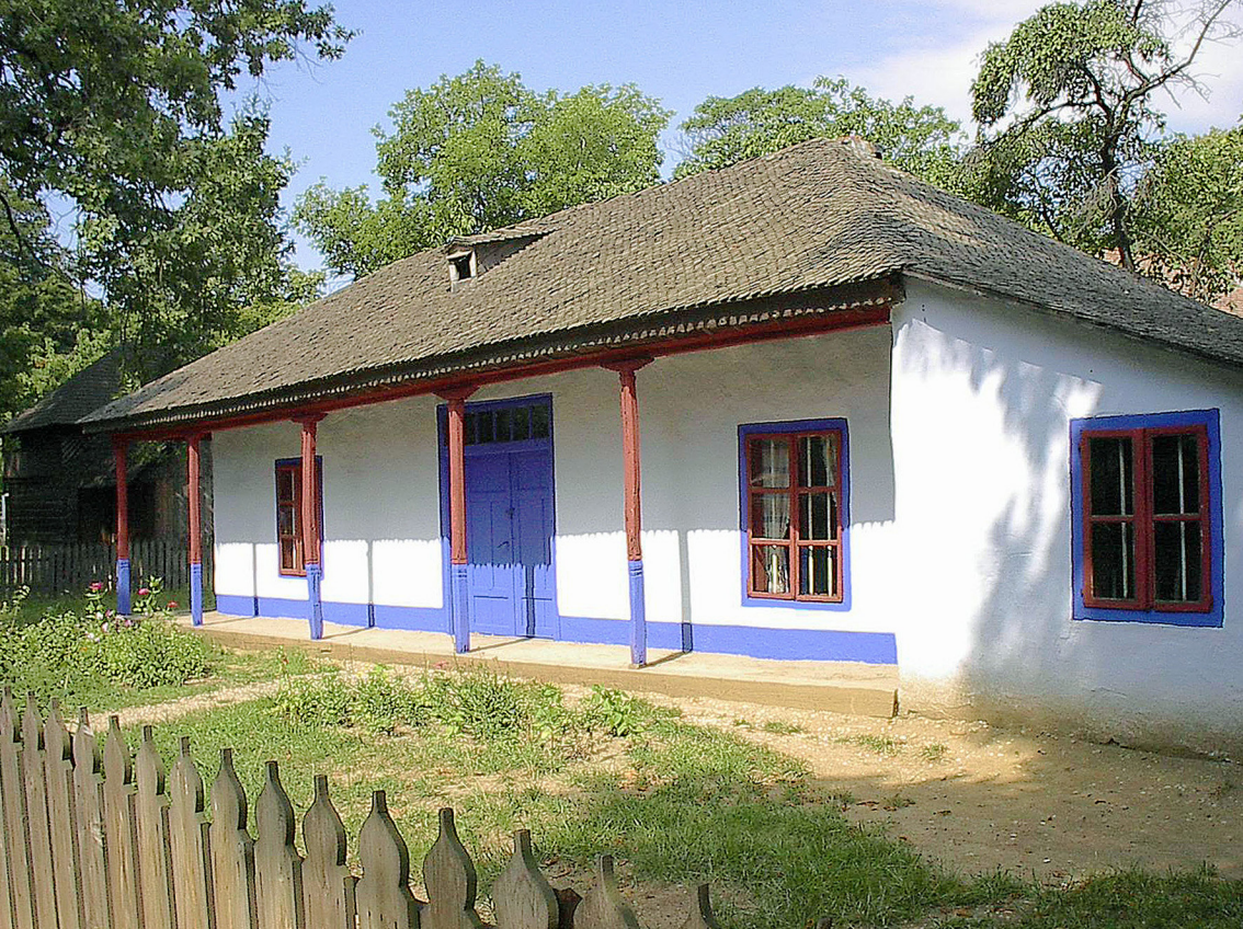
Bukarest - Dorfmuseum