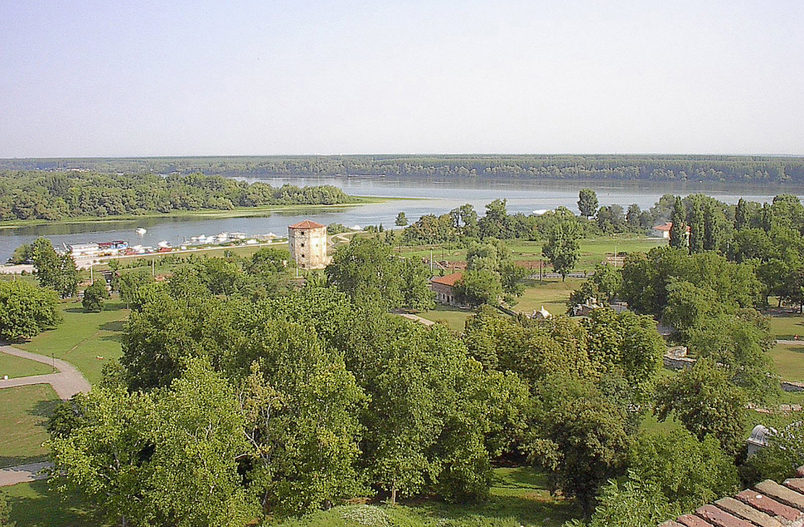
Belgrad - Save-Mündung