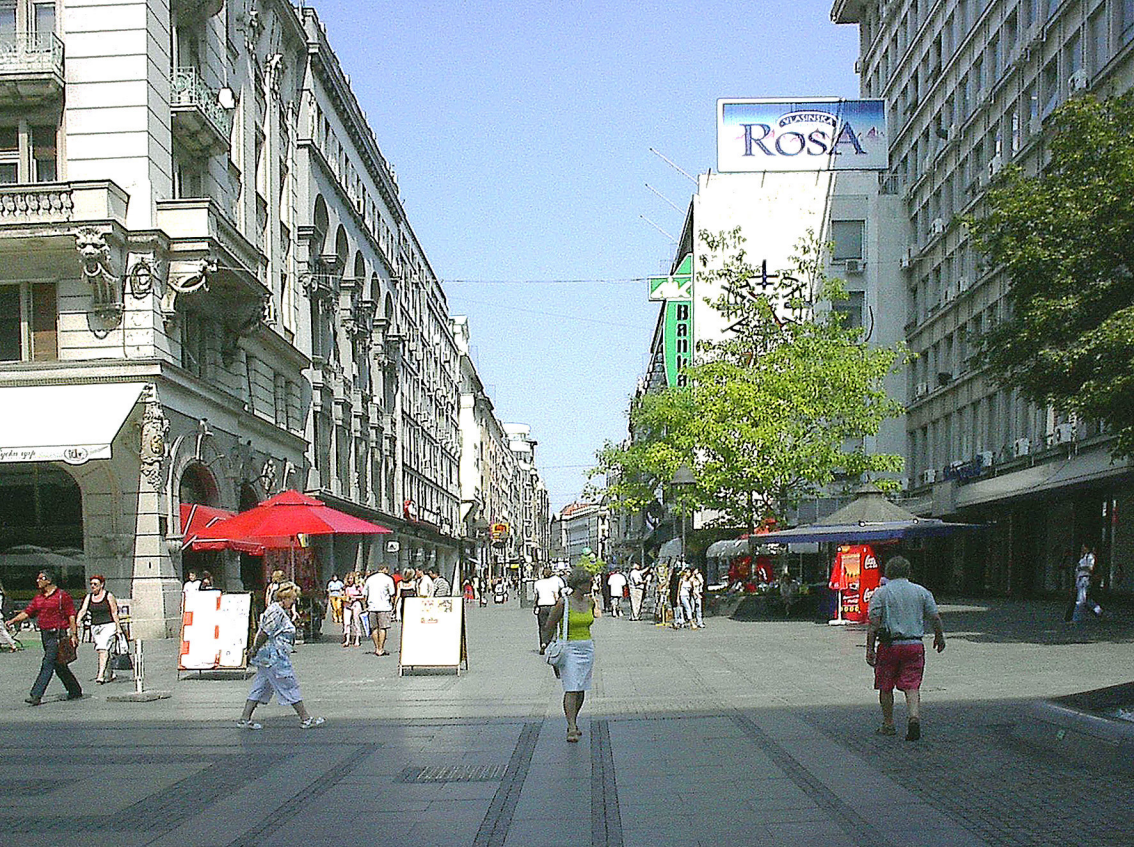
Belgrad - Fußgängerzone