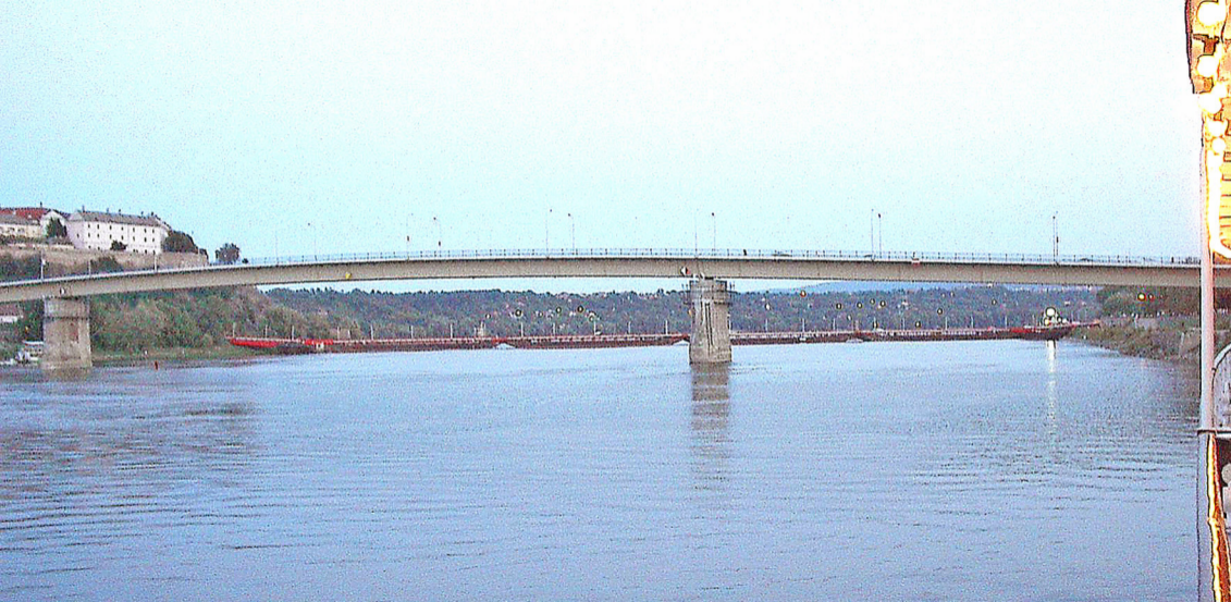
Novi Sad - Brücke und Pontonbrücke über die Donau