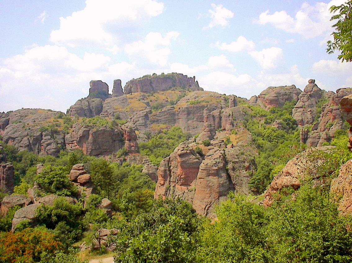
Rote Felsen bei Belgradschik (Bulgarien)