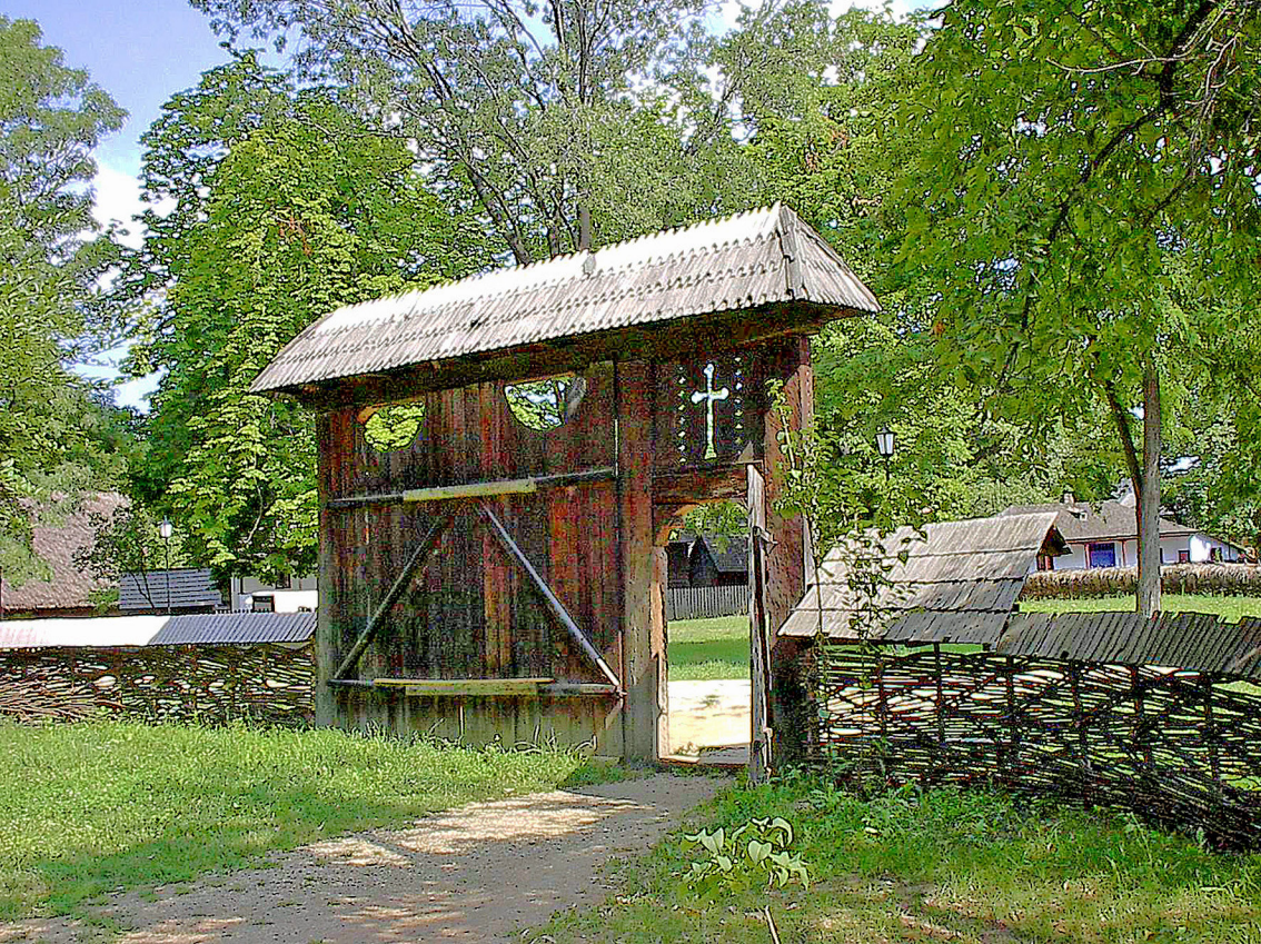
Bukarest - Dorfmuseum