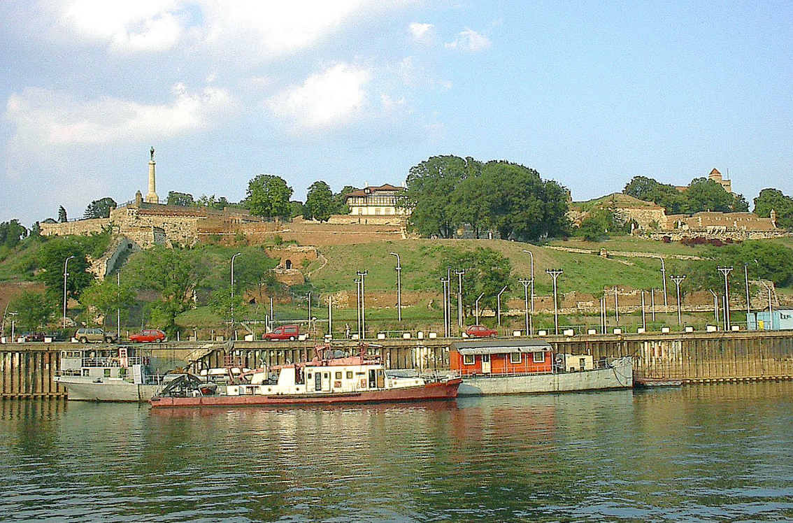
Belgrad - Einfahrt