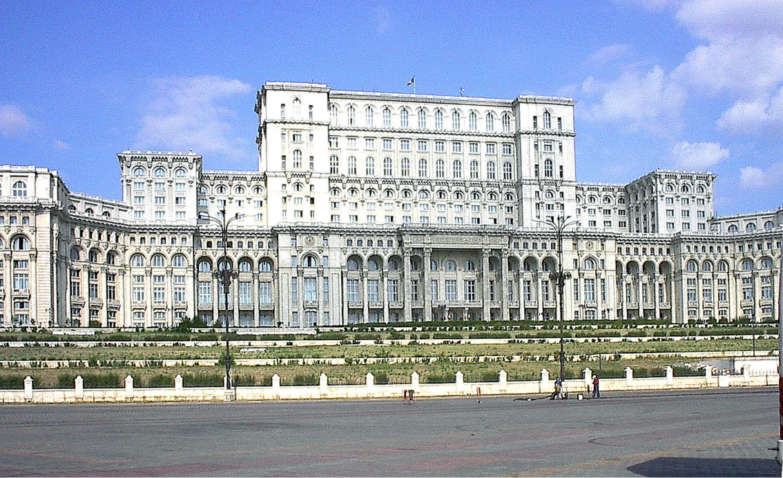
Bukarest - Palast