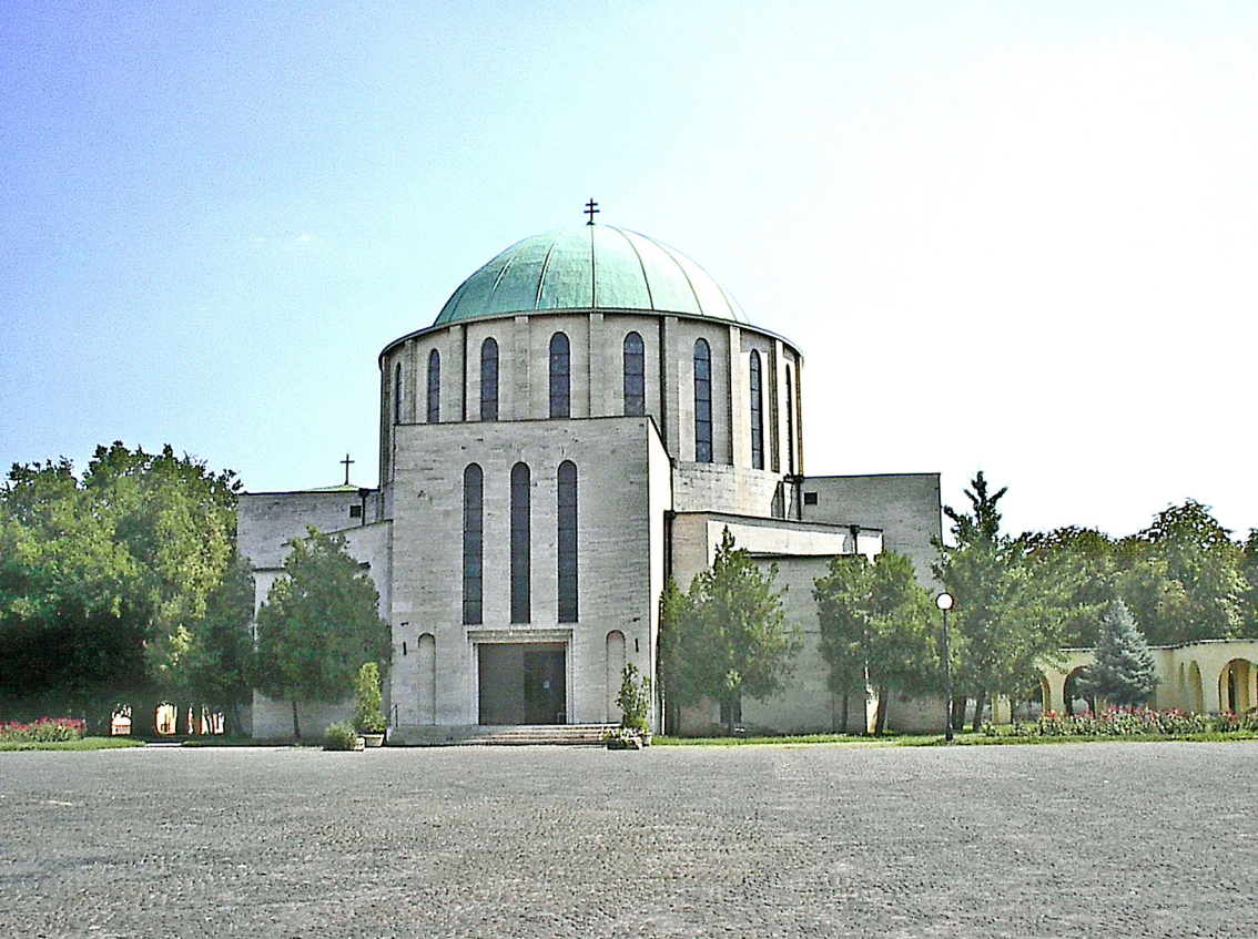
Mohacs - Votiv-Kirche, 1526 Sieg der Osmanen, 1687 Sieg Österreichs