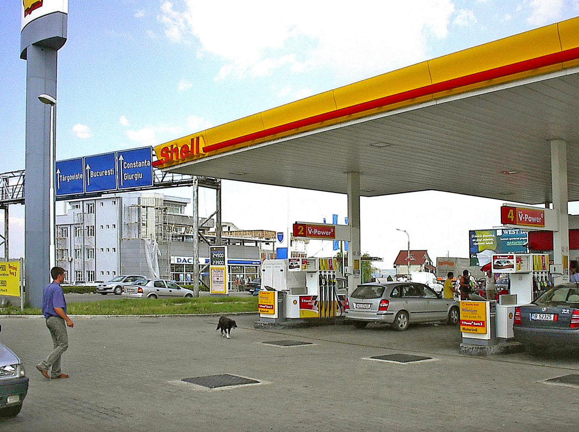
Bukarest - Tankstelle im Nordwesten