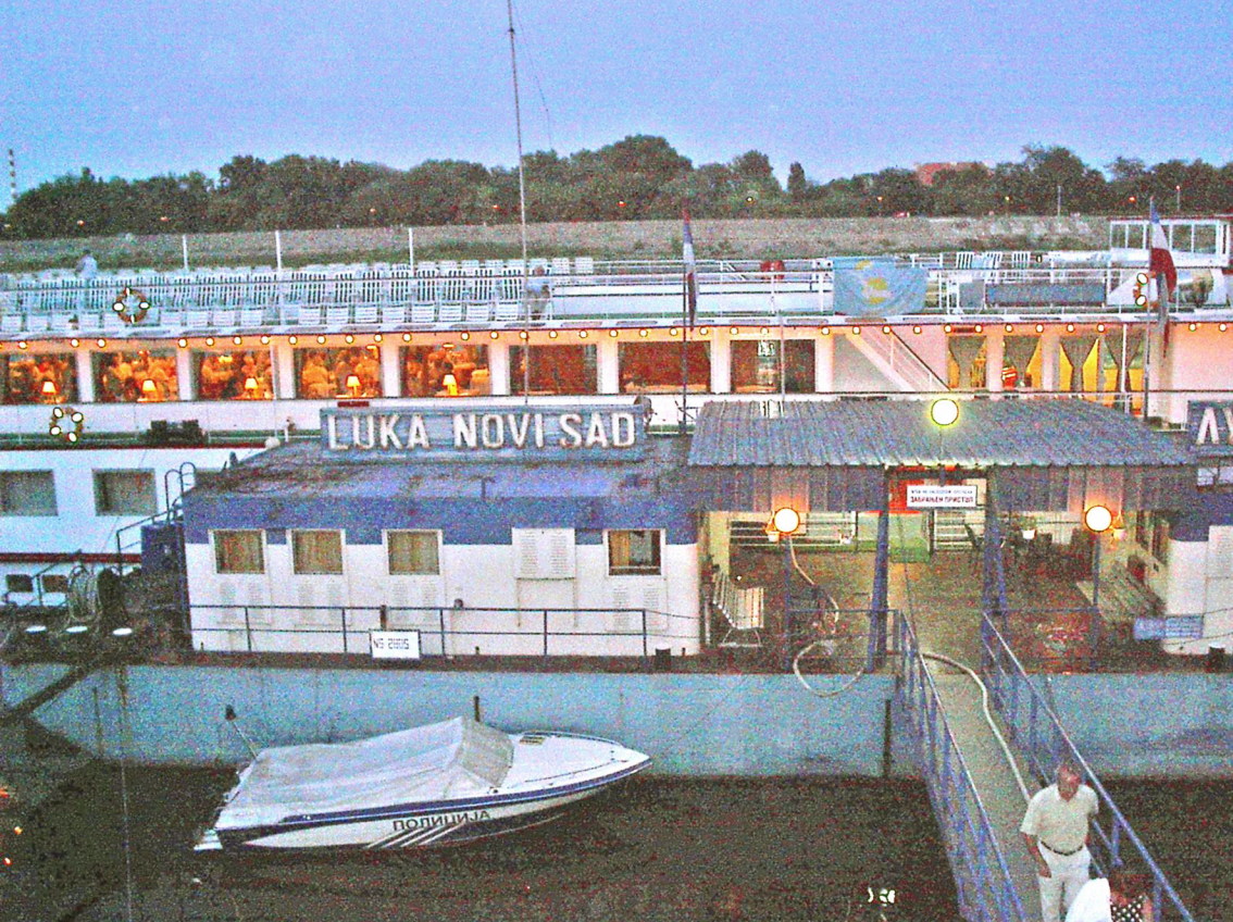
Anlegestelle in Novi Sad