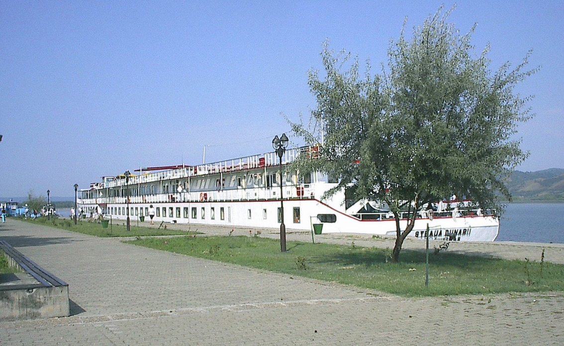
unser Schiff in Veliki Gradiste (Serbien)