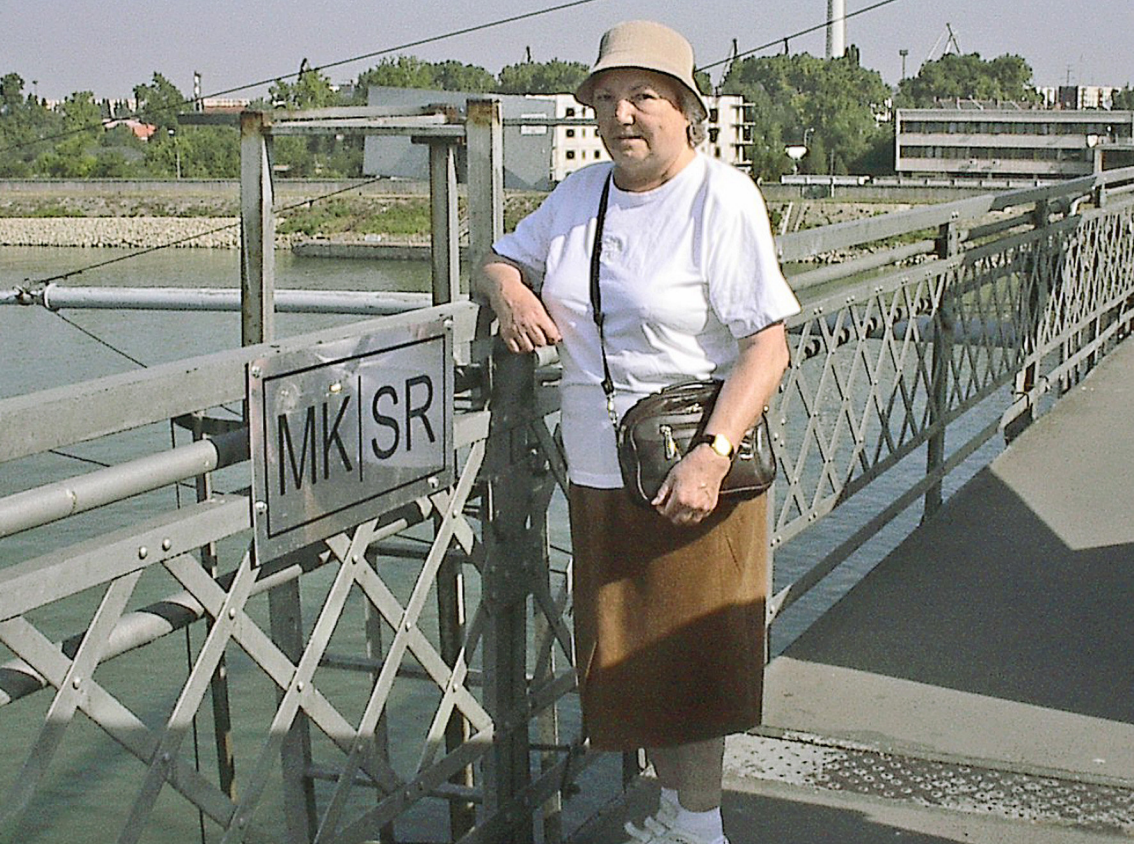
genau auf der Grenze Ungarn/Slowakei (MK/SR)