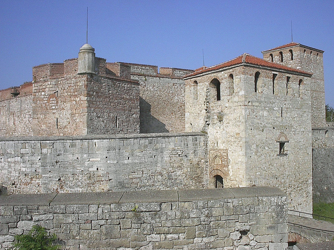
Festung Baba Vida (Bulgarien)