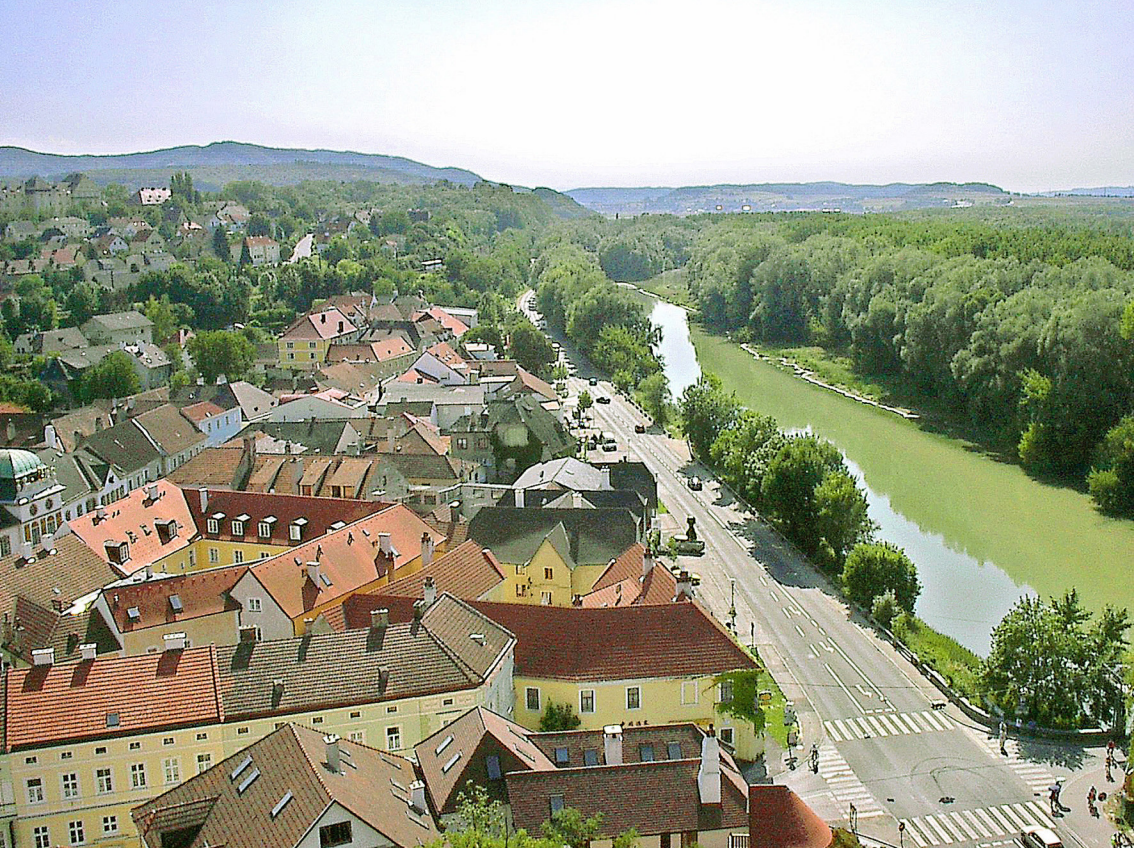
Die Donau vom Stift Melk aus gesehen