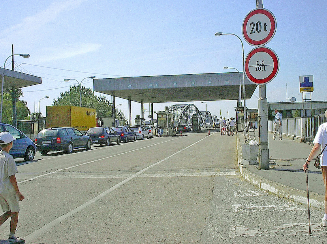
Komárom - Grenze, ungarische Seite