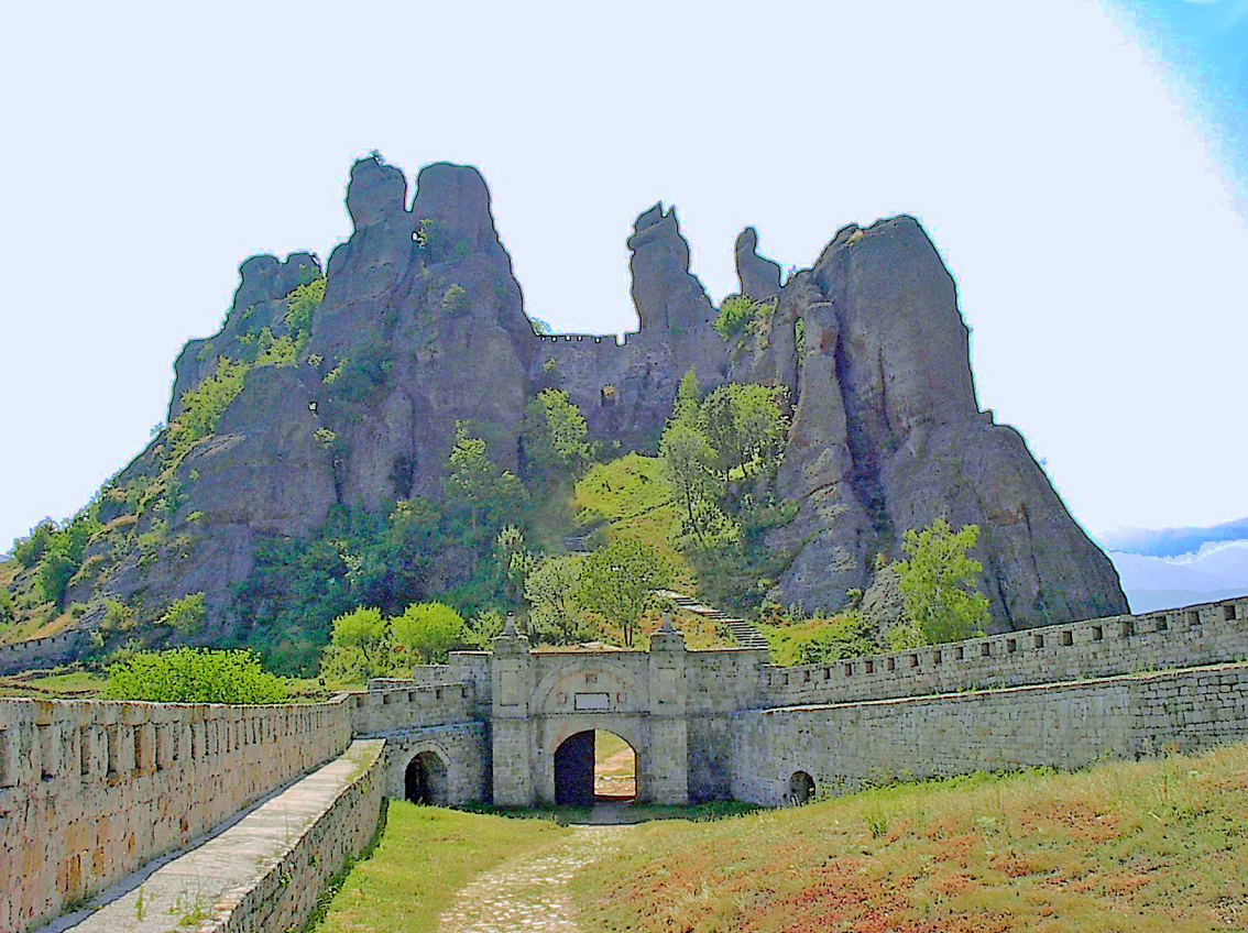
Festung Kaleto bei Belgradschik (Bulgarien)