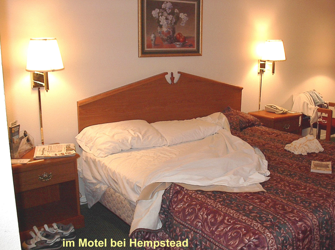
im Motel bei Hempstead