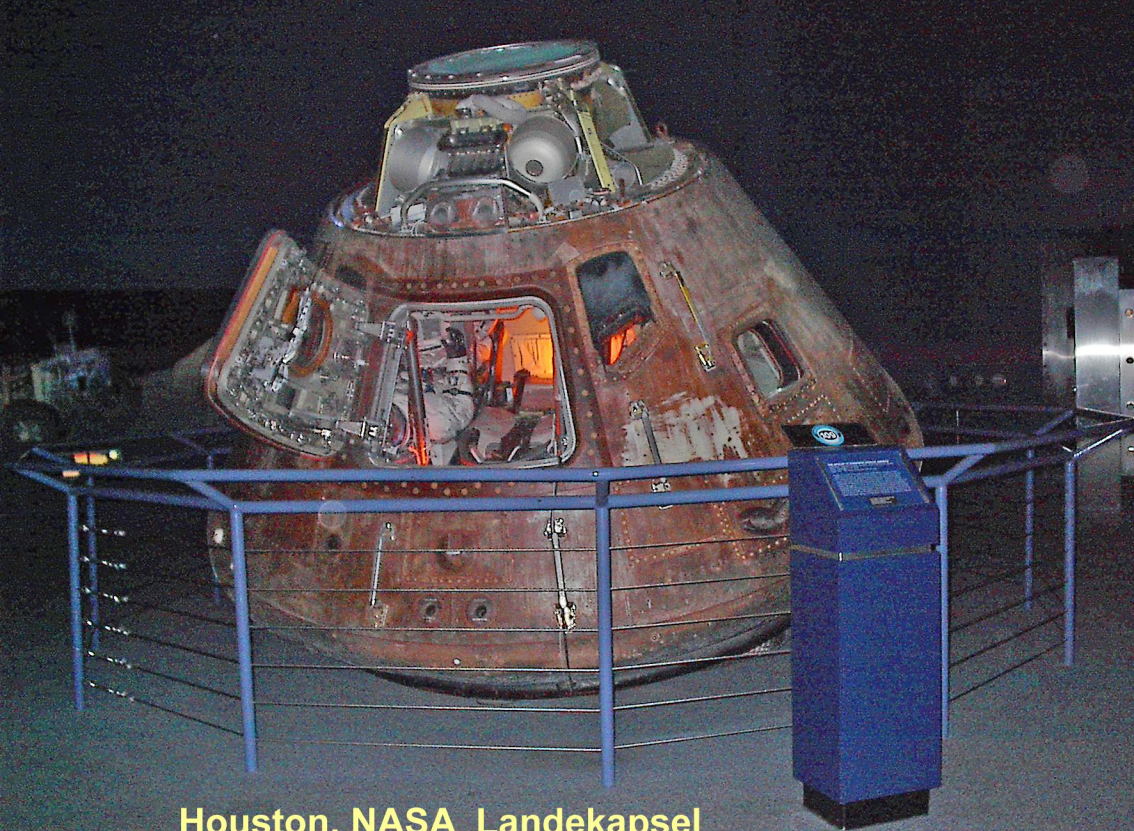
Houston, NASA Landekapsel