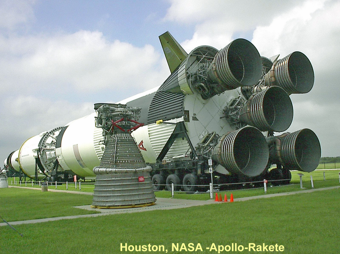
Houston, NASA -Apollo-Rakete