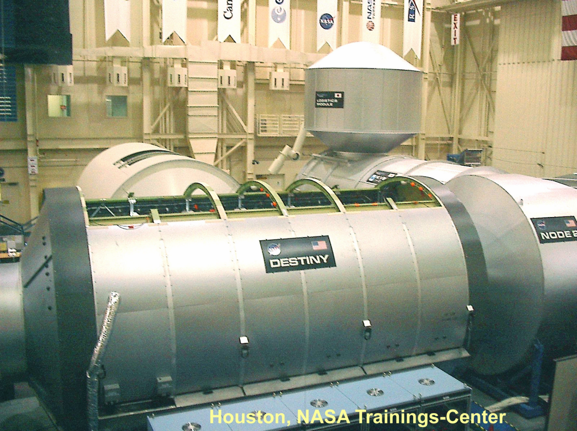
Houston, NASA Trainings-Center