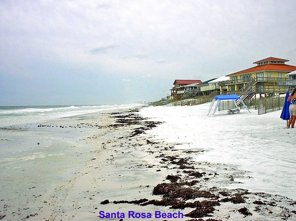
Santa Rosa Beach