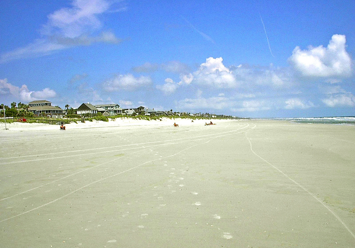
Strand bei Jacksonville