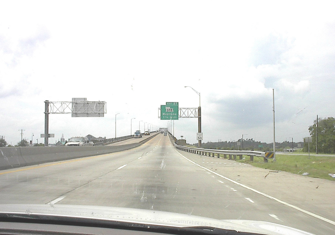
I-10 viele Brücken westlich von New Orleans