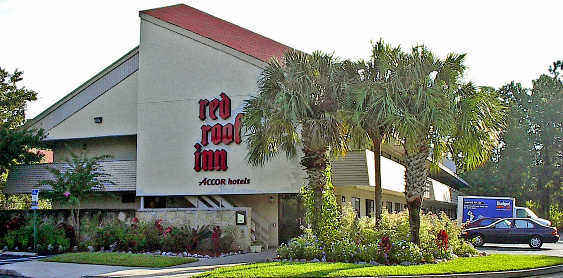
Jacksonville: Hotel beim Flughafen