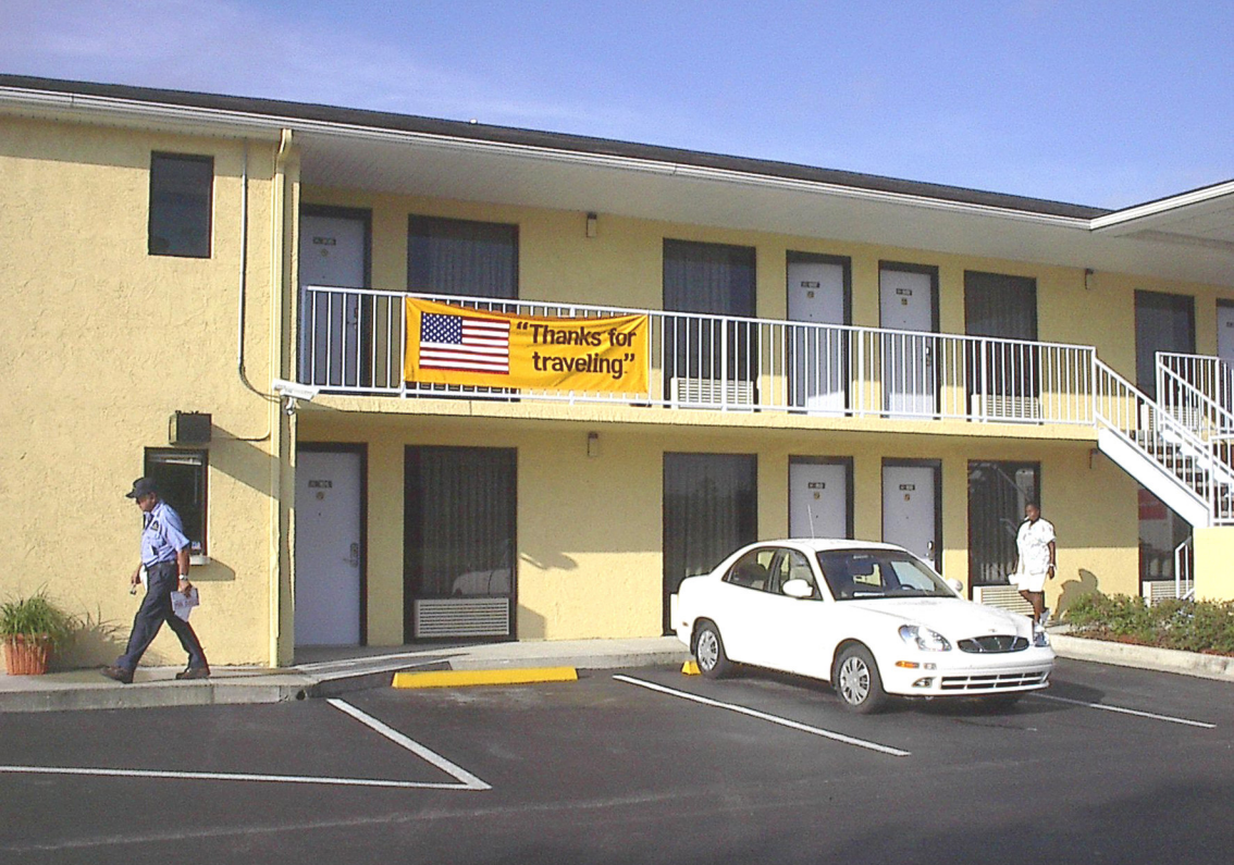
Live Oak: Best Western Motel