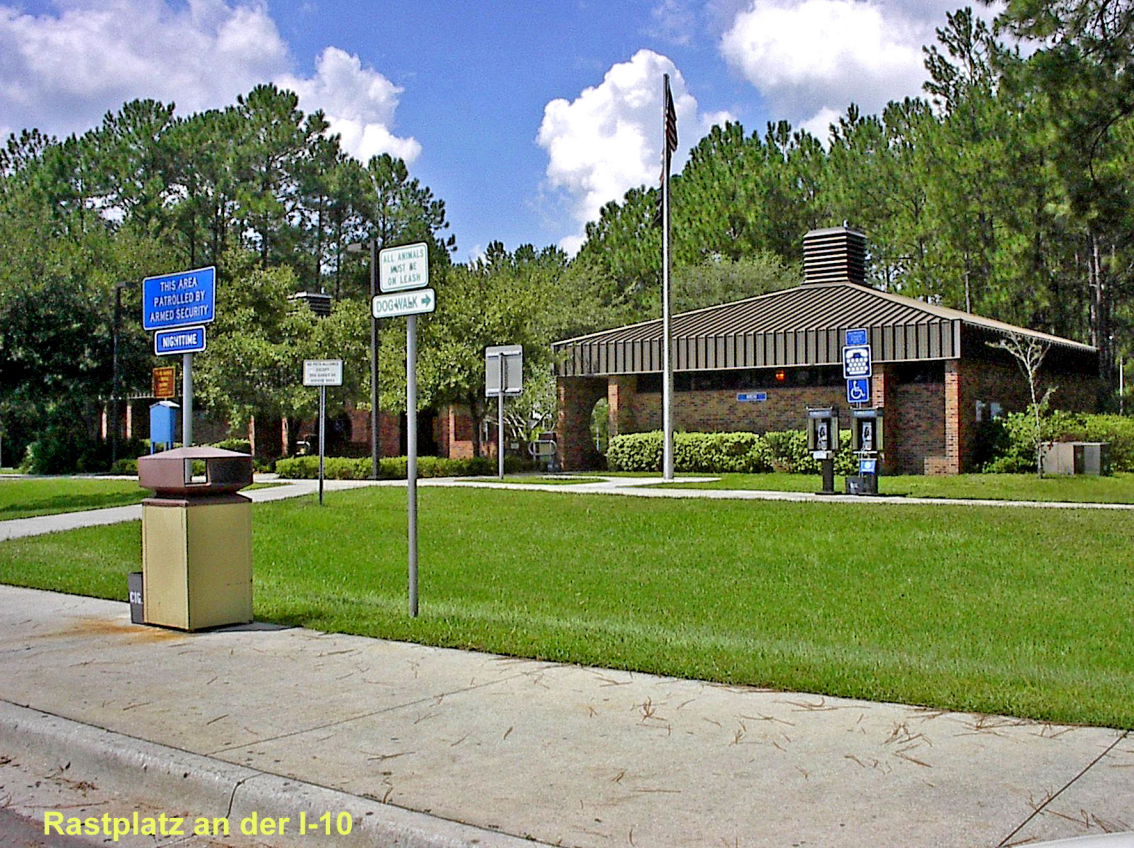
Rastplatz an der I-10