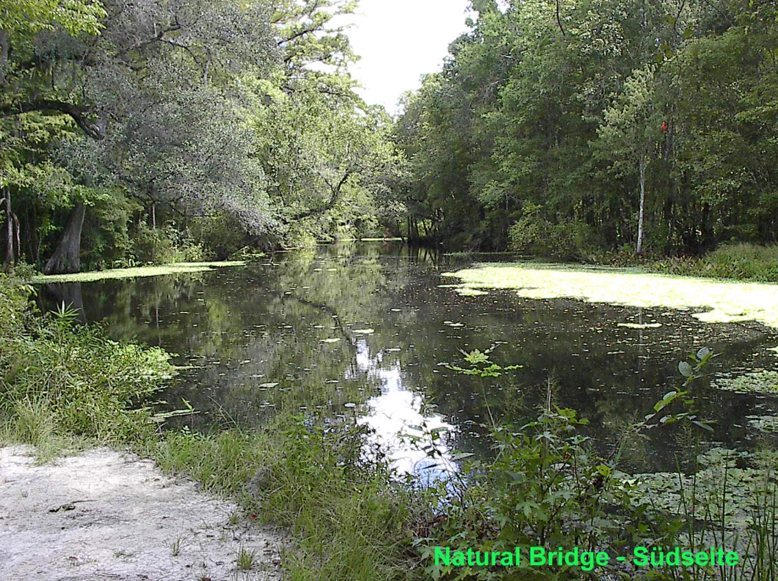
Natural Bridge - Südseite