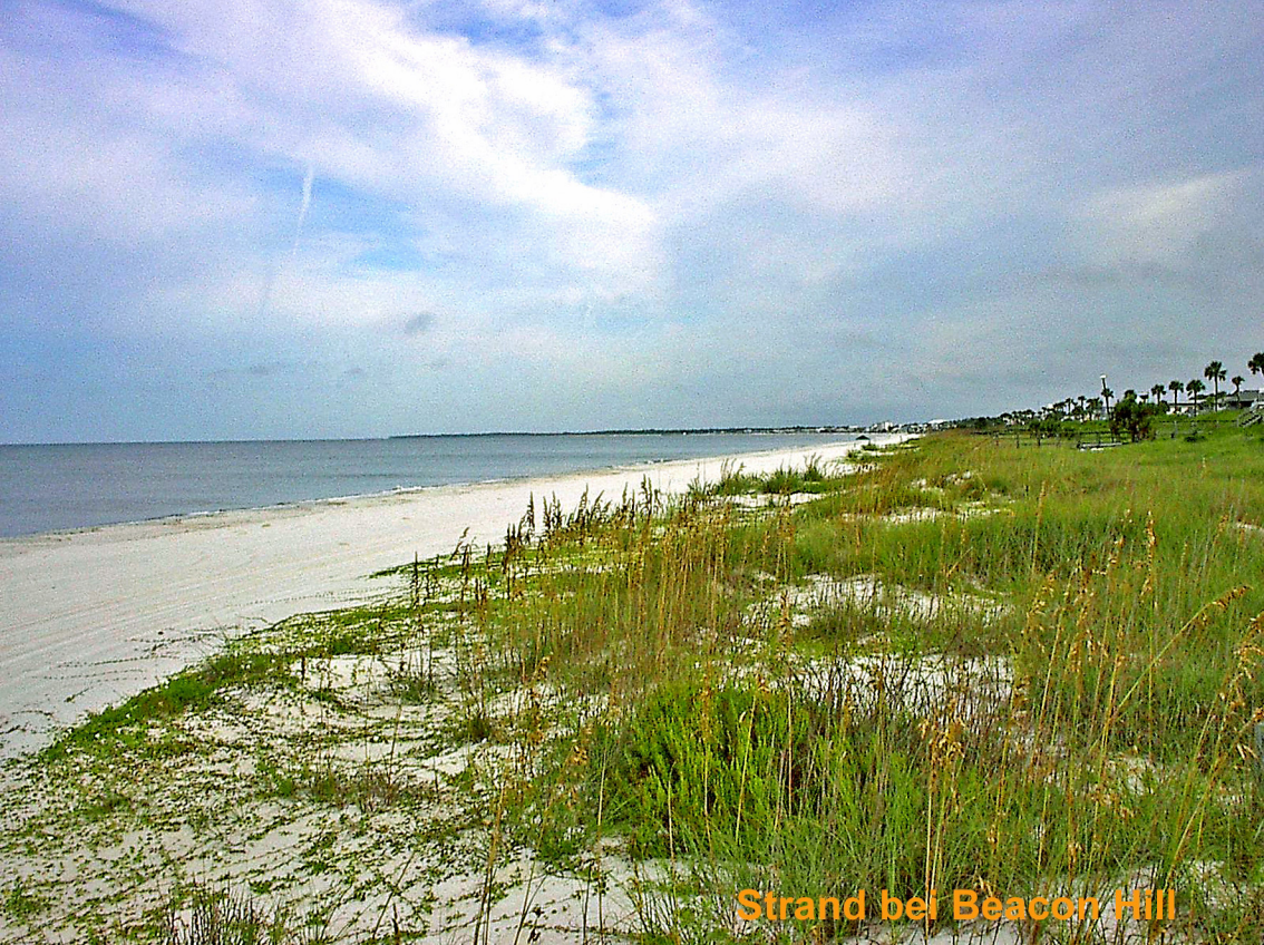
Strand bei Beacon Hill