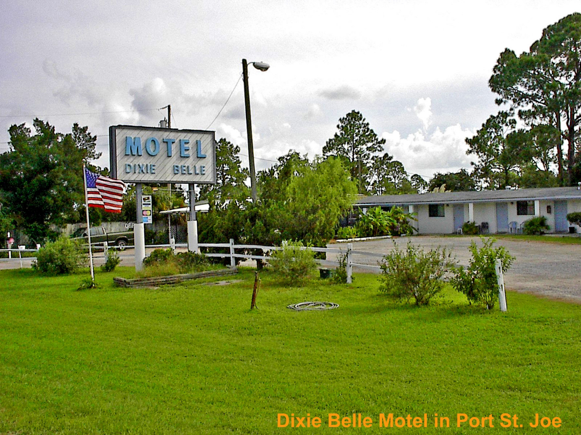
Dixie Belle Motel in Port St. Joe