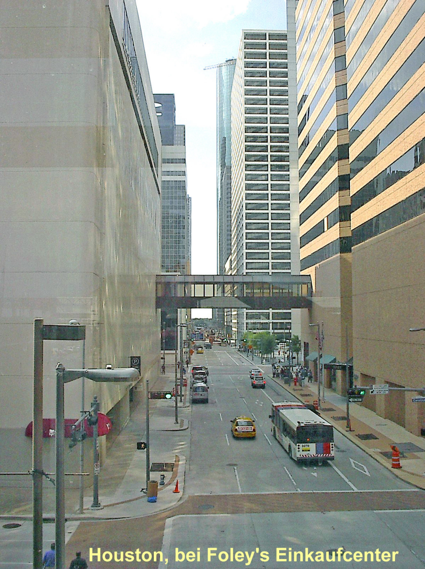
Houston, bei Foley's Einkaufcenter