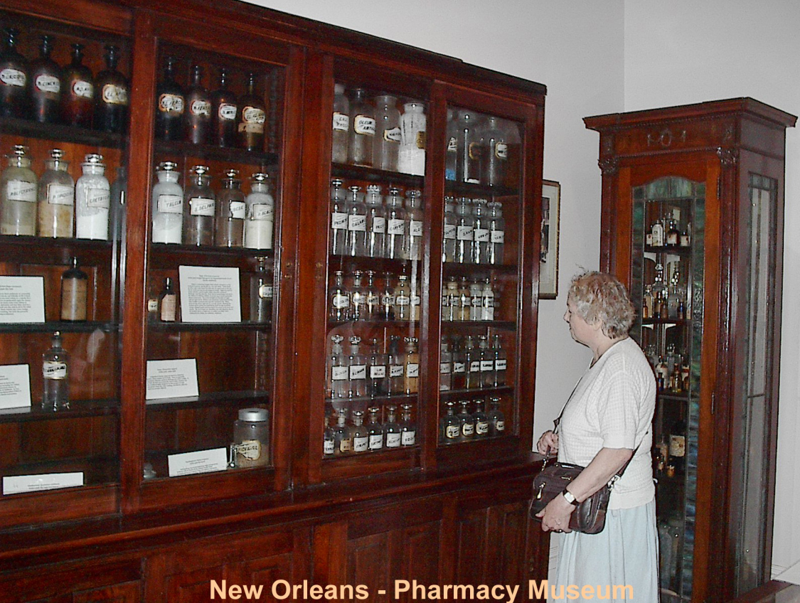
New Orleans - Pharmacy Museum