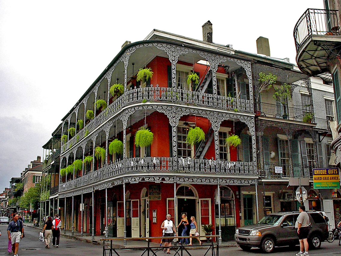
New Orleans - French Quarter