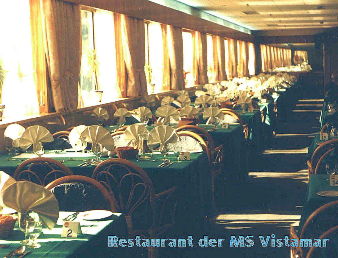
Restaurant der MS Vistamar