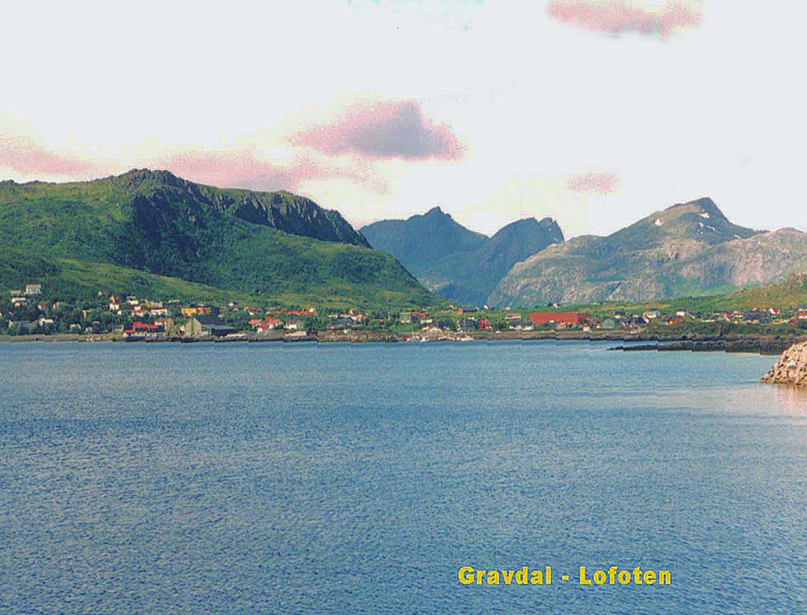
Gravdal - Lofoten