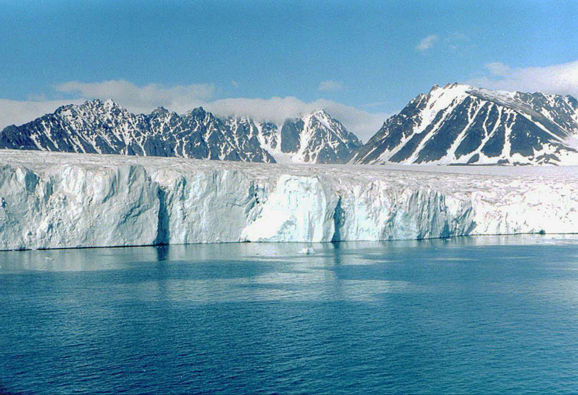
Gletscher im Liliehoekfjord