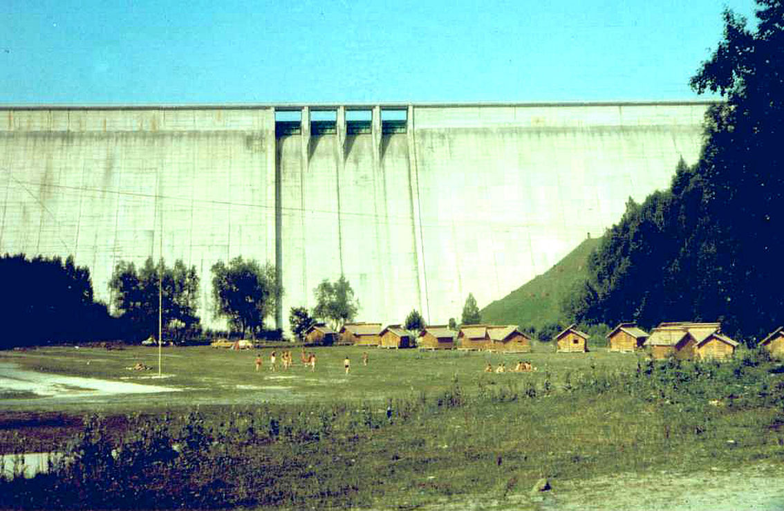
Staumauer am Izvorul Muntelui