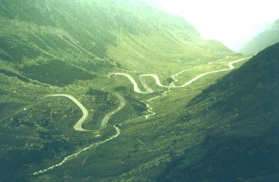
Transfagarasch-Nordseite von oben