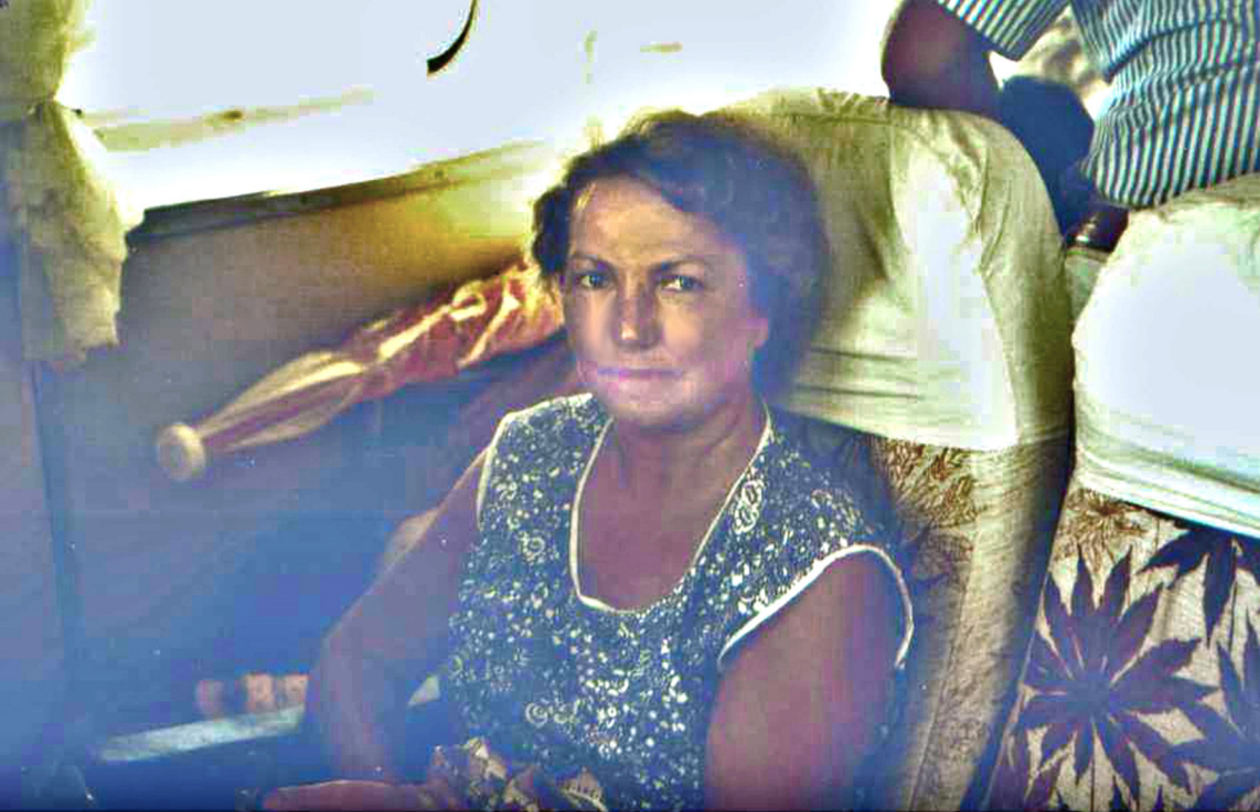
Fahrt mit dem Tragflächenboot Rapida