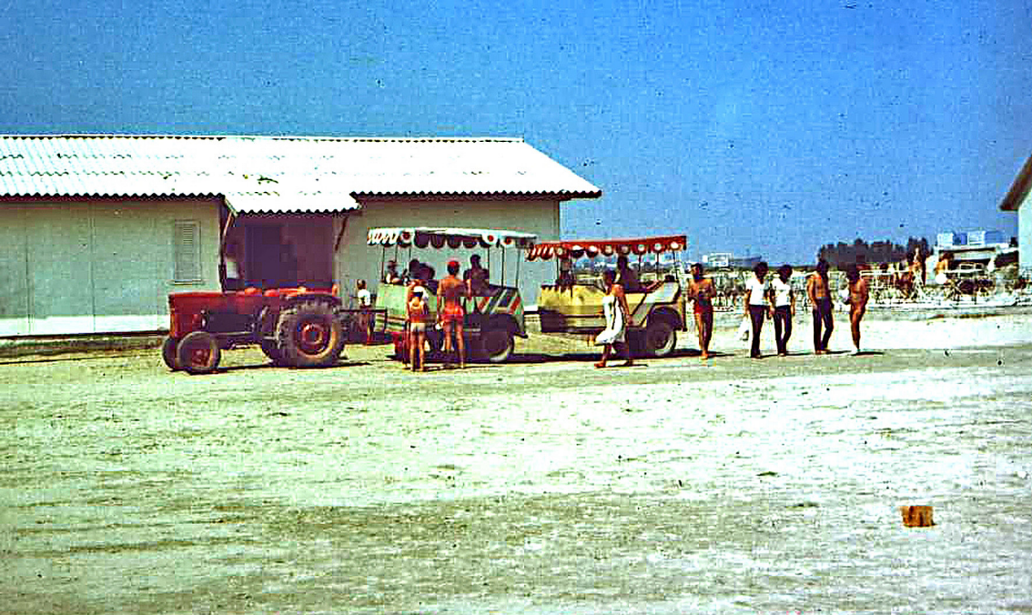
Haltestelle des Strandmobils in Sulina