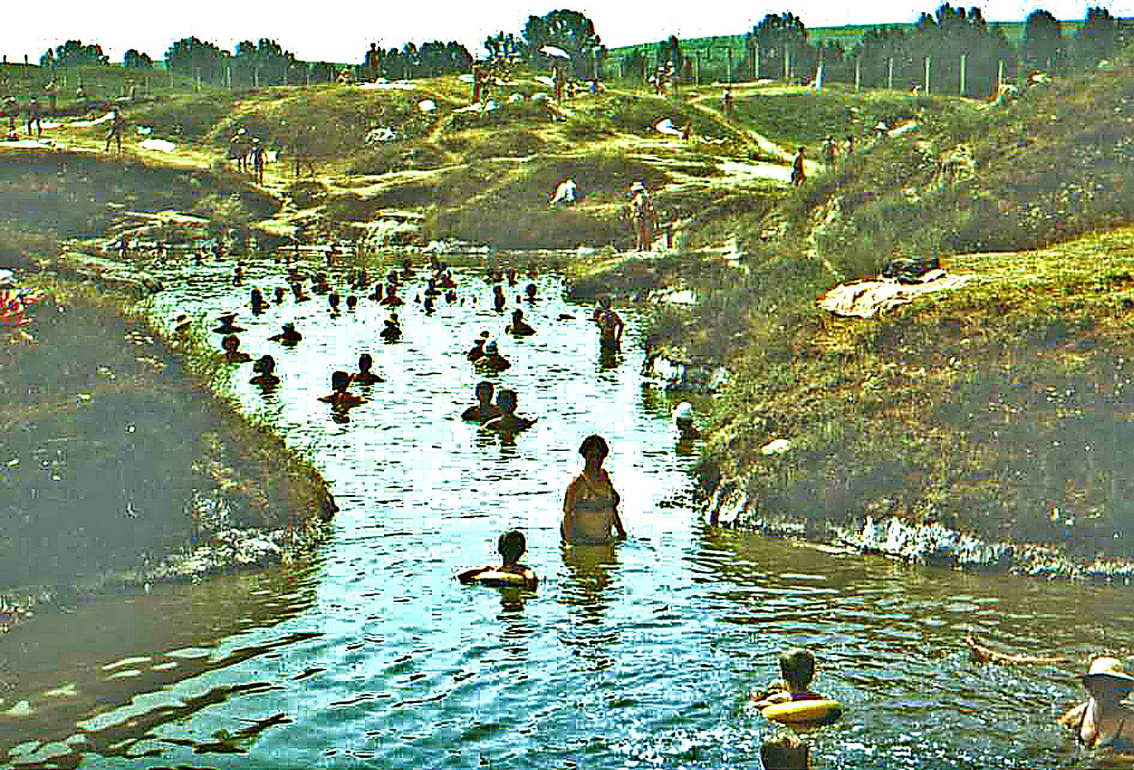
Salzsee bei Ocna Sibiului