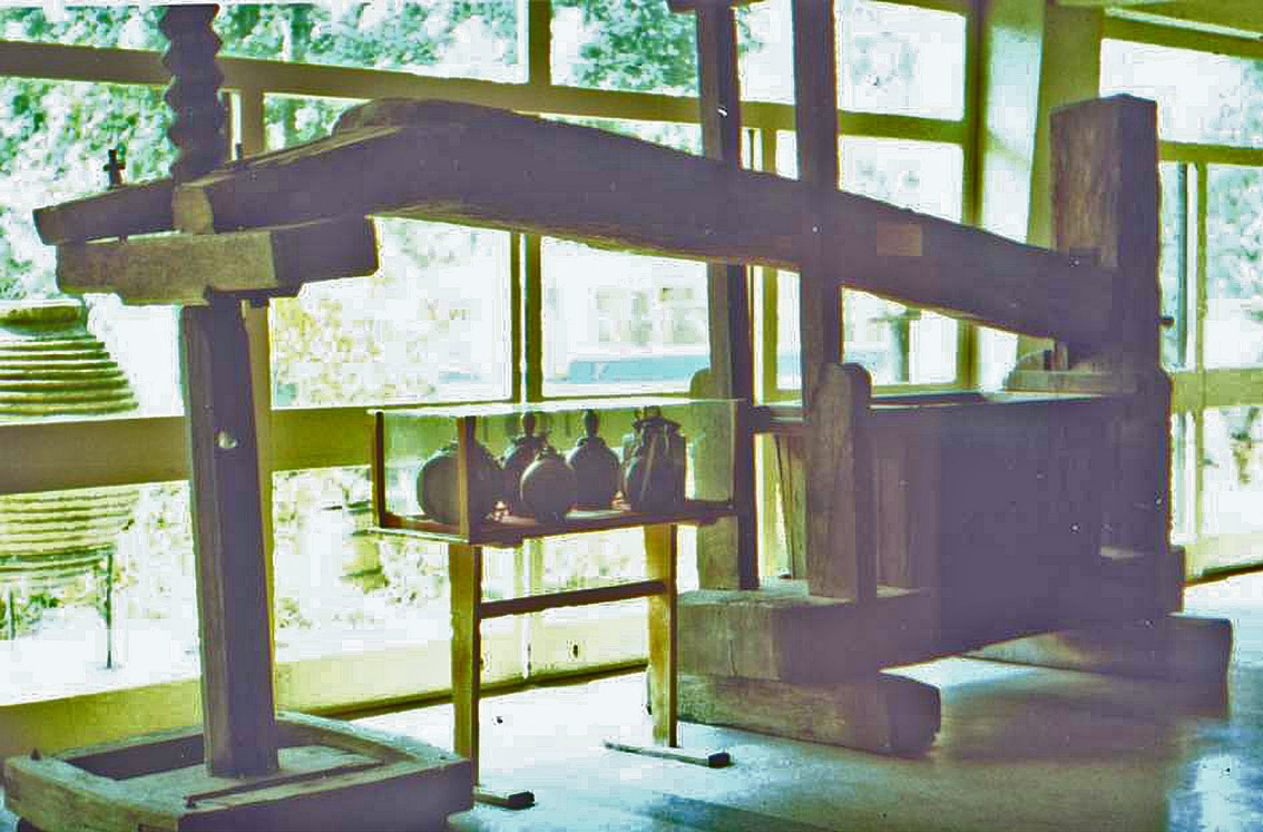
Traubenpresse in Murfatlar