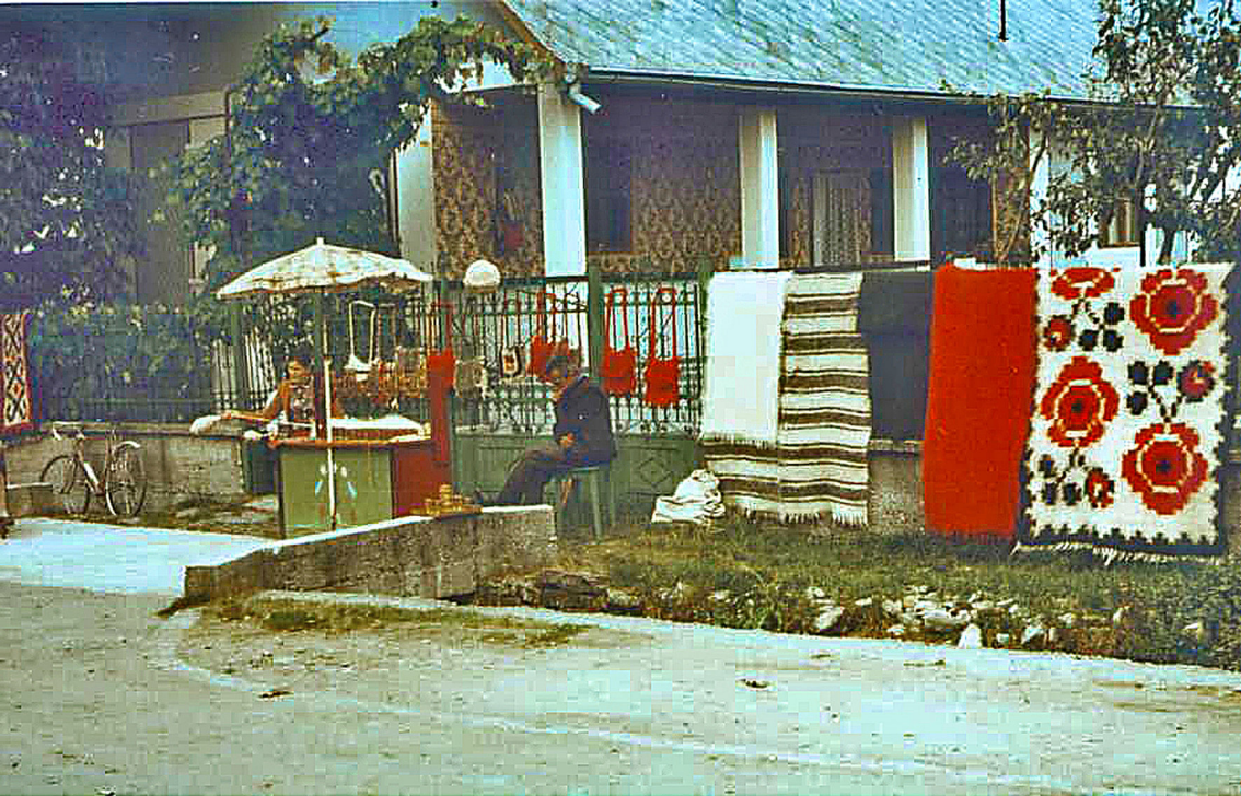
Dorfstraße in Sapinta