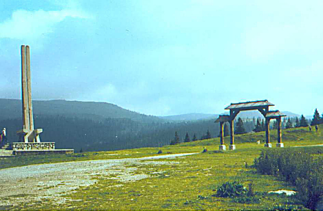
Ehrenmal für die Gefallenen des 1. Weltkrieges