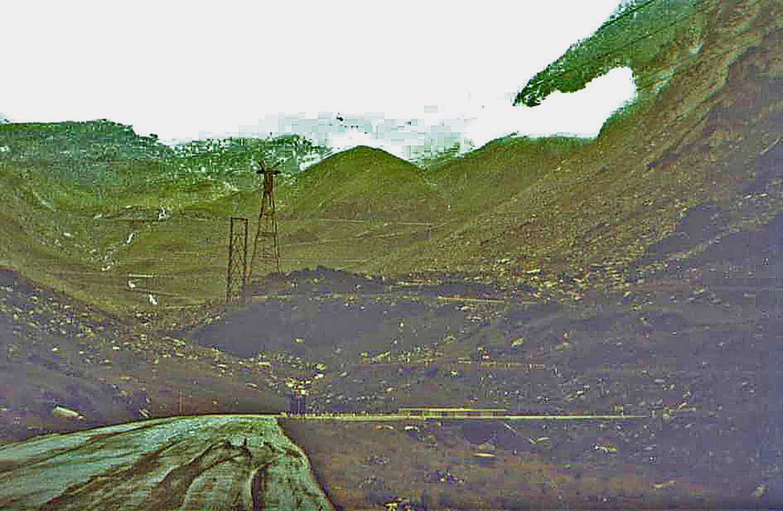
Transfagarasch-Nordseite von unten