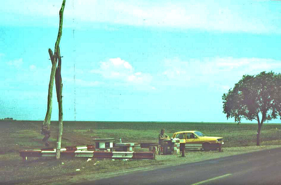
Parkplatz zwischen Ploiesti und Urziceni