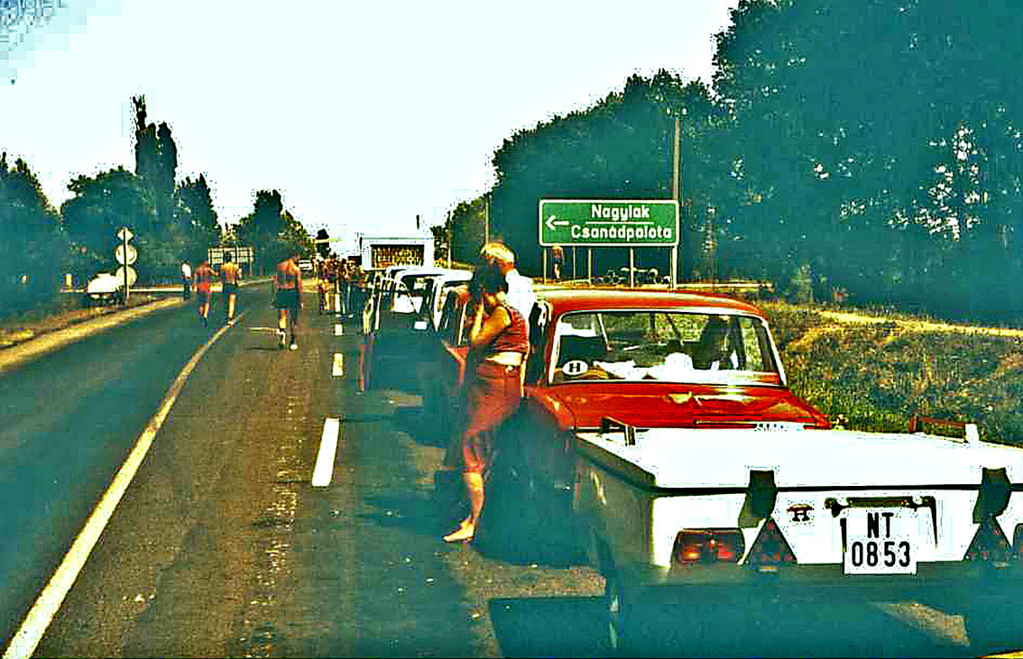
Warteschlange an der ungarisch-rumänischen Grenze