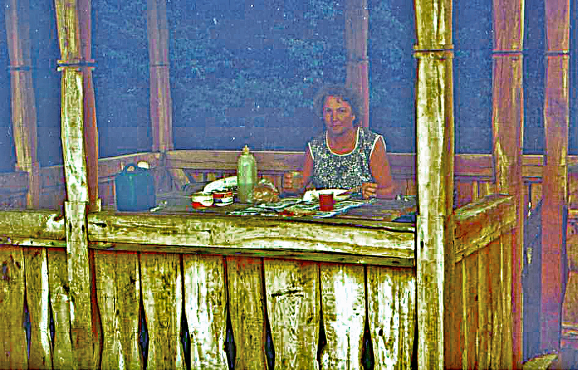
Rastplatz nördlich von Petrova