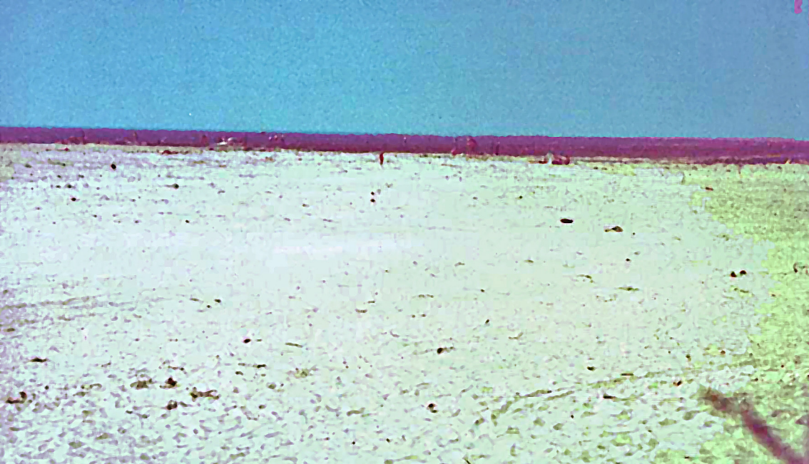
Strand am Schwarzen Meer beim Sulina Donau-Arm