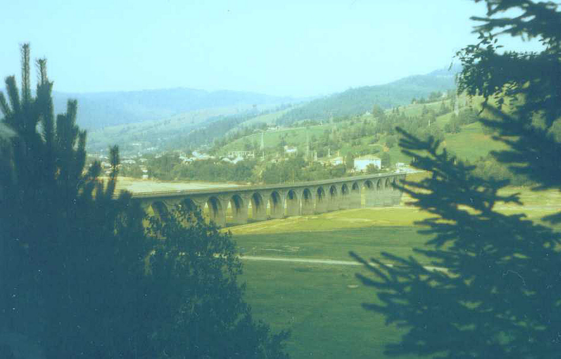
Viadukt am oberen Izvorul Muntelui