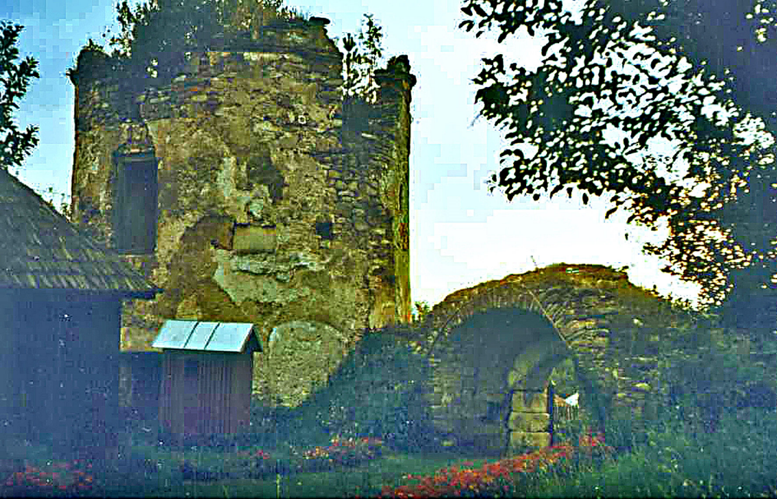
Klosterruine bei Durau