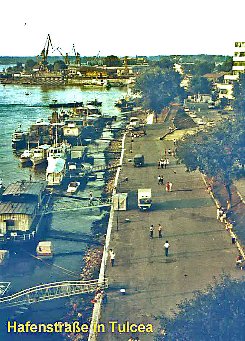
Hafenstraße in Tulcea