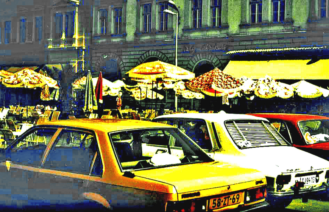
Vor dem Eiskaffee in Szeged