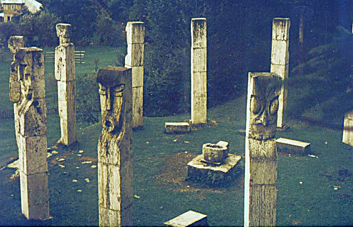
Ehrenmal bei Mosei