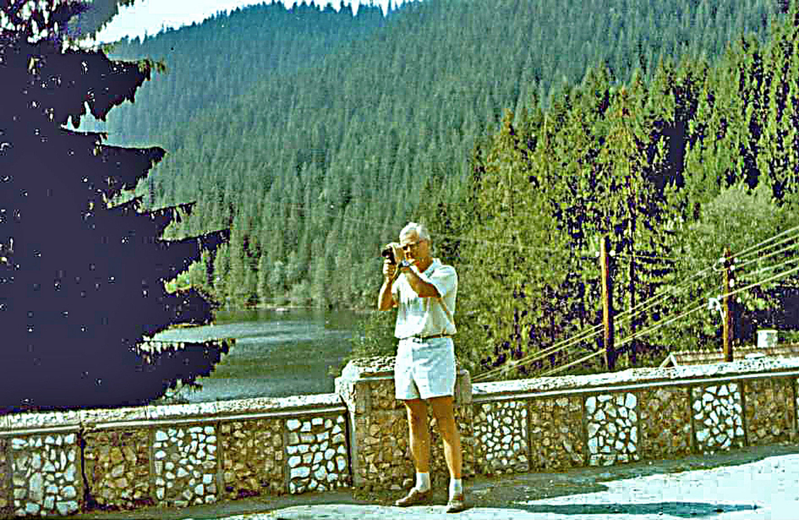
Am Lacul Rosu