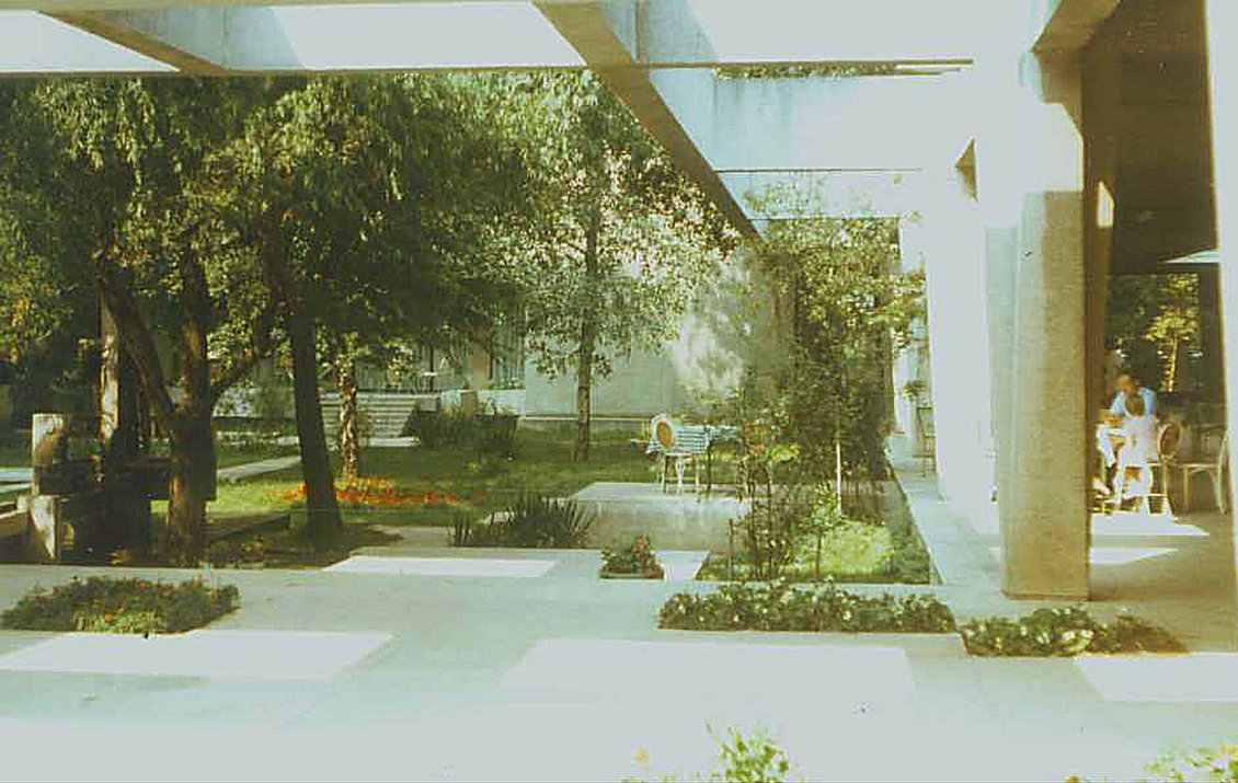
Innenhof vom Hotel Unirea