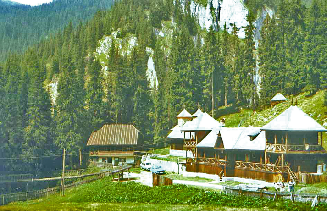
Kloster im Jalomitza-Tal