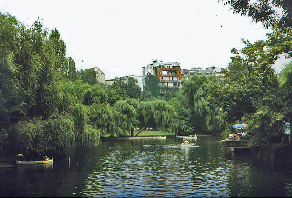
Park in Bukarest