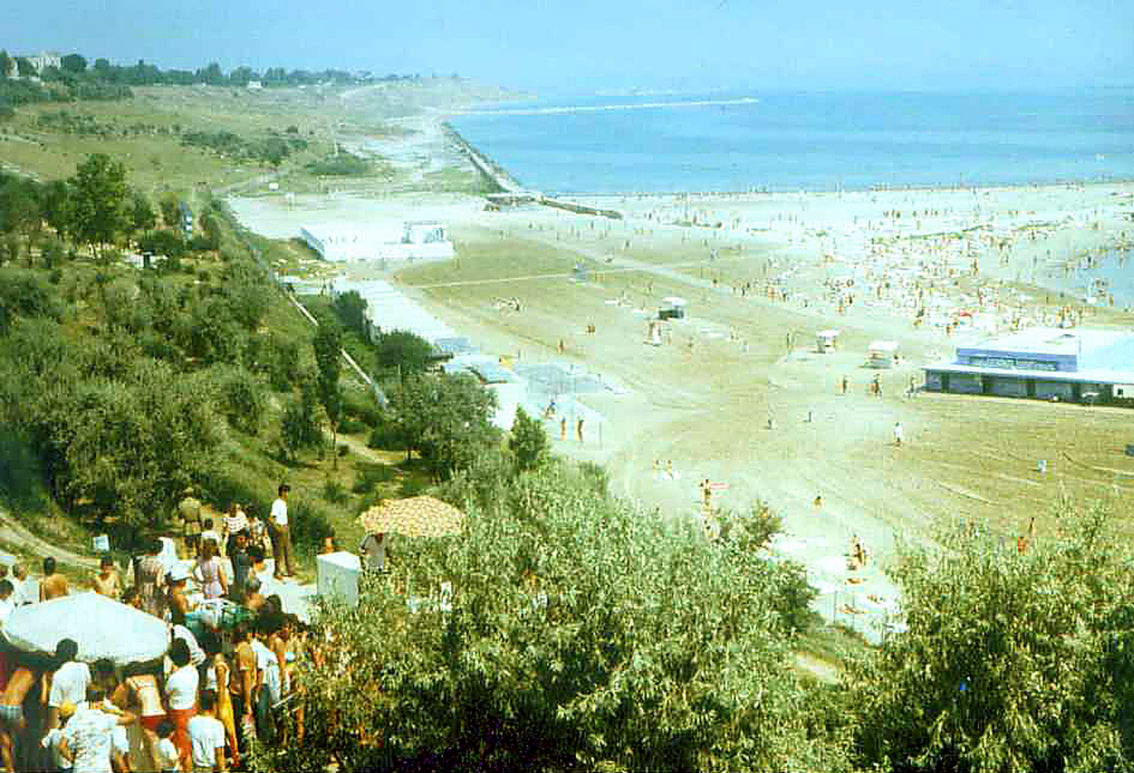
Strand bei Mangalia