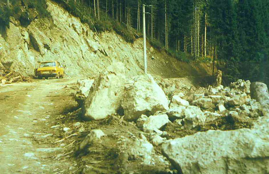
Straße am Jalomitza-Staudamm