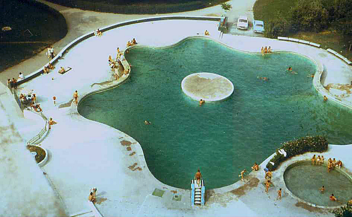
Pool vom Hotel Unirea