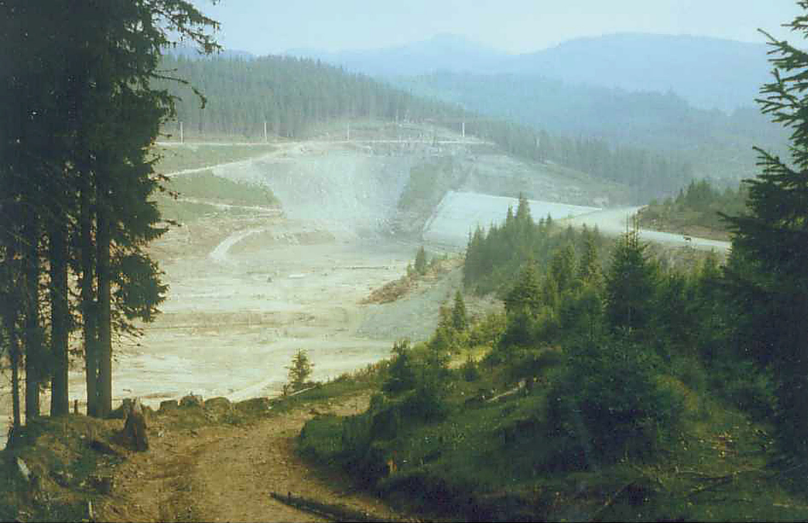
Staudamm im Jalomitza-Tal