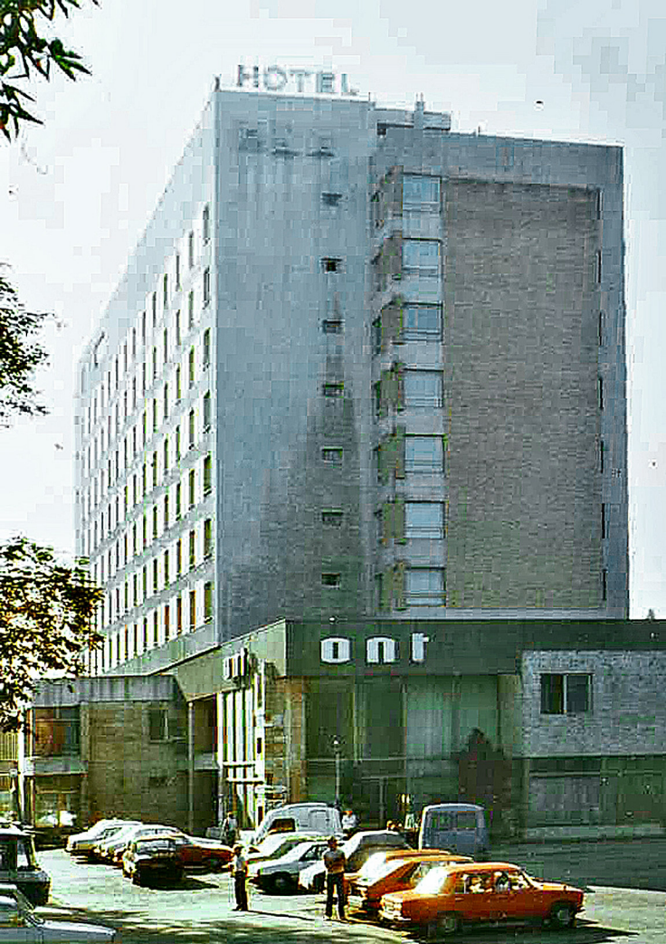
Hotel Dacia in Oradea