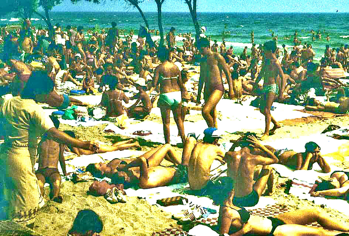
Strand vor dem Hotel Dacia