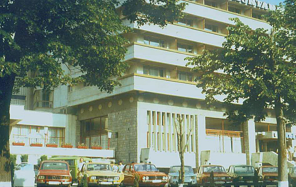
Hotel Montana in Sibiu