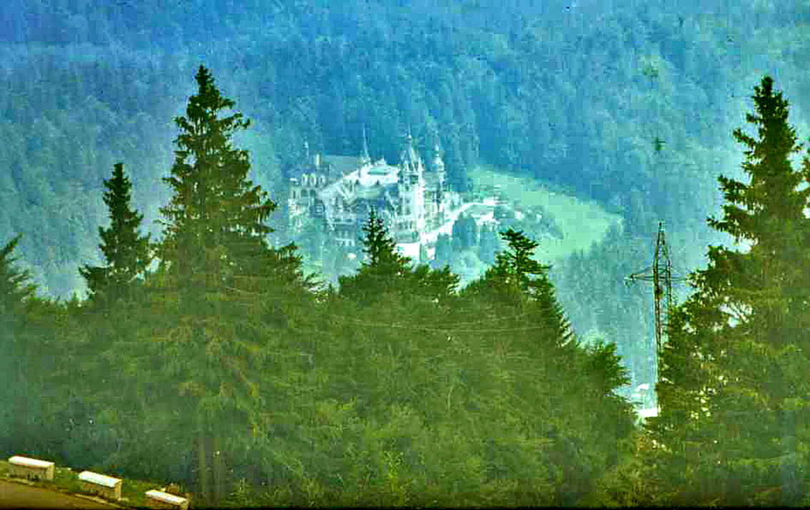
Schloß Peles von Cota 1400