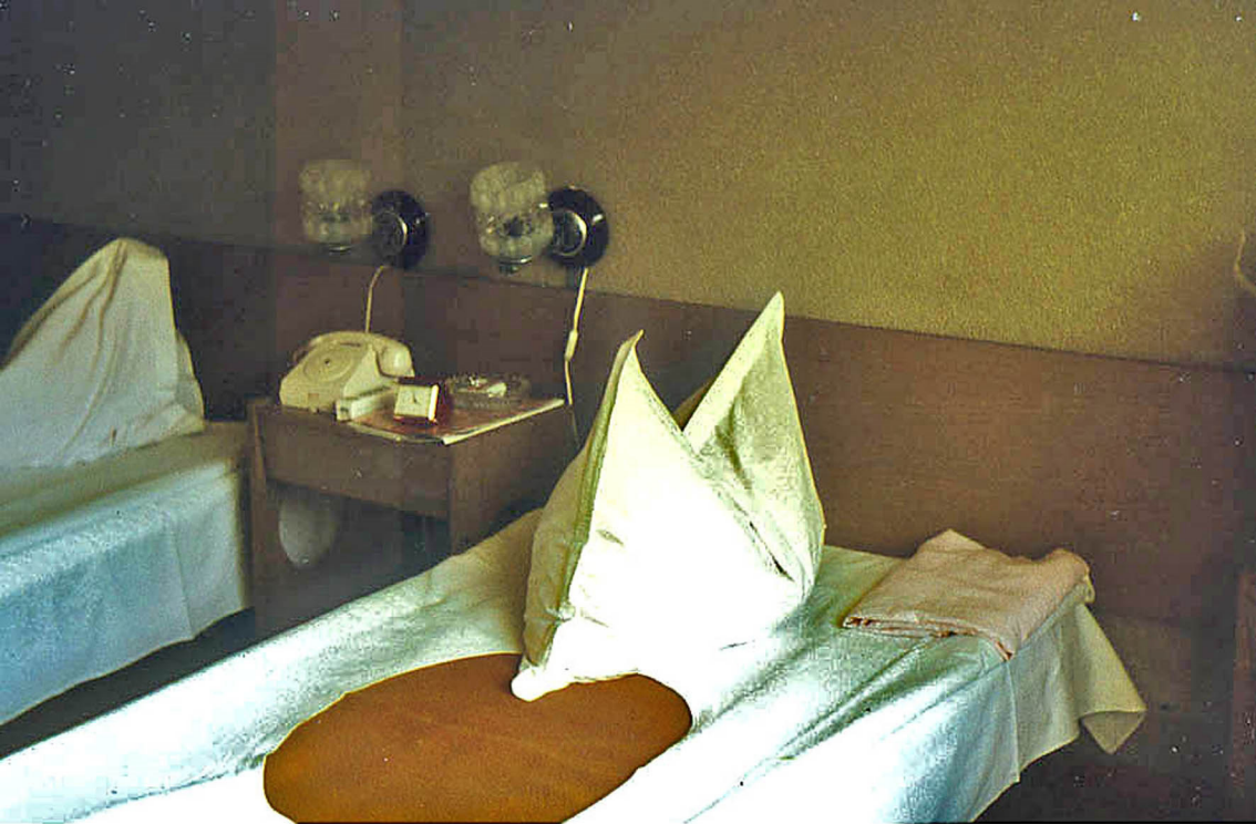
Unser Zimmer im Hotel Unirea