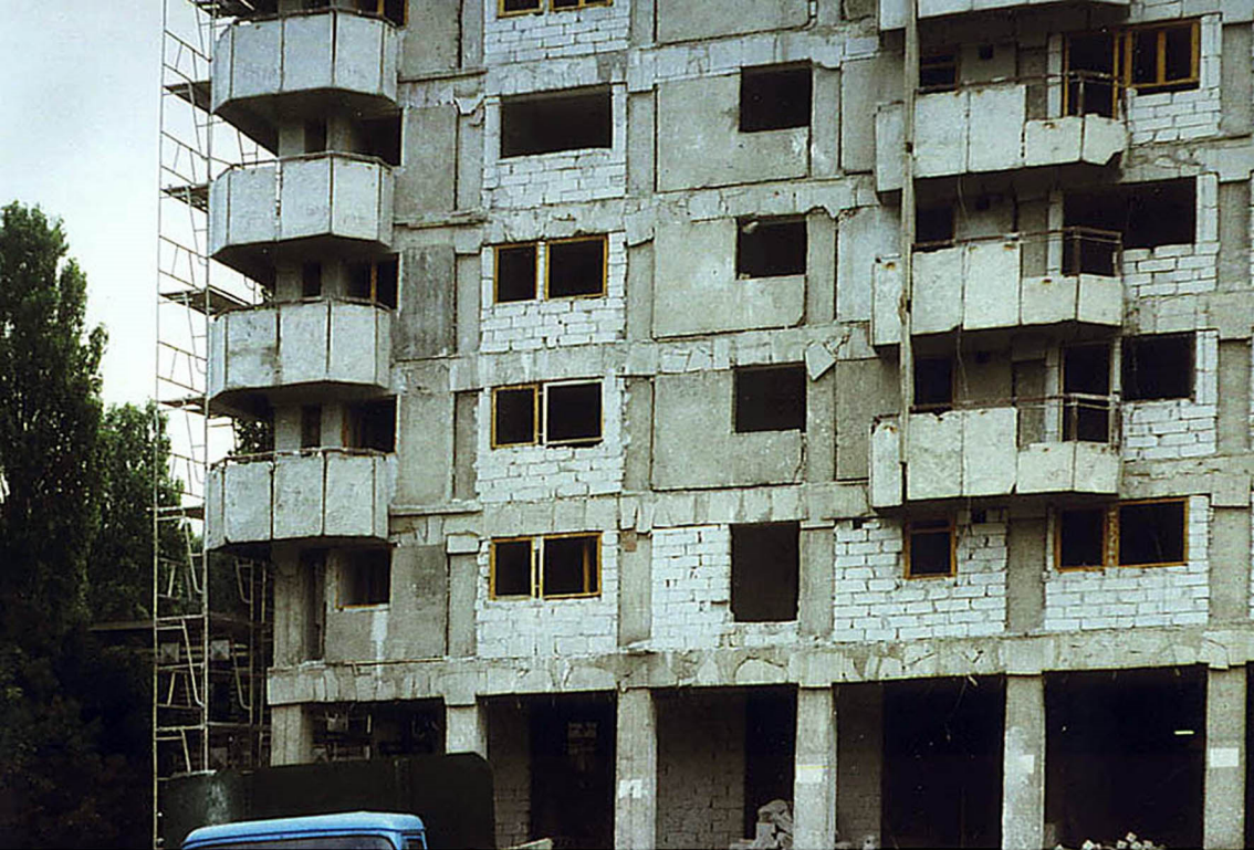
Hotel Union nach dem Erdbeben