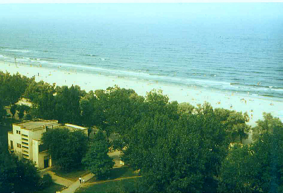
Strand vor dem Hotel Unirea