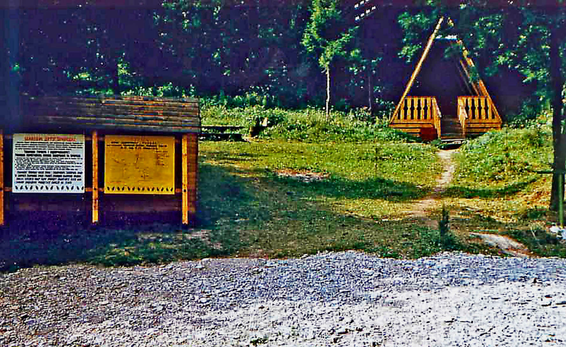
Rastplatz zwischen Ushgorod und Lwow