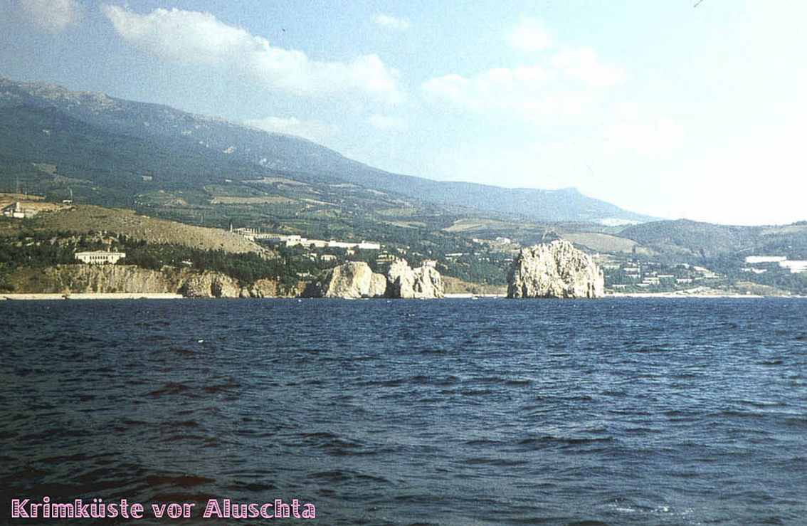
Krimküste vor Alushta