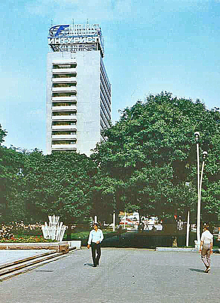
Intourist-Hotel, Rostow n. D.