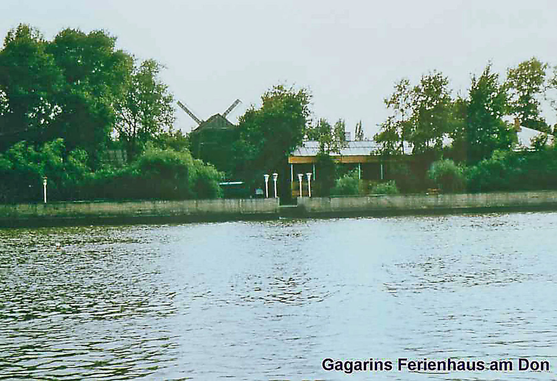
Gagarins Ferienhaus am Don