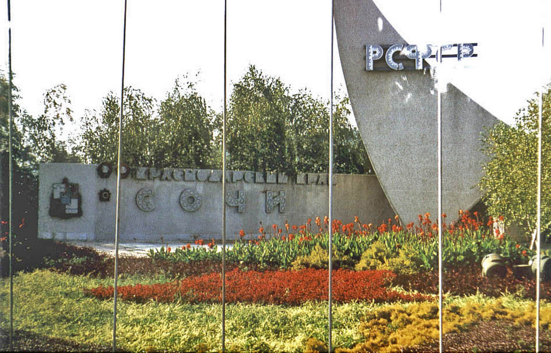
Südgränze der RSFSR Sotschi