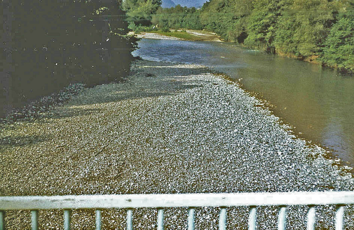
Stundenbrücke - Grenze zwischen Europa und Asien