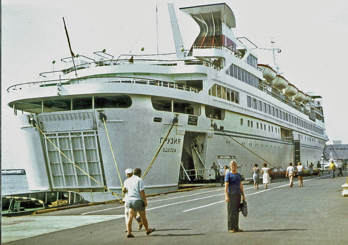
Kreuzfahrtschiff Grusia im Hafen von Sotschi