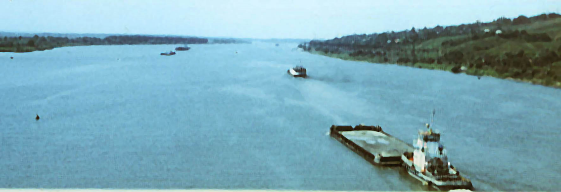
Der Don bei Rostow