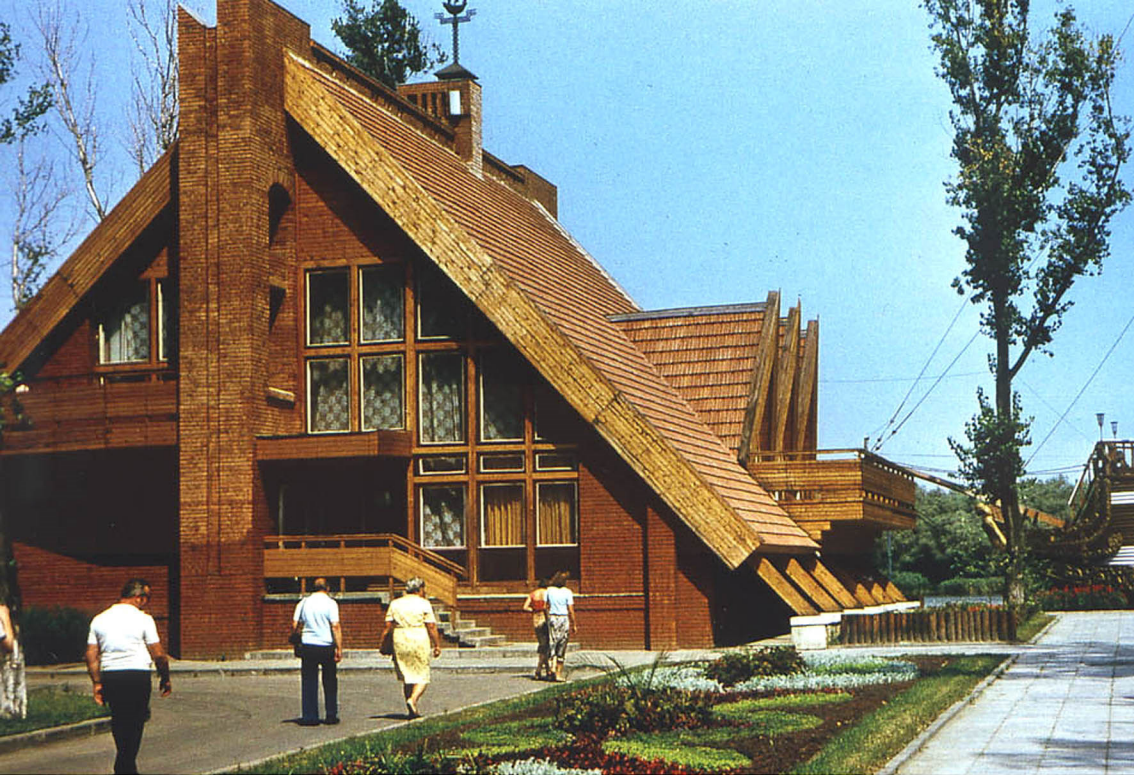
Gästehaus am Don