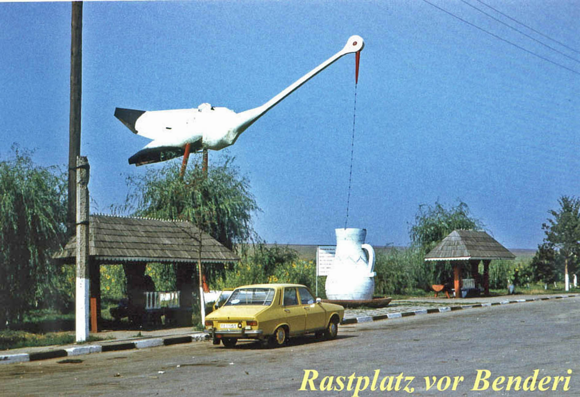
Rastplatz vor Benderi