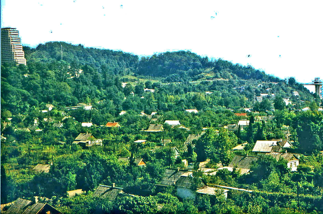
Dagomys bei Sotschi