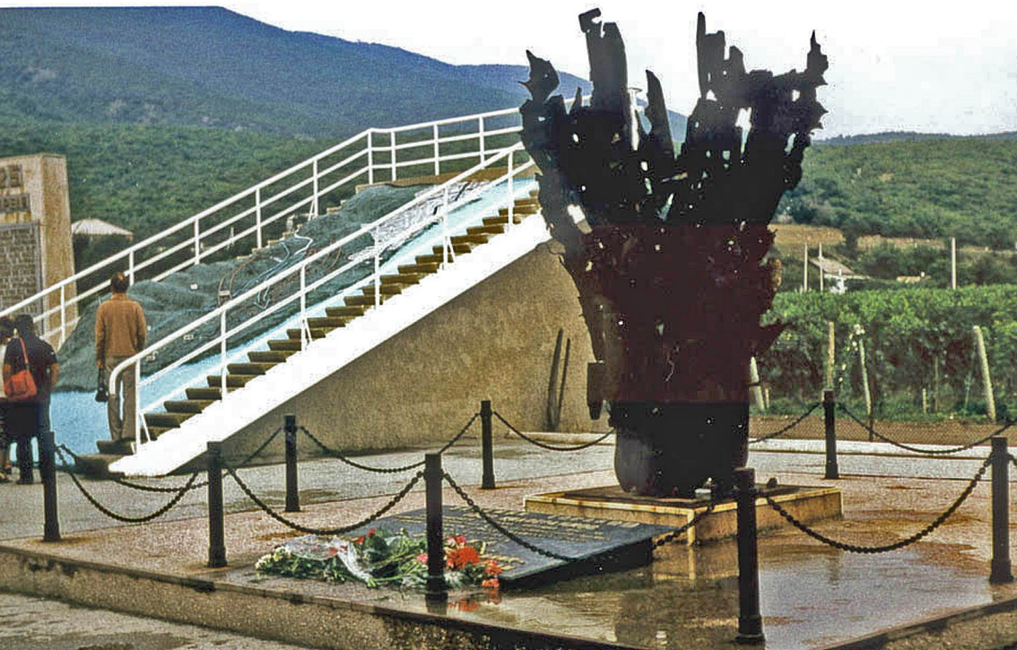
Denkmal in Novorossisk