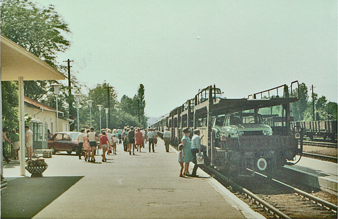
Baneasa-Bahnhof in Bukarest