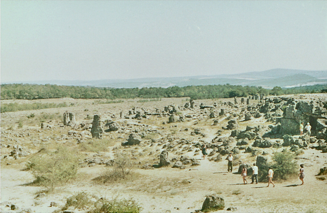
Steinerne Wald bei Varna