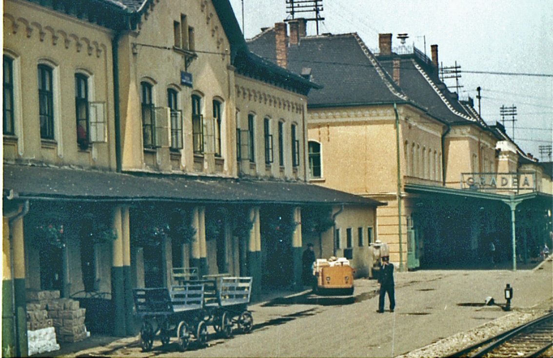
Grenzbahnhof in Oradea