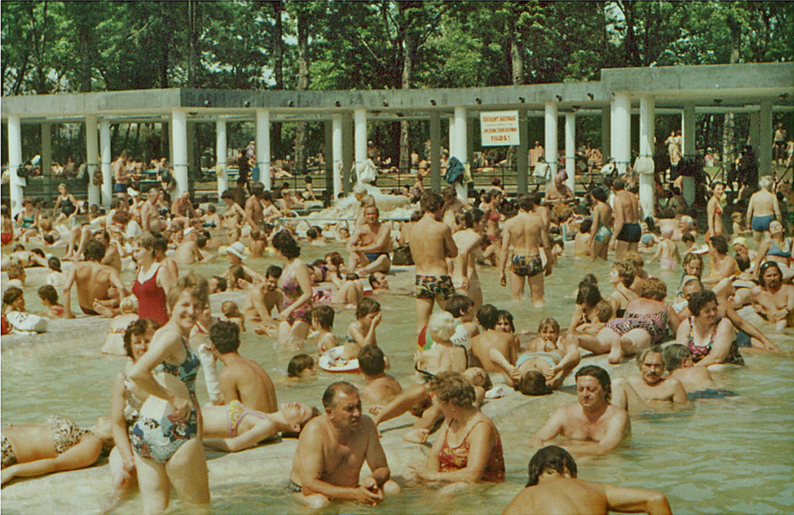
Palatinus-Bad in Budapest