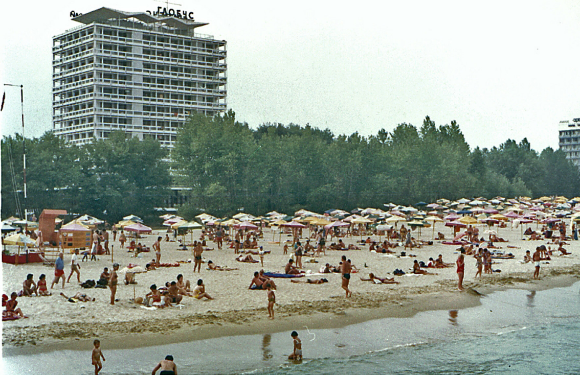
Strand beim Hotel Glarus