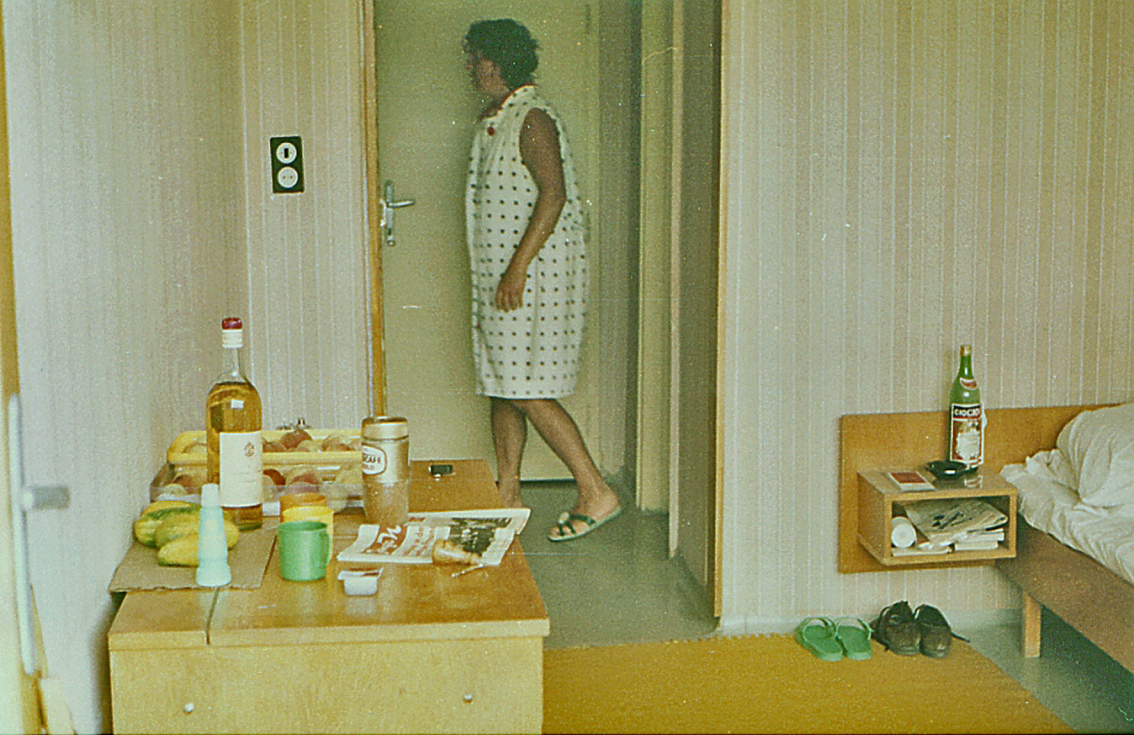
Unser Zimmer im Hotel 'Kristal 2'