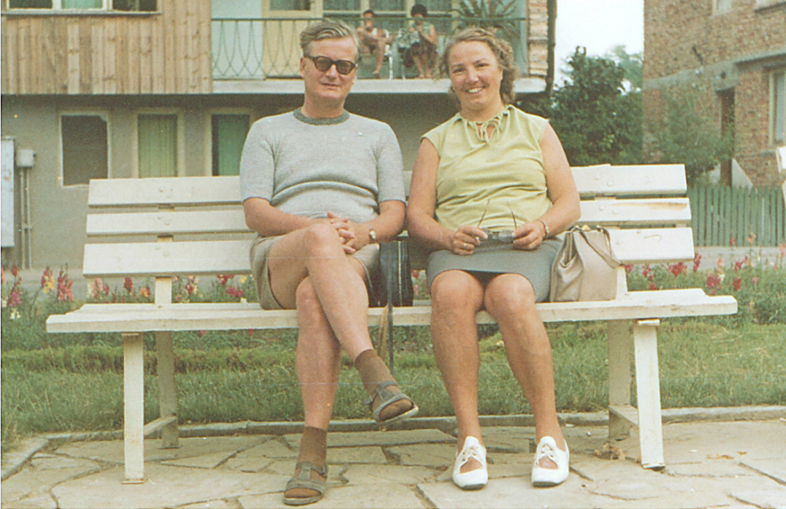
Rast in Nessebar