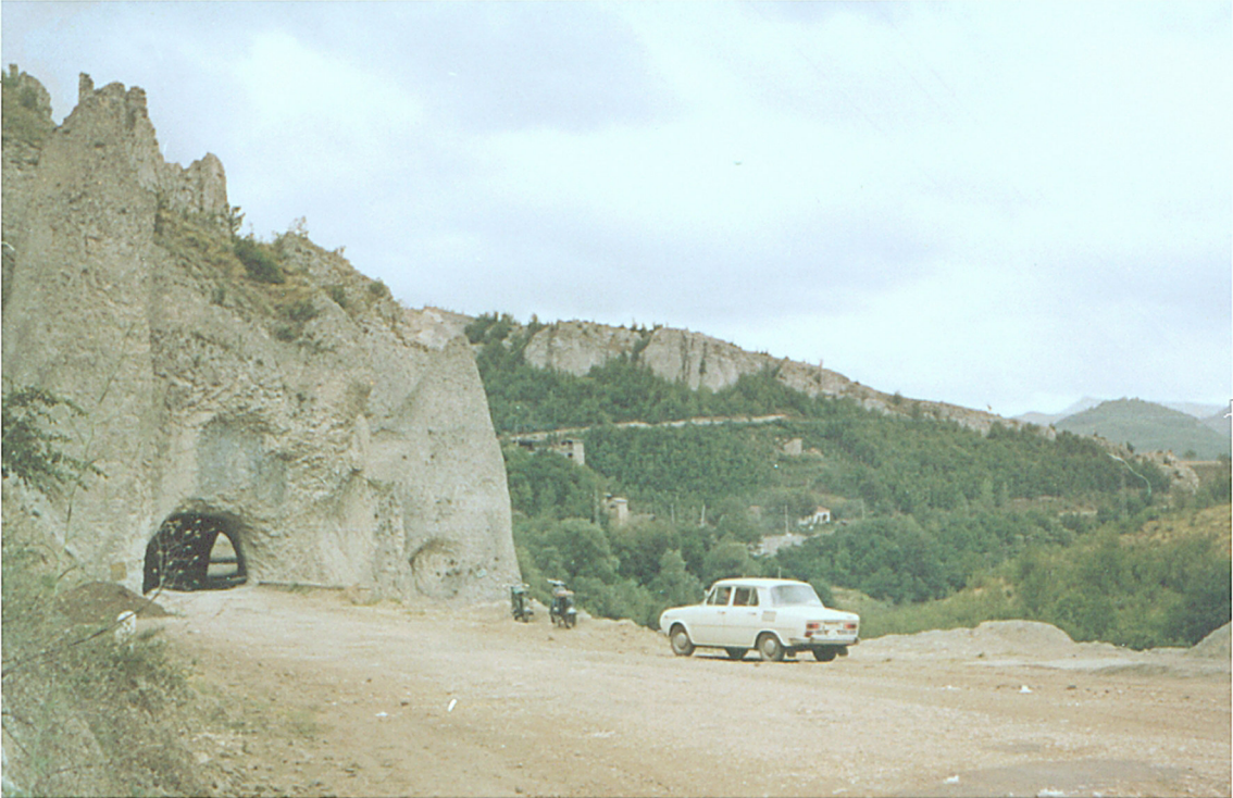
Paß zwischen Aitos und Asparuhovo