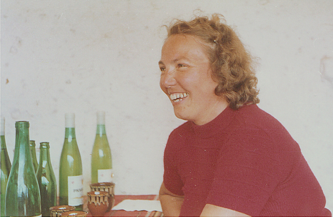
Bei der Grillparty