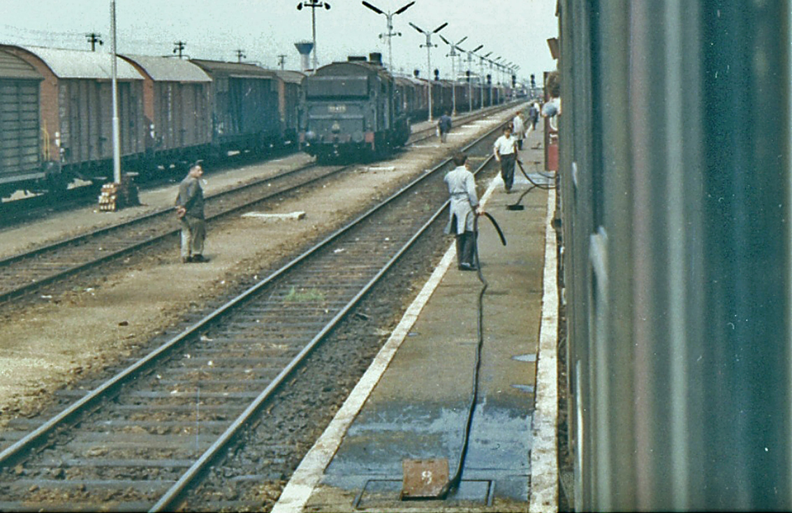
Prag - beim Wasser auffüllen