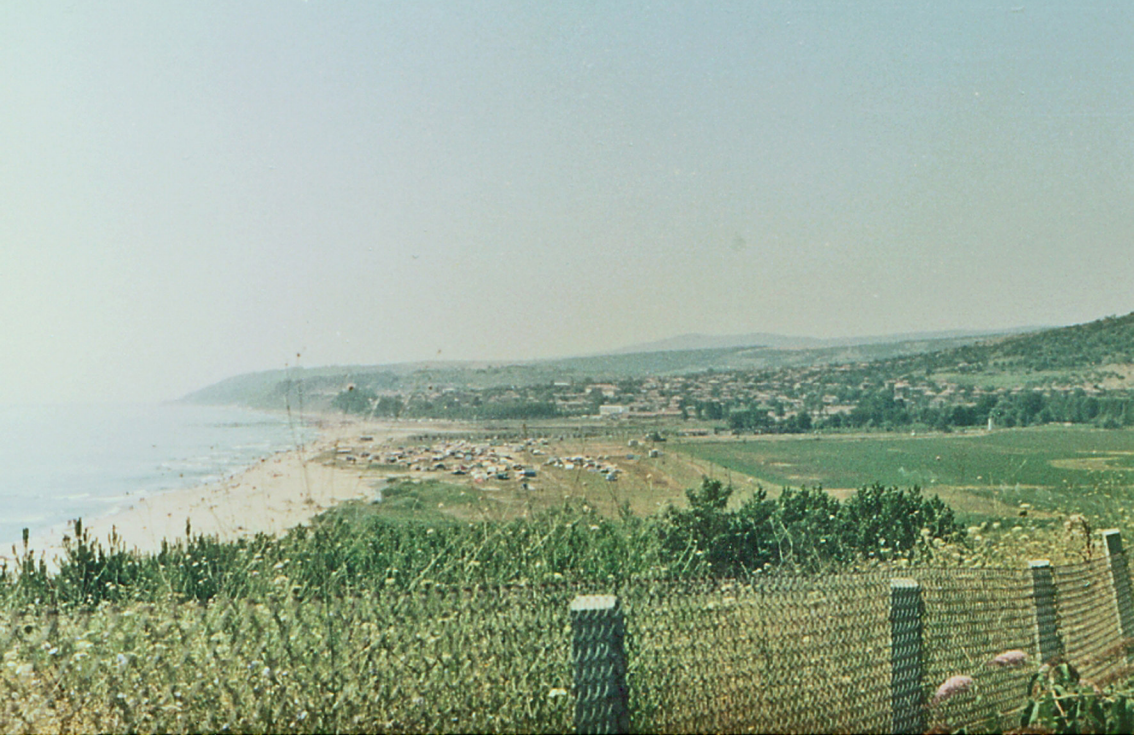
Blick vom Kap Galata nach Süden