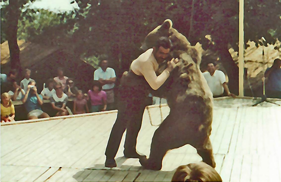
Ringkampf mit dem Bär