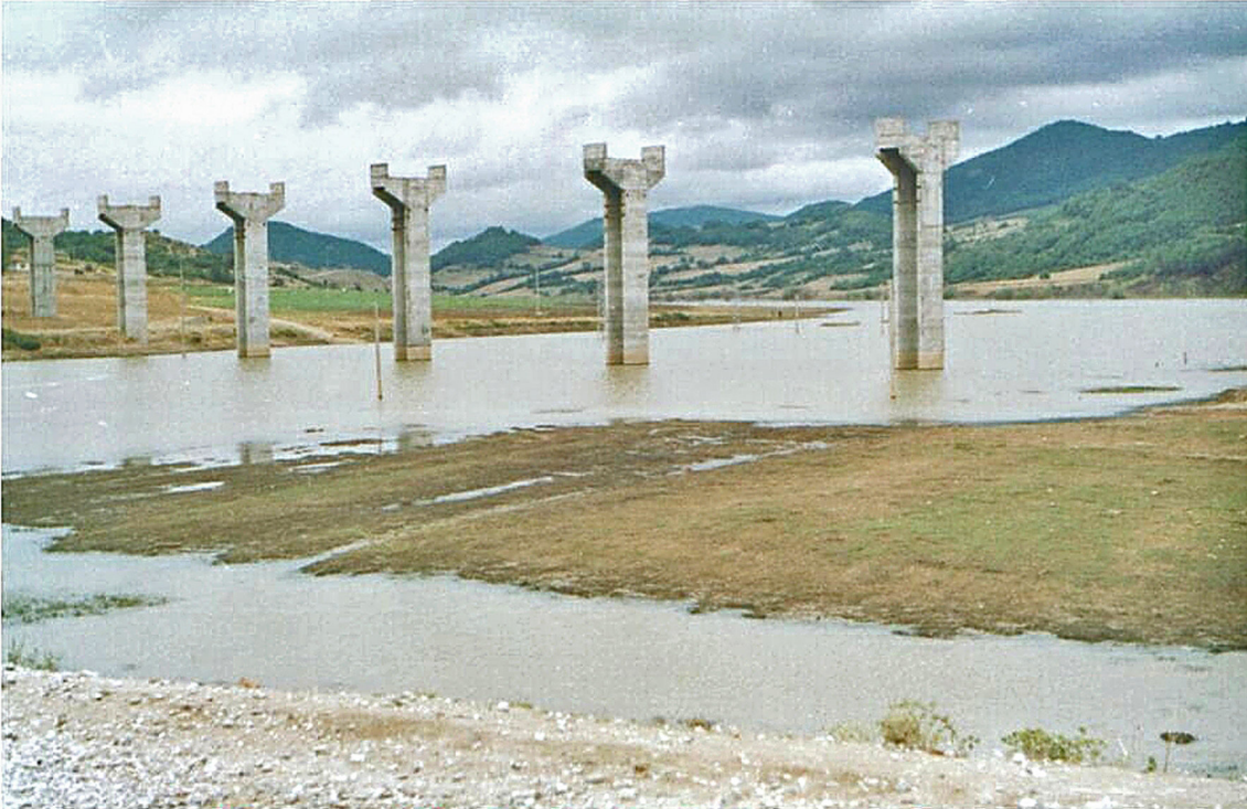
Kamschia-Tal bei Asparuhovo