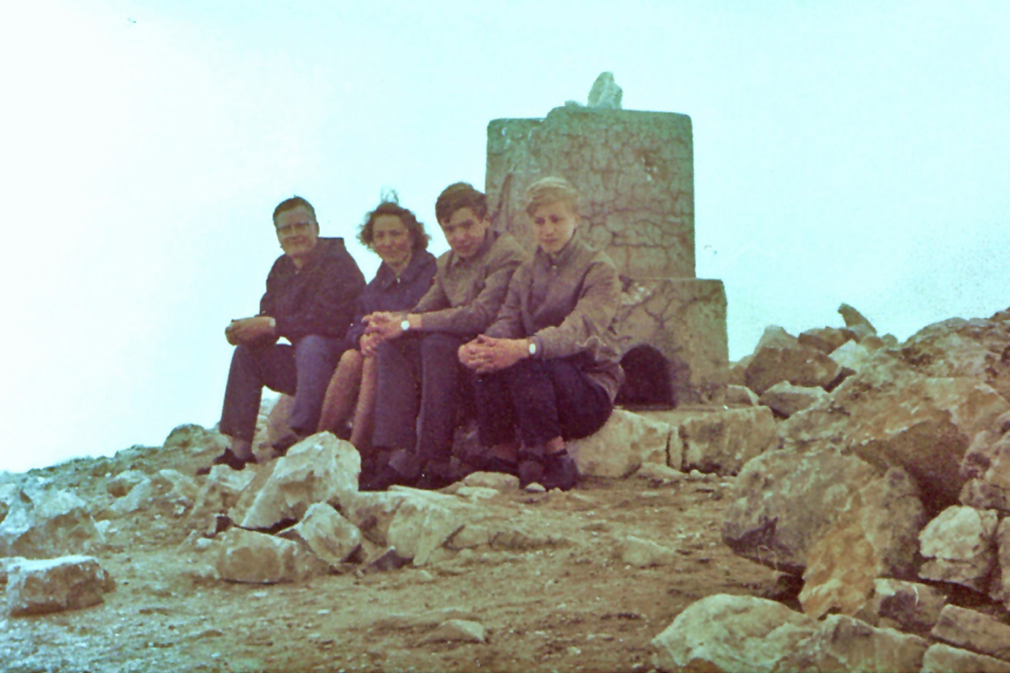
Auf dem Gipfel des Vichren