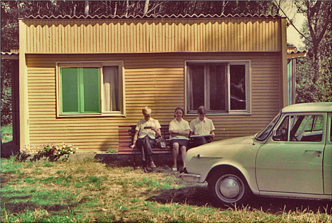
Im Camping Maritza