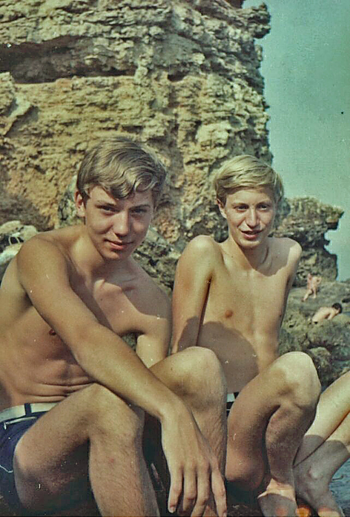
am Kap Kaliakra