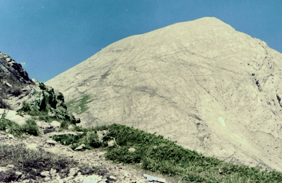
Vichren (2914 m)