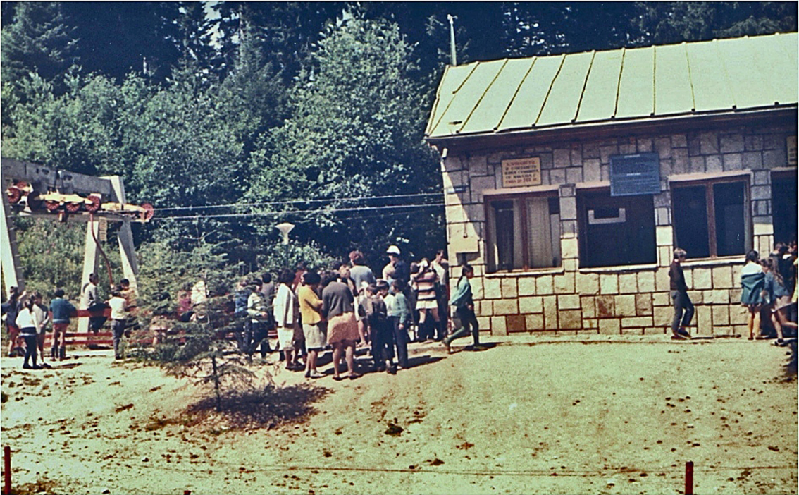
Talstation in Borovez