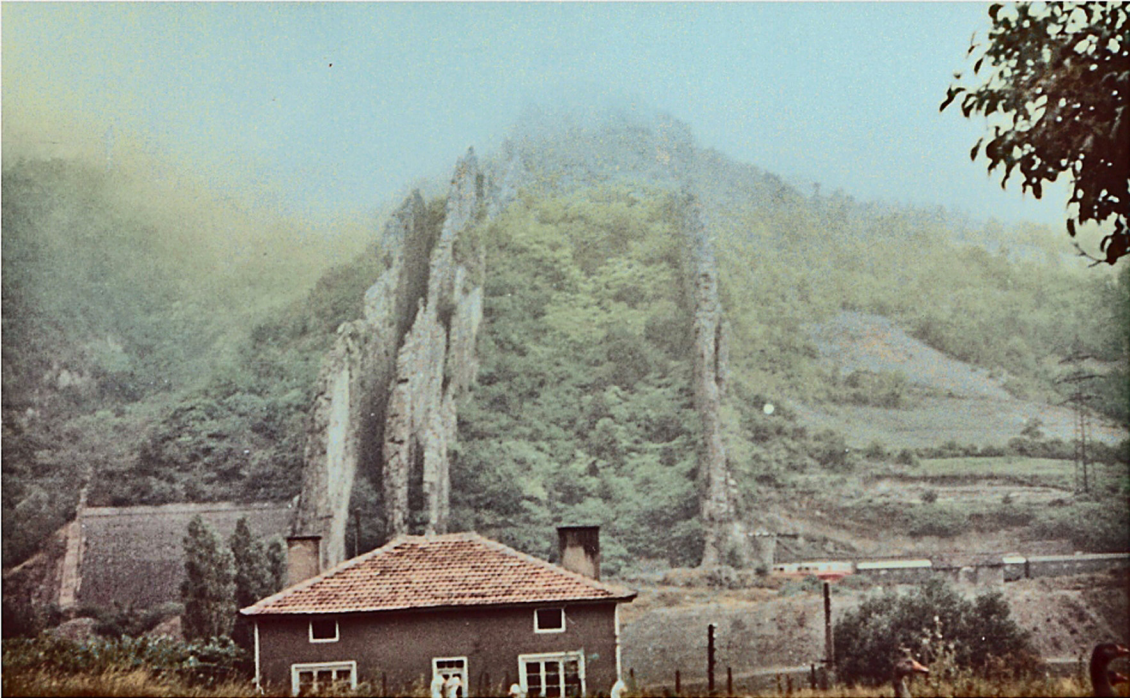
Ritlite Felsen im Vitoscha Gebirge