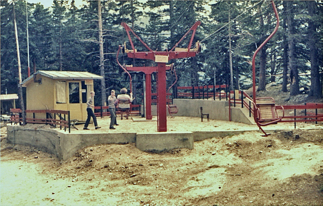
Bergstation in Borovez