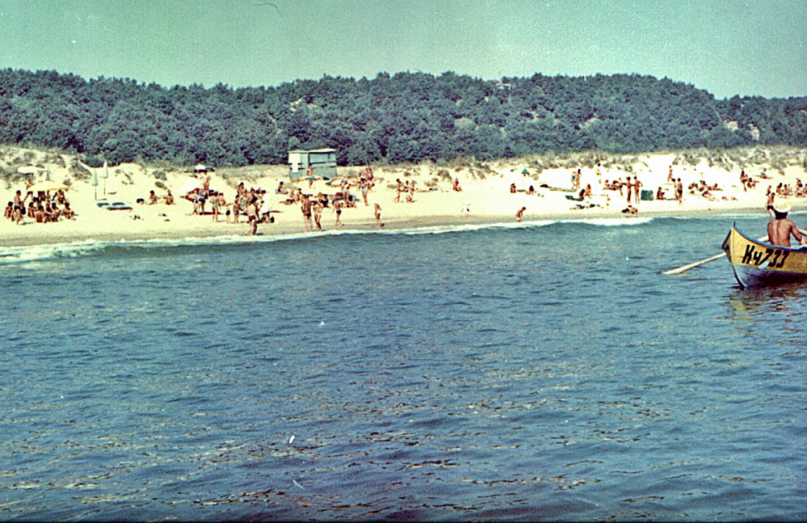
Strand vor Camping Horizont