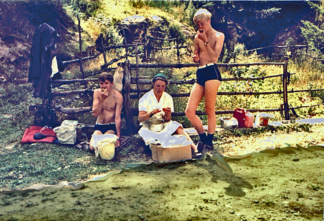
Rast beim Avramov-Paß