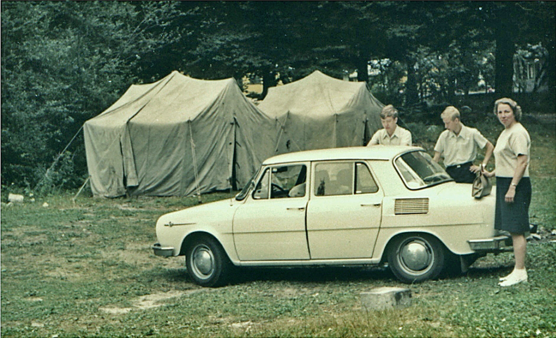
Camping Bor beim Rila-Kloster