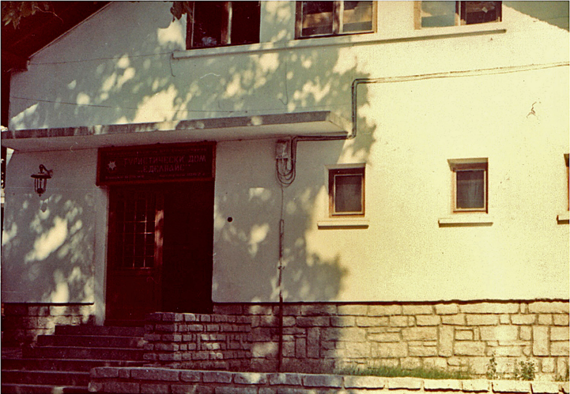
Touristenheim in Raslog